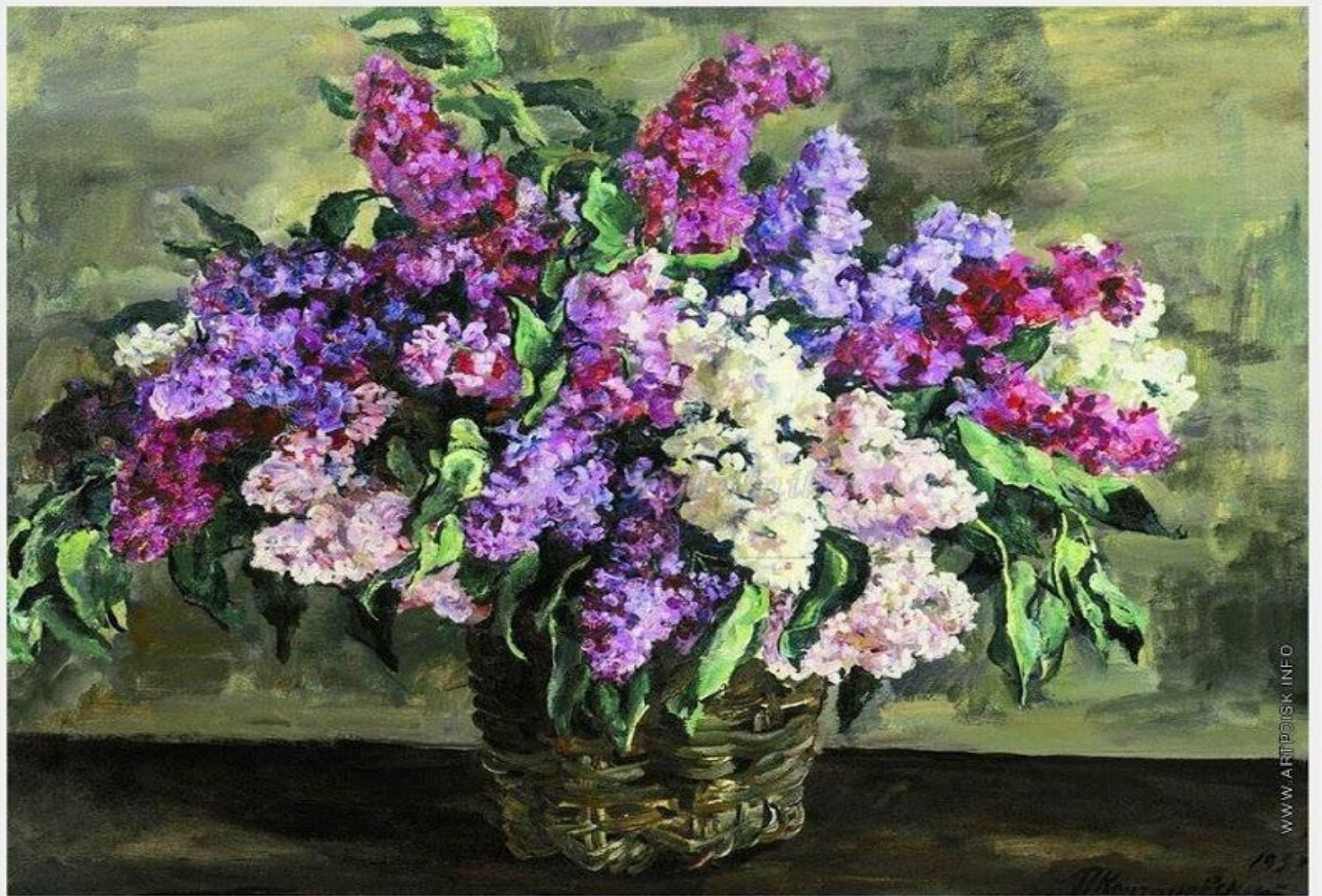
Кончаловский «Сирень в корзине».