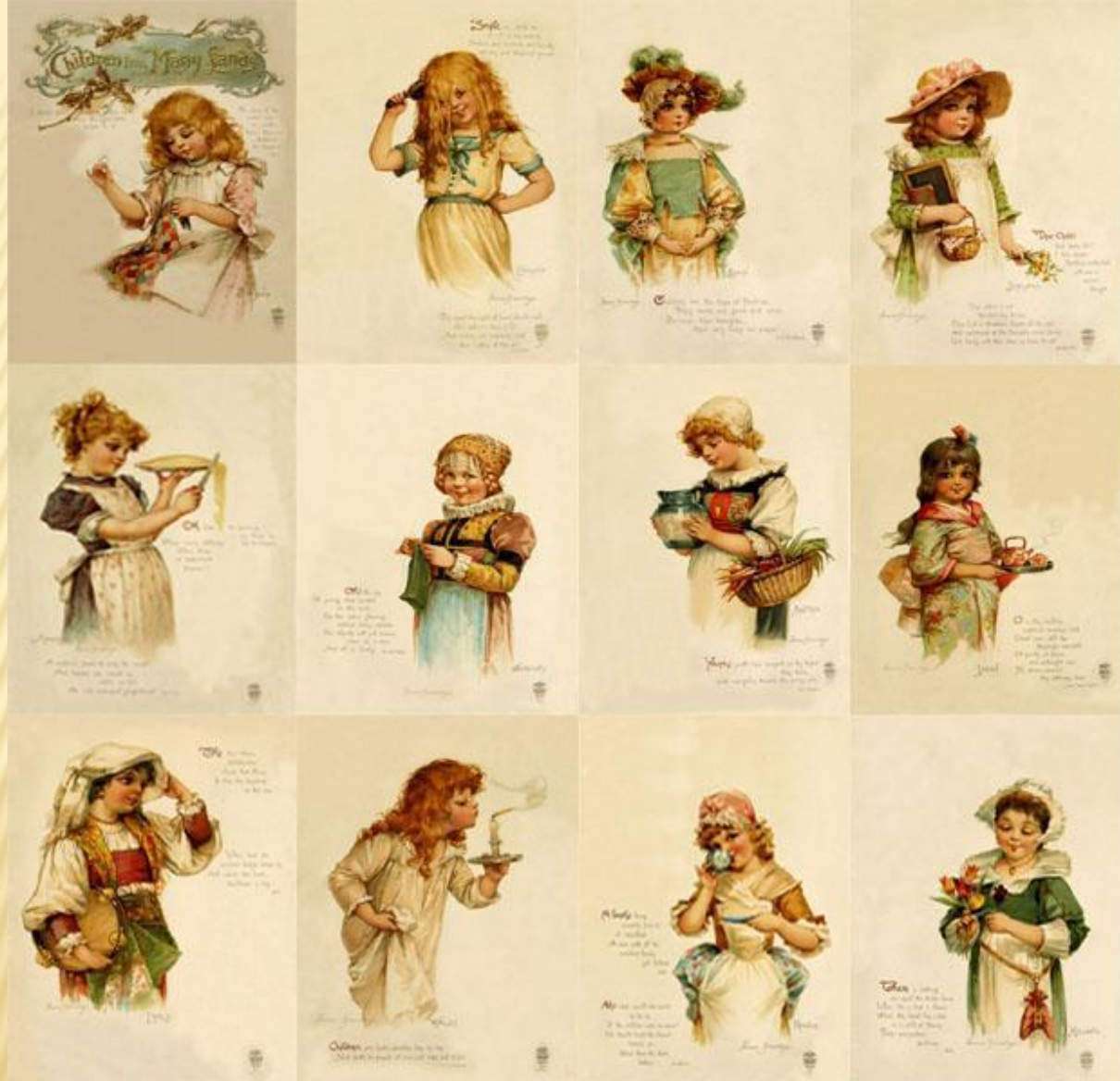
Дети разных стран. Серия открыток 1879 г.