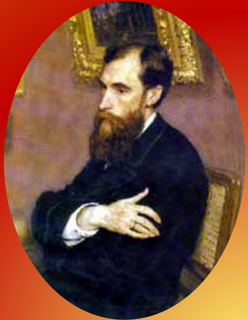
РАБОТА И.Е. РЕПИНА. 1883.