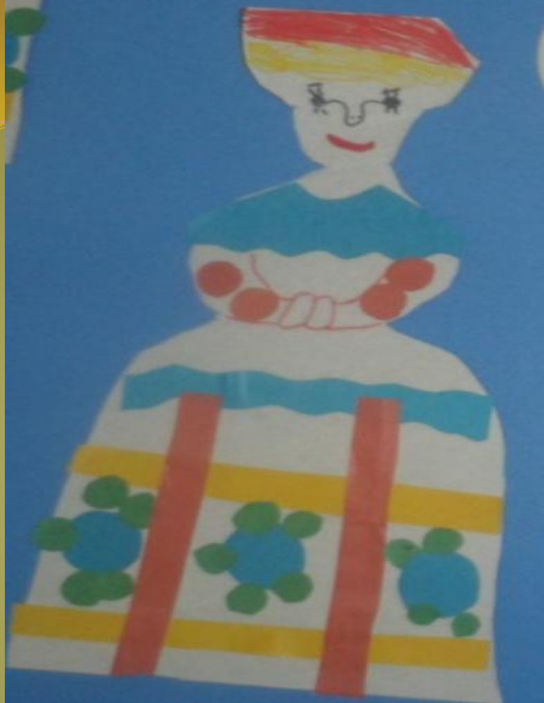
Аппликация «Дымковская барышня»