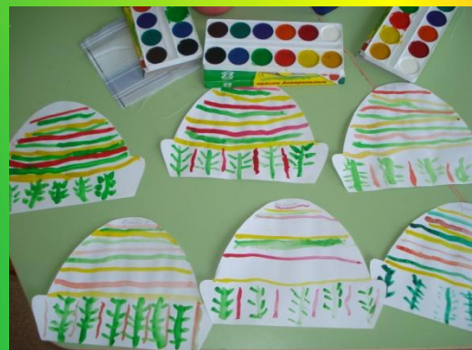
Рисование «Украшение шапки»