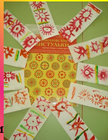
Рисование е «Цветок»