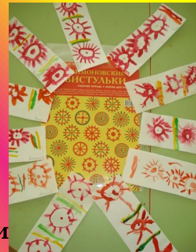
Рисование е «Цветок»