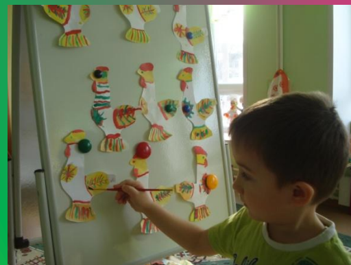
«Роспись и лепка петушка»