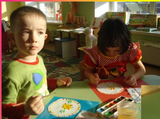
«Роспись декоративной тарелки»