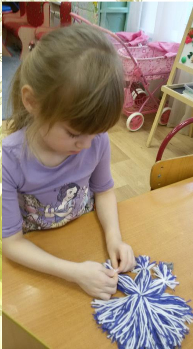
«Объёмная снежинка из нитей»