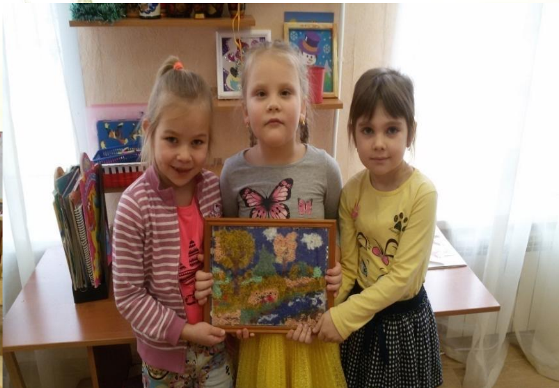
Рисование осеннего пейзажа «По дорожкам осени»