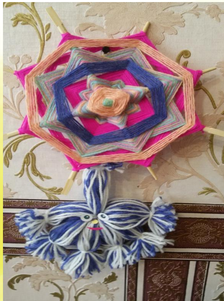
Объёмные работы «МАНДАЛА» «Снежинка»