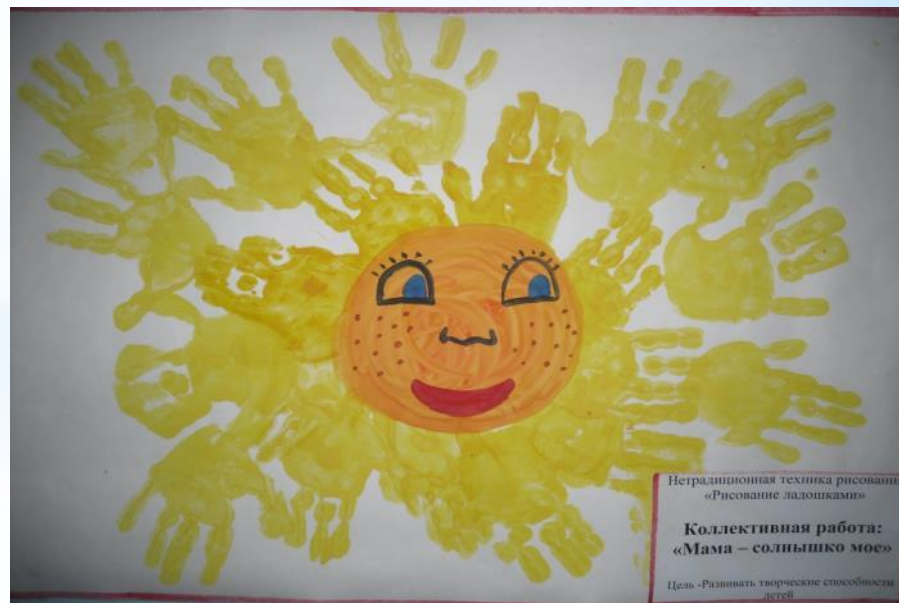
Нетрадиционная техника рисования «Рисование ладошками» Коллективная работа: «Мама – солнышко мое» Цель - Развивать творческие способности детей.