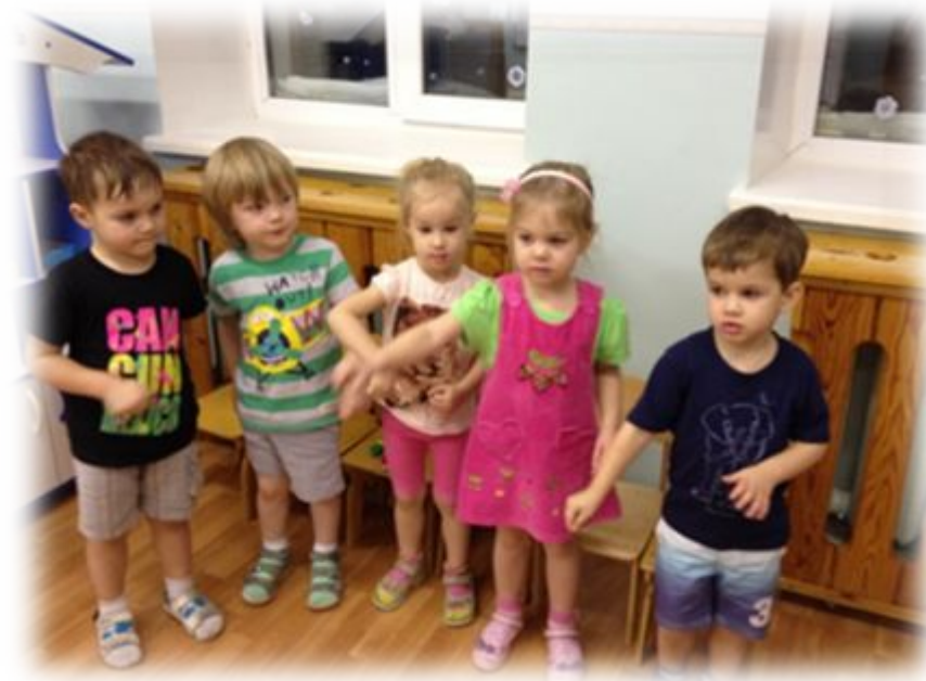
Игровое упражнение «Варим - варим мы компот».