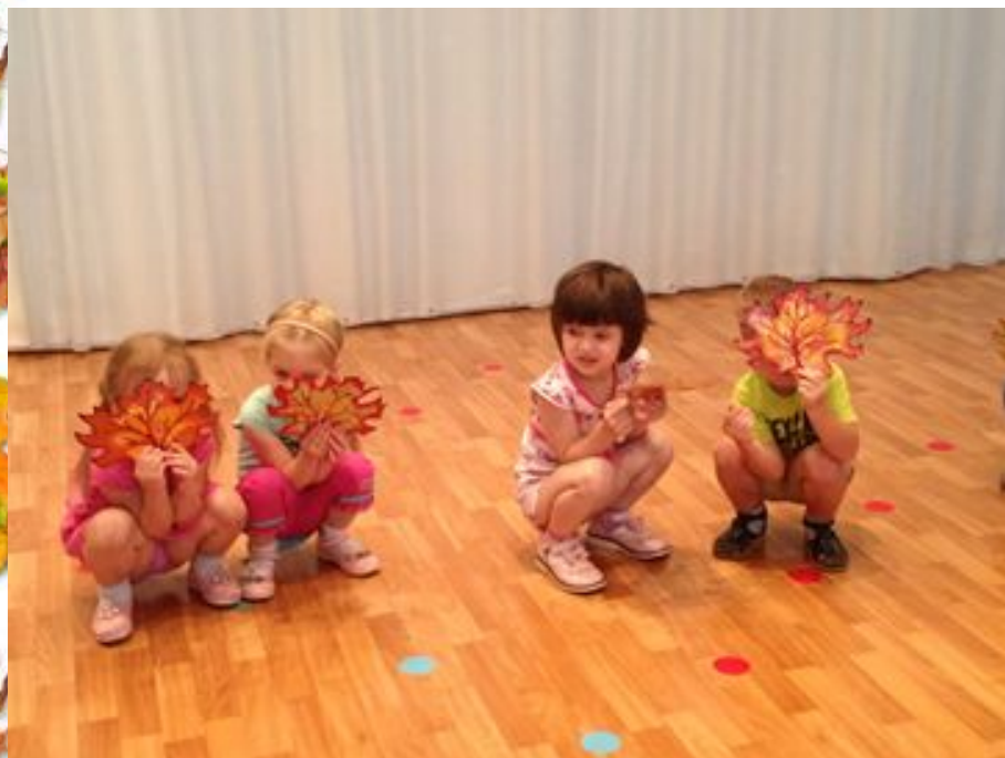
Игра «От дома к дому»