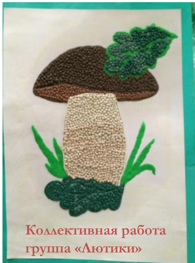
Коллективная работа группа «Лютики»