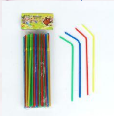
Соломинки для коктейля