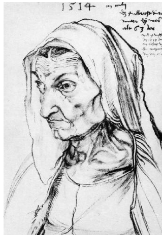
А. Дюрер « Портрет матери (Энн)»