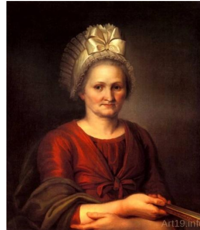
Венецианов « Портрет А.Л Венециановой»