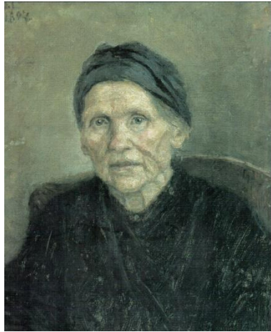
Василий Суриков « Портрет матери»