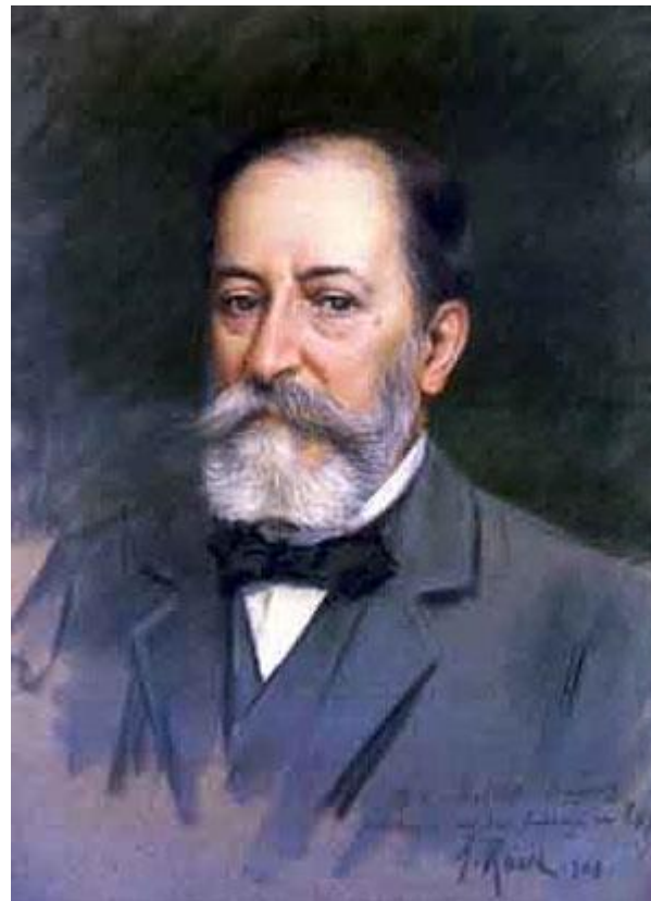
Шарль Камиль Сен-Санс