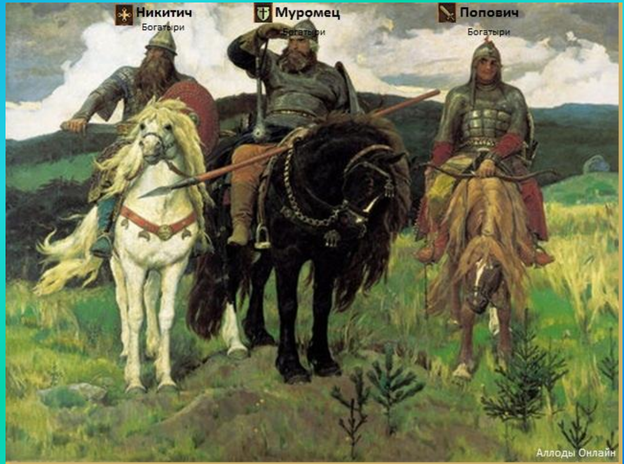
В.М. Васнецов «Богатыри» 1881г.

Мифологический жанр – это произведения искусства, в которых отражены мифологические сюжеты