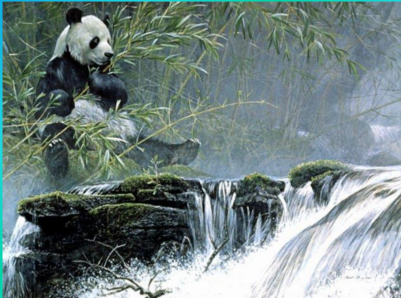
Р. Бейтман. «Панда у водопада»

Анималистика (Анималистический жанр), иногда также Анимализм (от лат. animal — животное) — жанр изобразительного искусства 1 , основным объектом которого являются животные, главным образом в живописи, фотографии, скульптуре, графике и реже в декоративном искусстве.