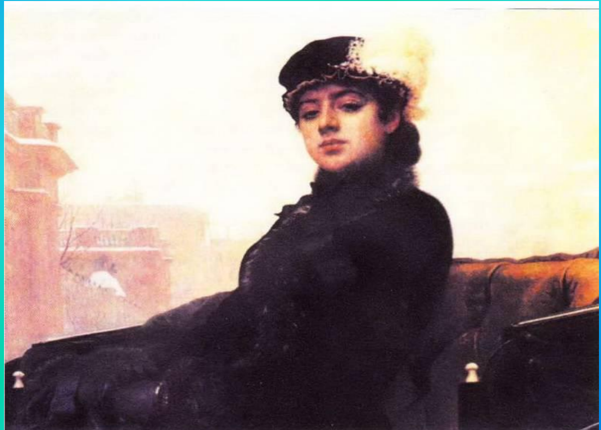
И.К. Крамской «Неизвестная» 1883г.

Портрет – это изображение человека в скульптуре, живописи и графике. Портреты, написанные художниками, доносят до нас образы людей прошедших эпох. Они как будто ожившая история.