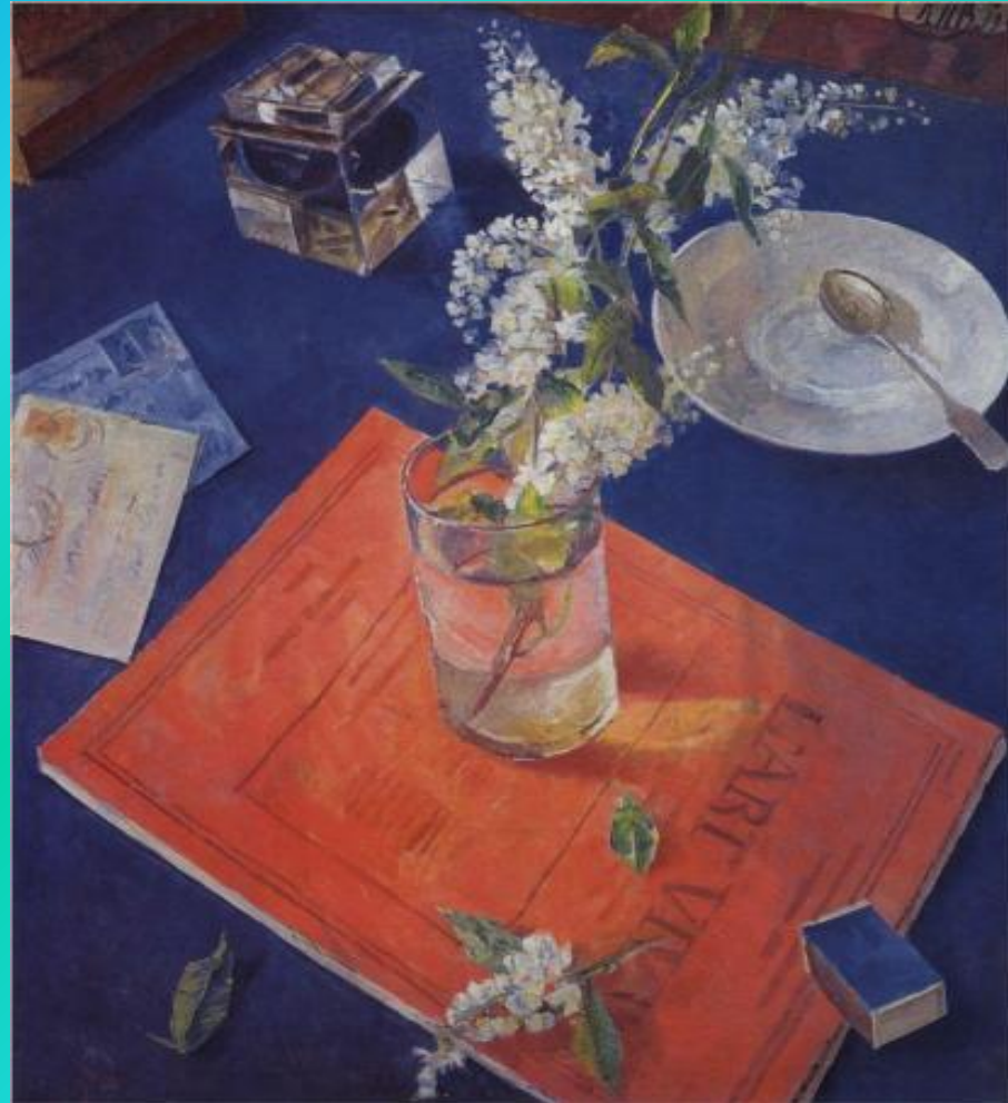
К.Петров-Водкин «Черемуха в стакане» 1932 г.

Натюрморт – слово французское, и значит оно буквально – «мертвая природа». Это картины, героями которых являются различные предметы обихода, фрукты, цветы или снедь (рыба, дичь и так далее). Натюрморты, написанные когда – то художниками, рассказывают нам не только о вещах. Они говорят о жизни и быте их владельцев, об их привычках.