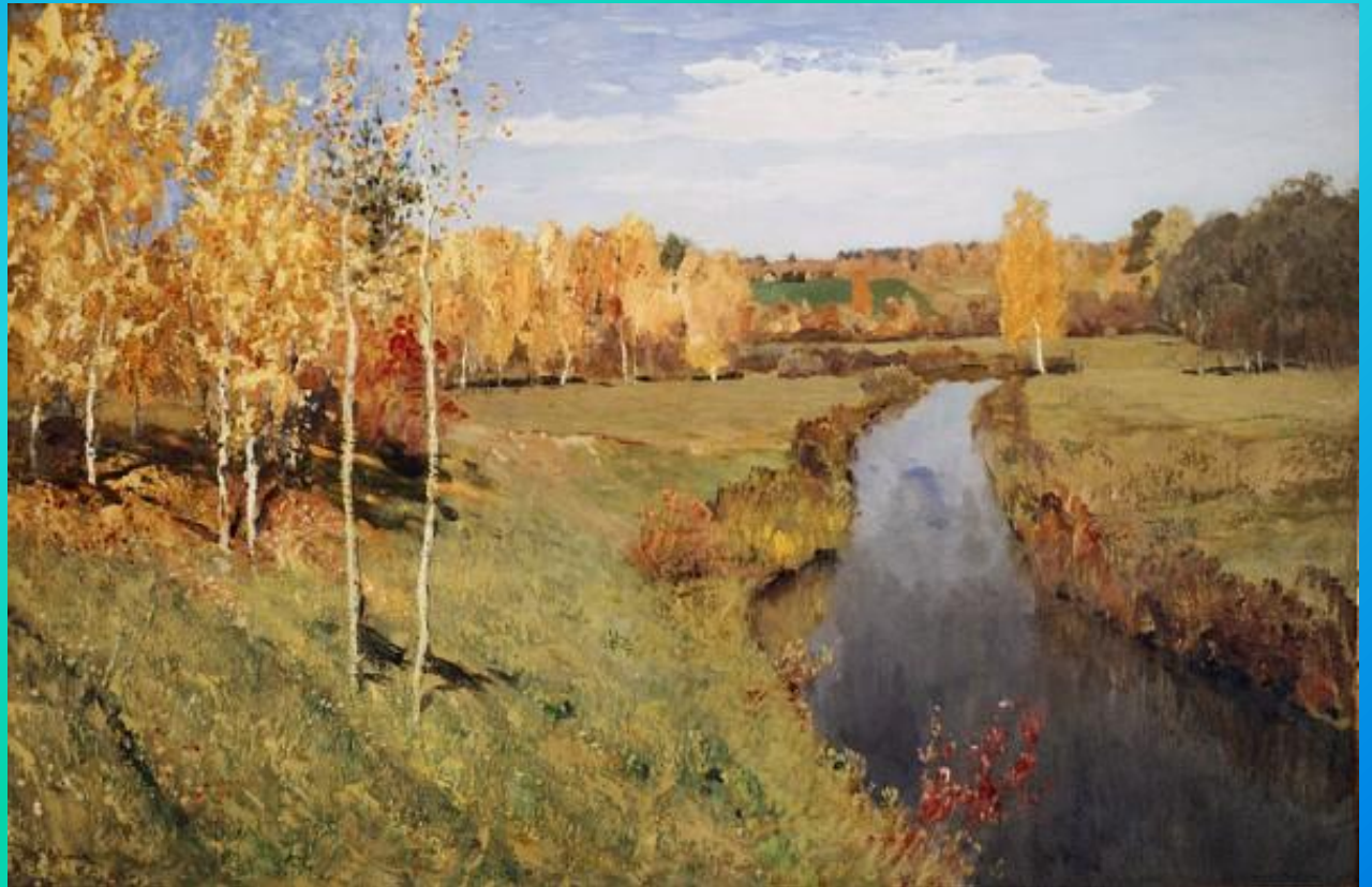
И.И. Левитан «Золотая осень». 1895г.

Пейзаж – картина, в которой природа стала её главным содержанием. Создали этот жанр голландские живописцы. Пейзажная живопись очень разнообразна. Есть пейзажи, точно передающие те или иные уголки природы, а есть такие, которые создала фантазия художника. Есть пейзажи, в которых художники сумели очень тонко передать состояние природы.