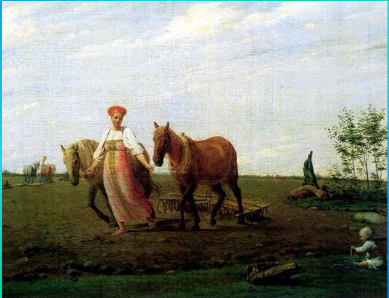
А.Г. Венецианов «На пашне. Весна». 1820г

Бытовой жанр – это картины, на которых отражены эпизоды из повседневной жизни людей.