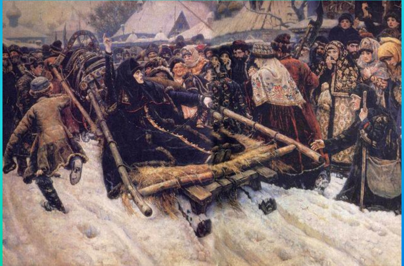
В.Суриков «Боярыня Морозова». 1887г.

Исторический жанр – это произведения искусства, в которых отражены реальные исторические персонажи или события.