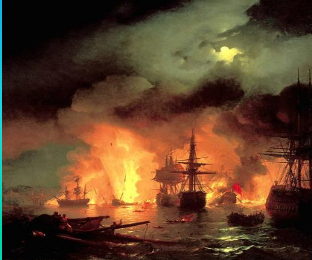
И.К. Айвазовский «Чесменский бой» 1848г.

Батальный жанр – это произведения искусства, в которых отражены военные эпизоды. Художник, который пишет на батальные темы, называется баталистом.