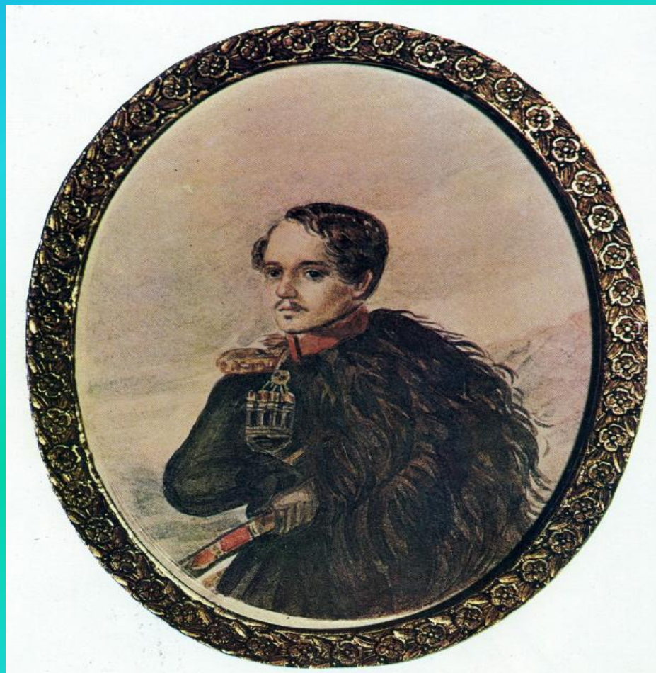
М.Ю. Лермонтов на Кавказе. 1837г.

Автопортрет — портрет самого себя. Обычно имеется в виду живописное изображение; однако автопортреты бывают и скульптурные, литературные, фото- и кинематографические и т. д.