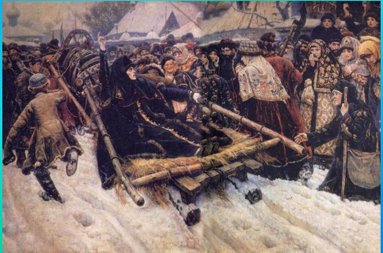
В.Суриков «Боярыня Морозова». 1887г.

Исторический жанр – это произведения искусства, в которых отражены реальные исторические персонажи или события.