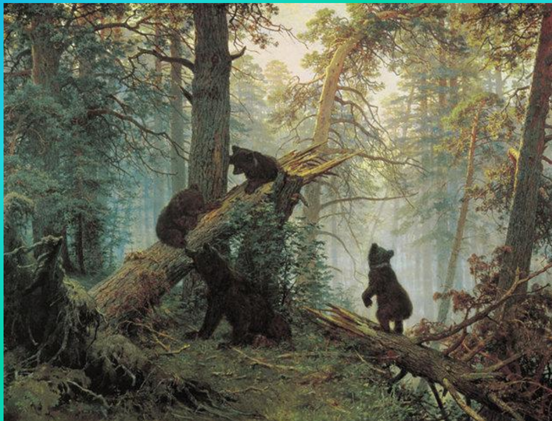
И.Шишкин. «Мишки в сосновом бору.» 1889г.