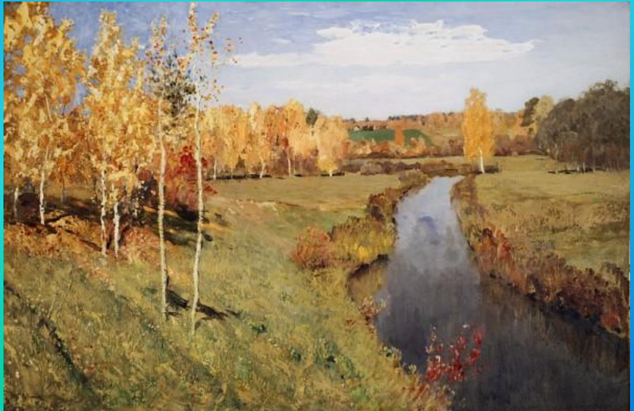
И.И. Левитан «Золотая осень». 1895г.

Пейзаж – картина, в которой природа стала её главным содержанием. Создали этот жанр голландские живописцы. Пейзажная живопись очень разнообразна. Есть пейзажи, точно передающие те или иные уголки природы, а есть такие, которые создала фантазия художника. Есть пейзажи, в которых художники сумели очень тонко передать состояние природы.