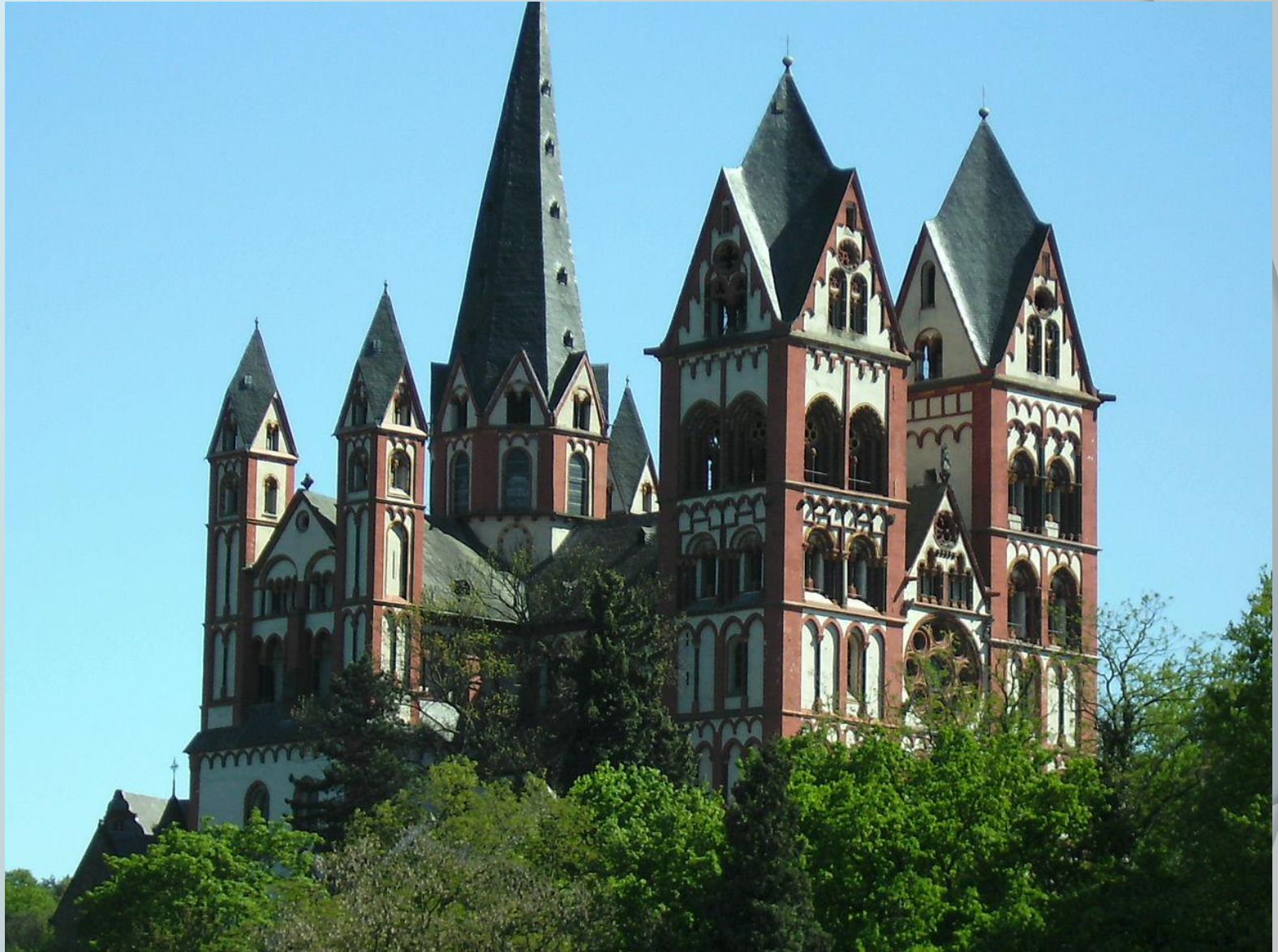
Либмургский собор, Германия