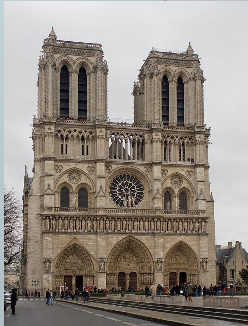
Собор Парижской Богоматери

Слово происходит от итал. gotico — непривычный, варварский — и сначала использовалось в качестве бранного. Впервые понятие в современном смысле применил Джорджо Вазари для того, чтобы отделить эпоху Ренессанса от Средневековья. Готика завершила развитие европейского средневекового искусства, возникнув на основе достижений романской культуры, а в эпоху Возрождения искусство Средневековья считалось «варварским». Готическое искусство было культовым по назначению и религиозным по тематике. Оно обращалось к высшим божественным силам, вечности, христианскому мировоззрению.