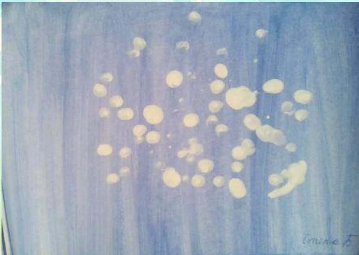
«Выпал первый снег»