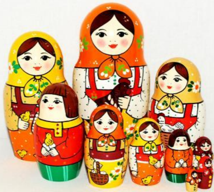
Матрешки «Деревенская семья»