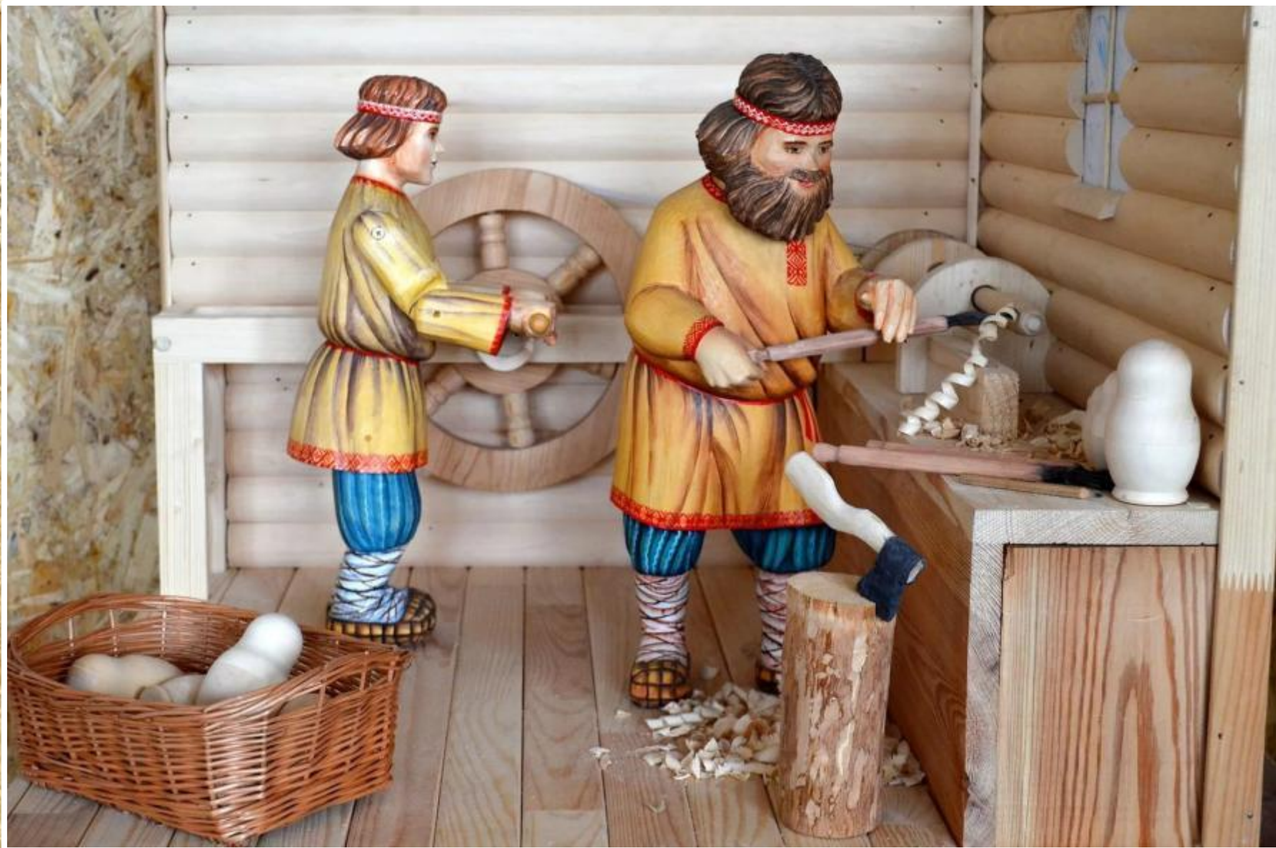
Механическая игрушка «Матрешечники»