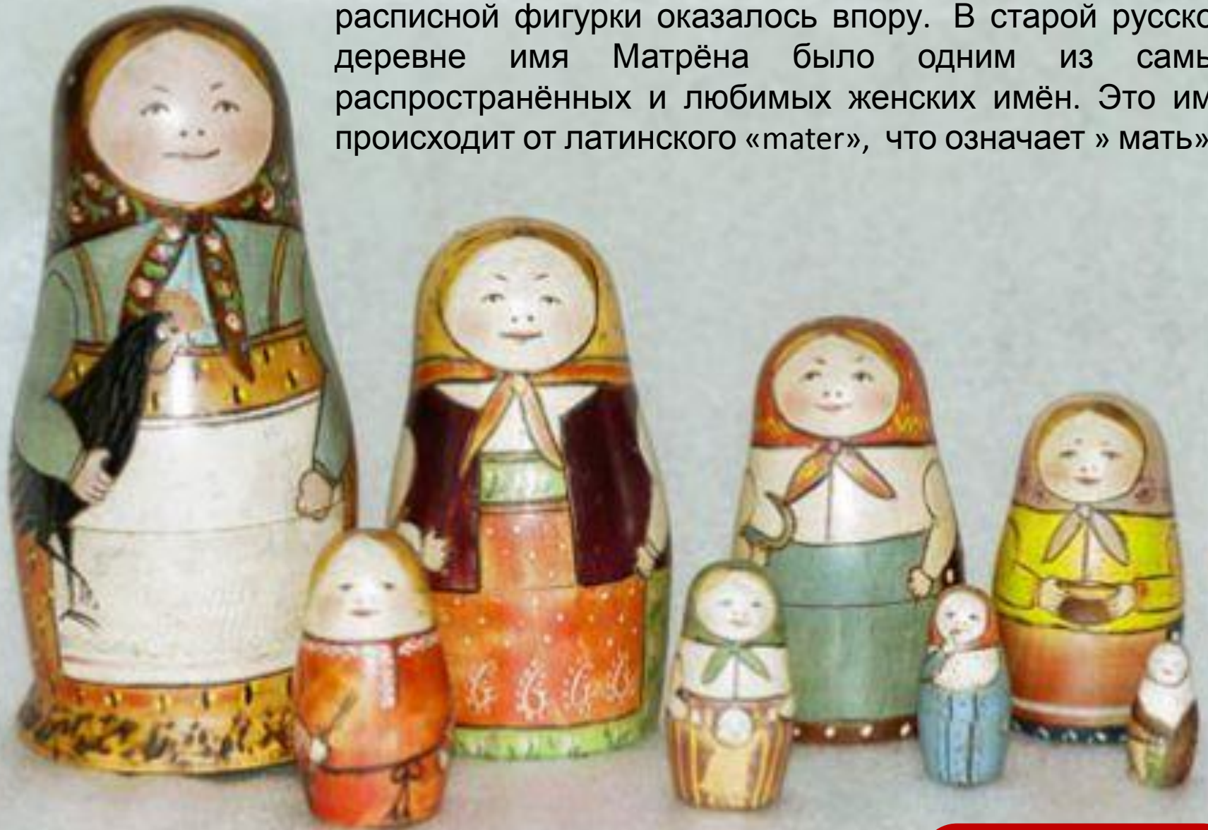
Первая русская матрешка

Название «матрёшка» для деревянной разъемной расписной фигурки оказалось впору. В старой русской деревне имя Матрёна было одним из самых распространённых и любимых женских имён. Это имя происходит от латинского «mater», что означает » мать».