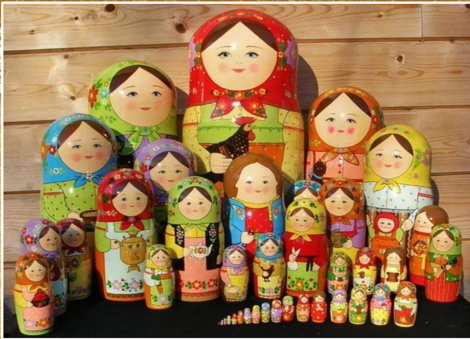
Матрешки «Деревенская семья»