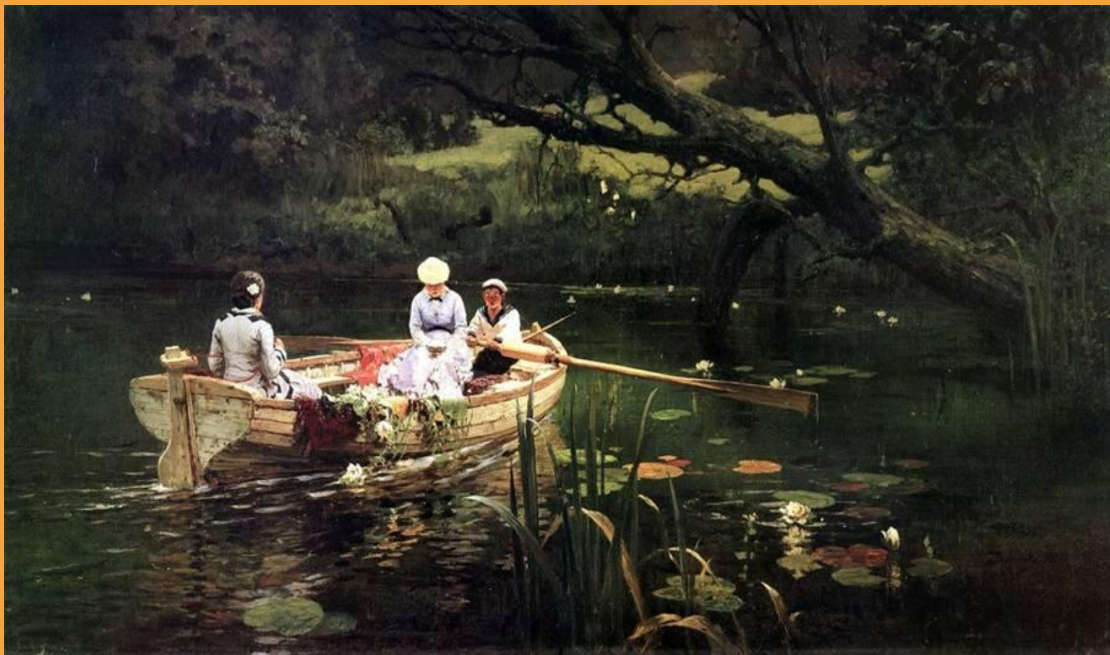
В Поленов. На лодке.