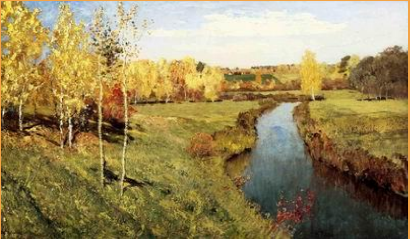
И. Левитан. Золотая осень