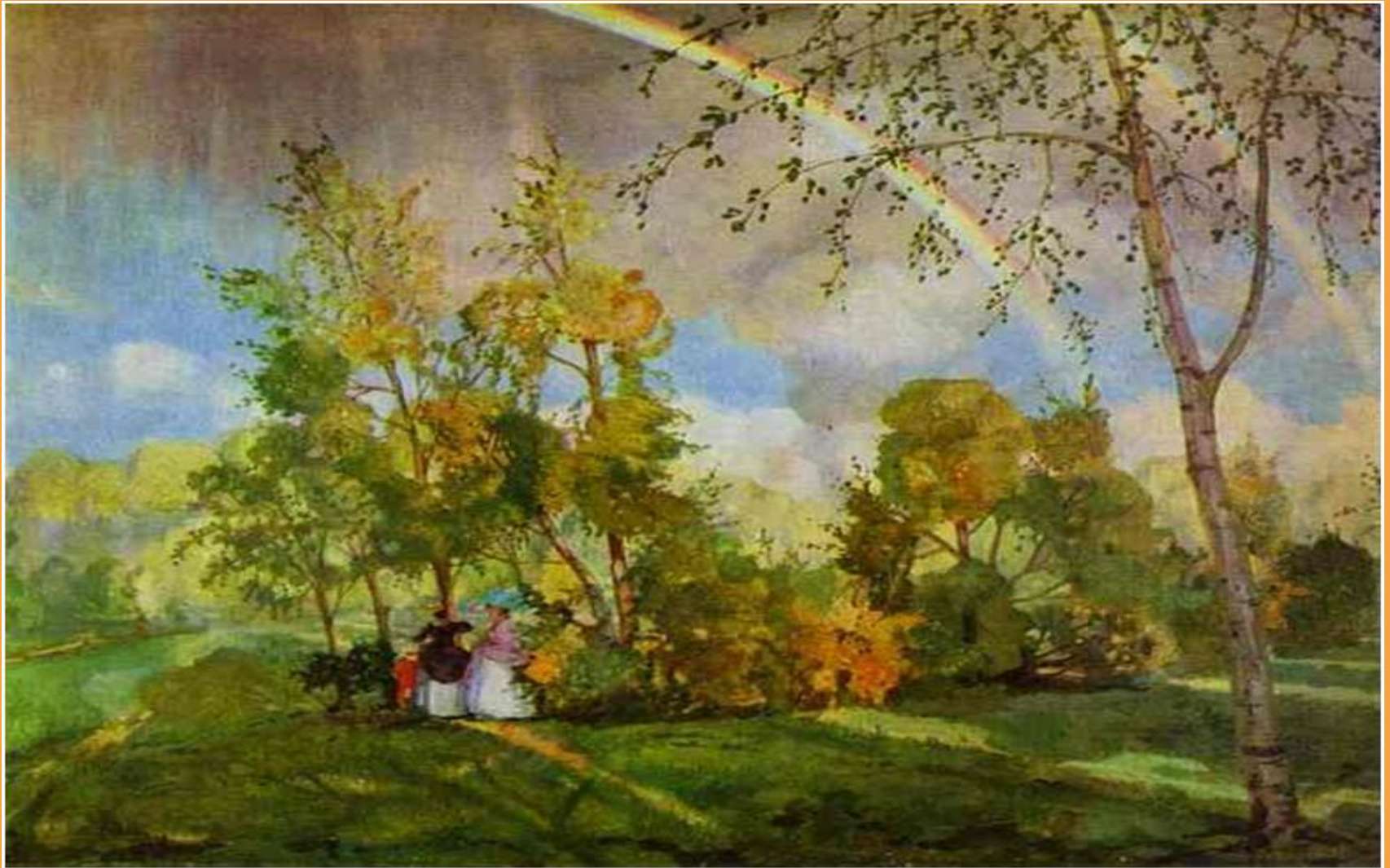
К. Сомов Пейзаж с радугой