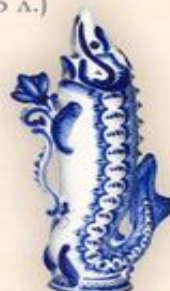
Штоф "Осетр" (1,0 л.)