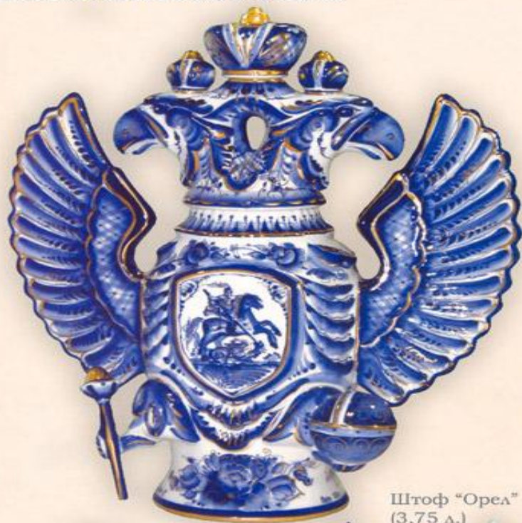
Штоф "Орел" (3,75 л.)