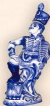
Штоф "Гусар" (1,0 л.)