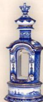
Штоф "Колокольня", (1,2 л.)