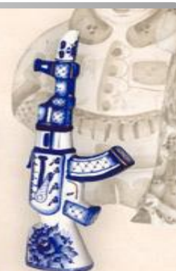
Штоф "Автомат" (0,5 л.)