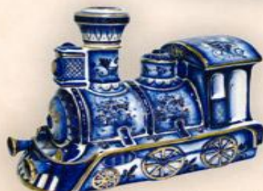
Штоф "Паровоз" (1,0 л.)