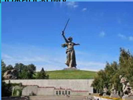
Мамаев курган в Волгограде