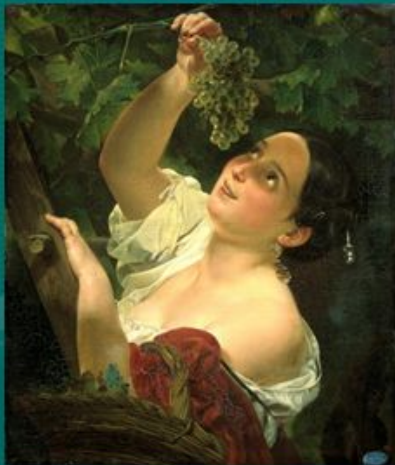
БРЮЛЛОВ К.И. «Итальянский полдень»

А также умением видеть красоту и научить нас восторгаться ею