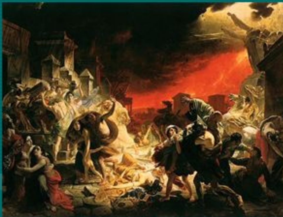
БРЮЛЛОВ Карл «Последний день Помпеи»

отношением к самым разным событиям и вызвать у нас сострадание к чужому горю