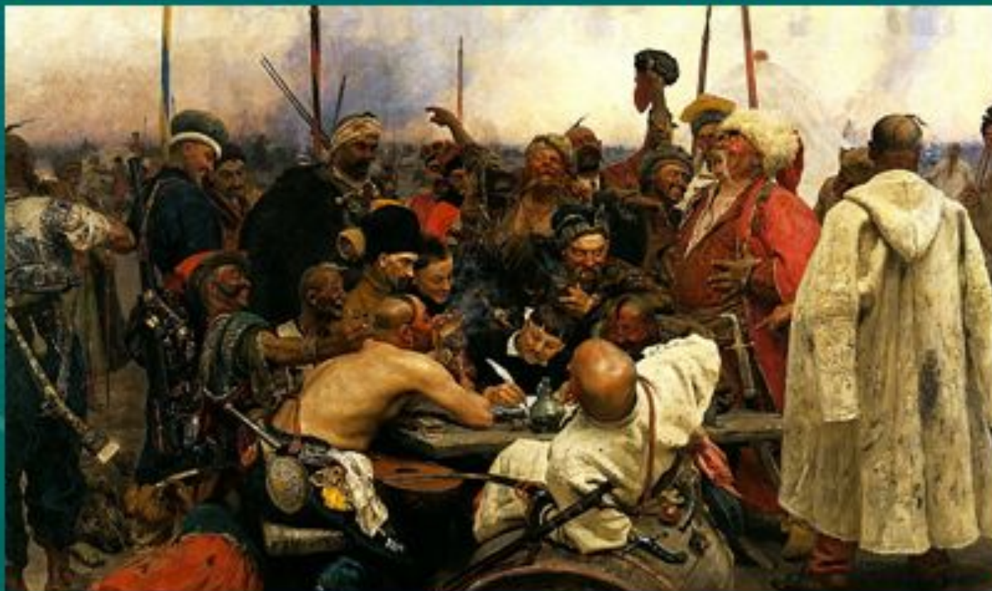
РЕПИН И.Е. « Запорожцы»

сопоставить страшное и веселое – трагическое и комическое, чтобы мы осознали.....?