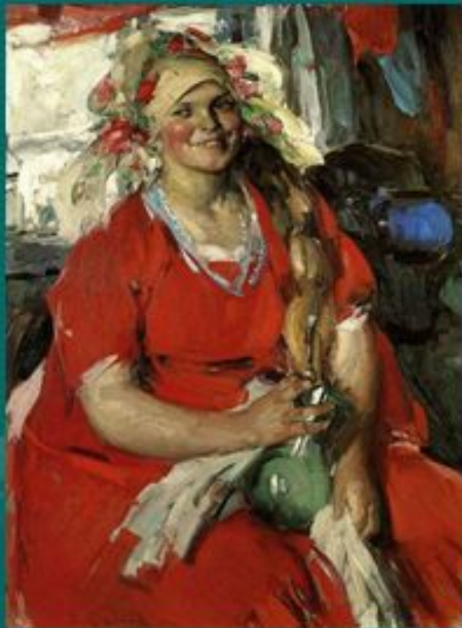
«Женщина в красном» Архипов А. Е.

умением замечать радость вокруг себя и радоваться самому простому