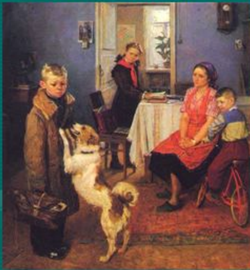
Решетников Ф.П. «Опять двойка»

отношением к проявлениям окружающей нас жизни и вызвать у нас чувство ....?