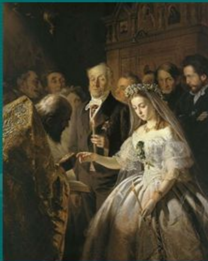
«Неравный брак» Пукирев В.В.

своей грустью, печалью и вызвать у нас чувство ..... ?