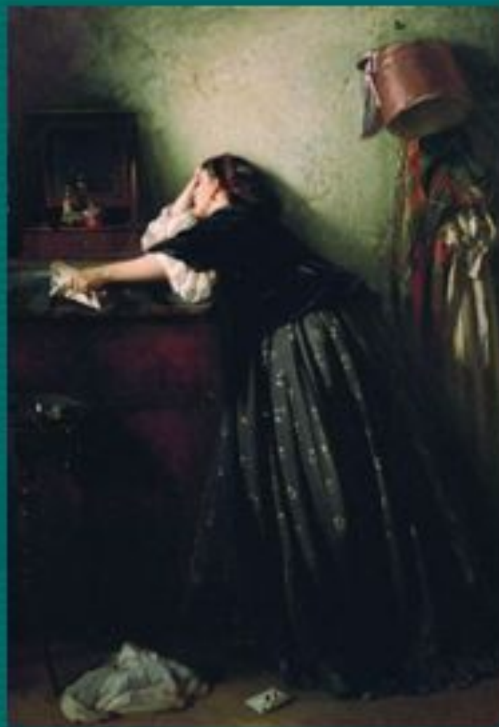
«Вдовушка» Маковский К.Е.

отношением к чужому горю и страданию, чтобы научить нас...?