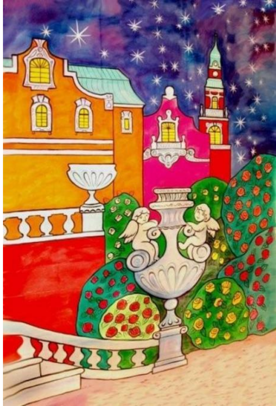
Задник спектакля «Золушка»