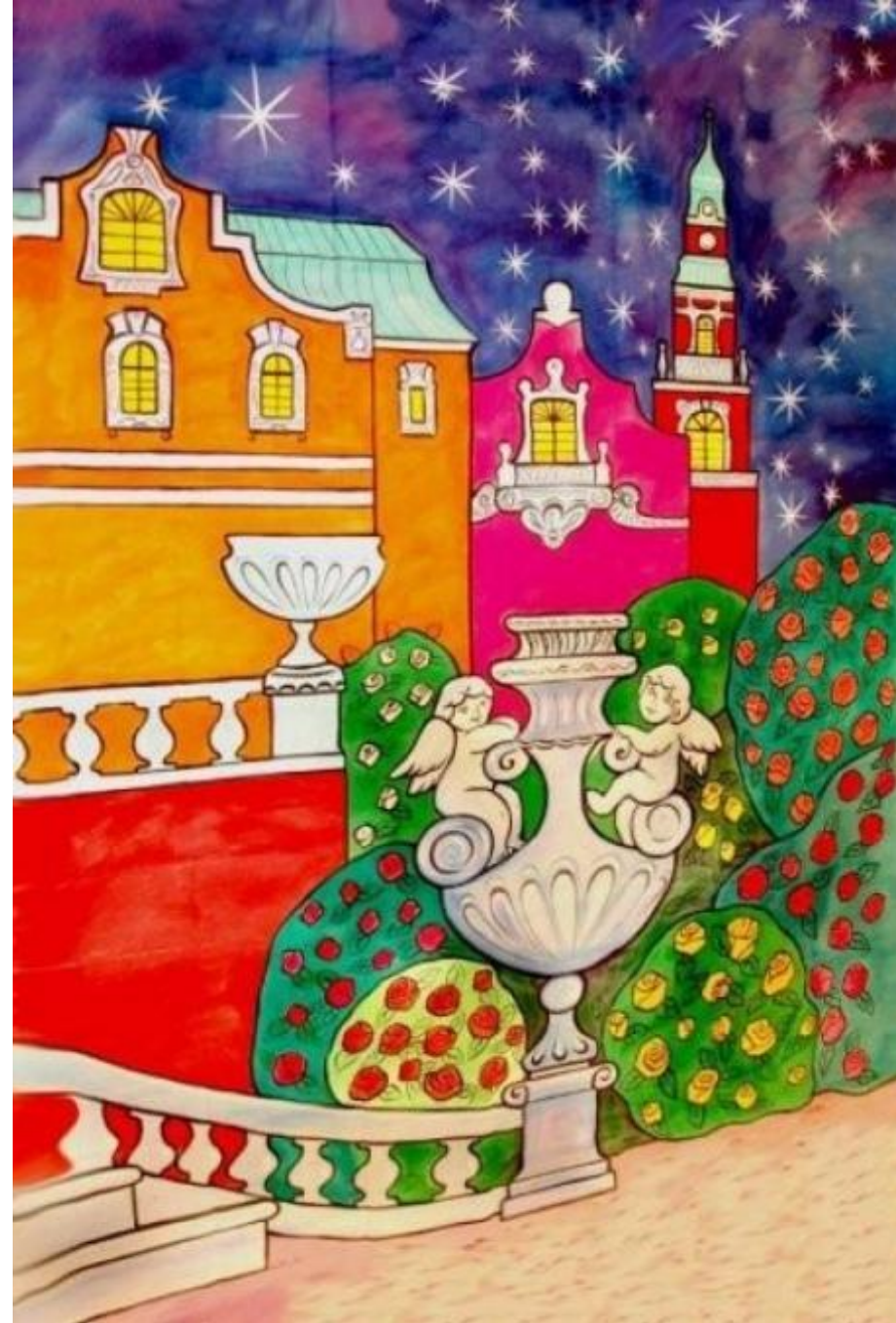
Задник спектакля «Золушка»