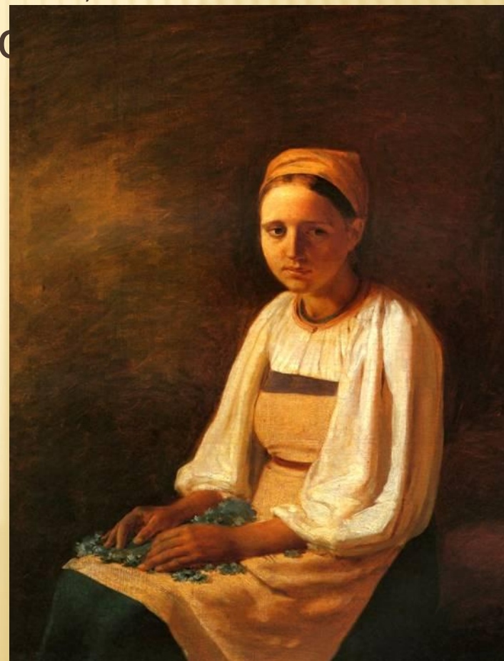
«КРЕСТЬЯНКА С ВАСИЛЬКАМИ» (1839)