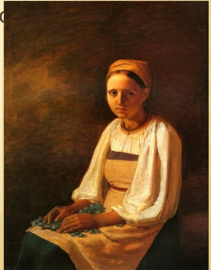
«КРЕСТЬЯНКА С ВАСИЛЬКАМИ» (1839)