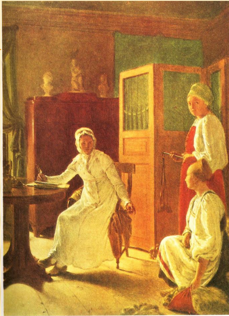
□ Венецианов А.Г. «Утро помещицы» (1823)