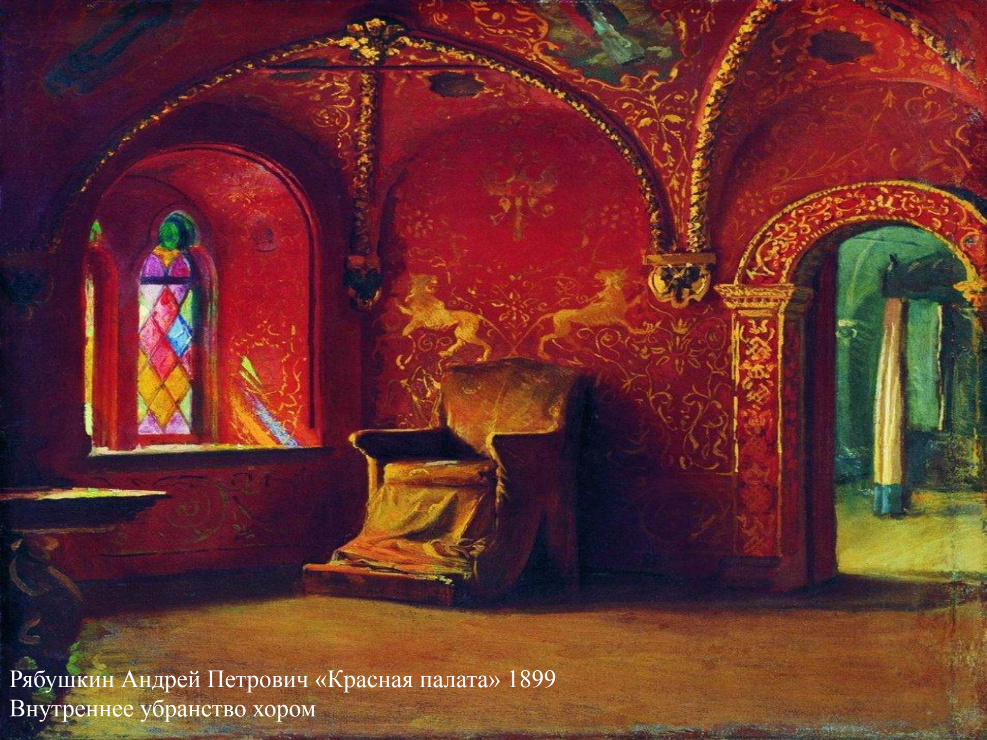
Рябушкин Андрей Петрович «Красная палата» 1899 Внутреннее убранство хора