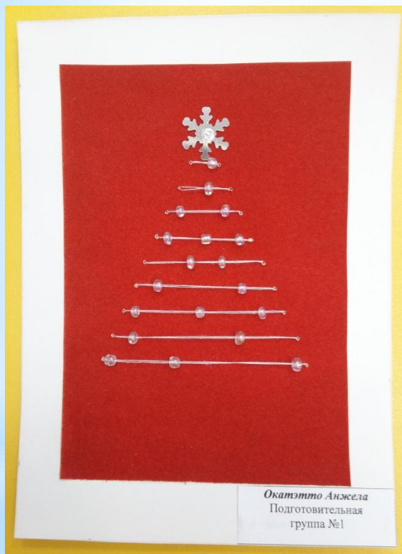
Окантто Анжела Подготовительная группа №1