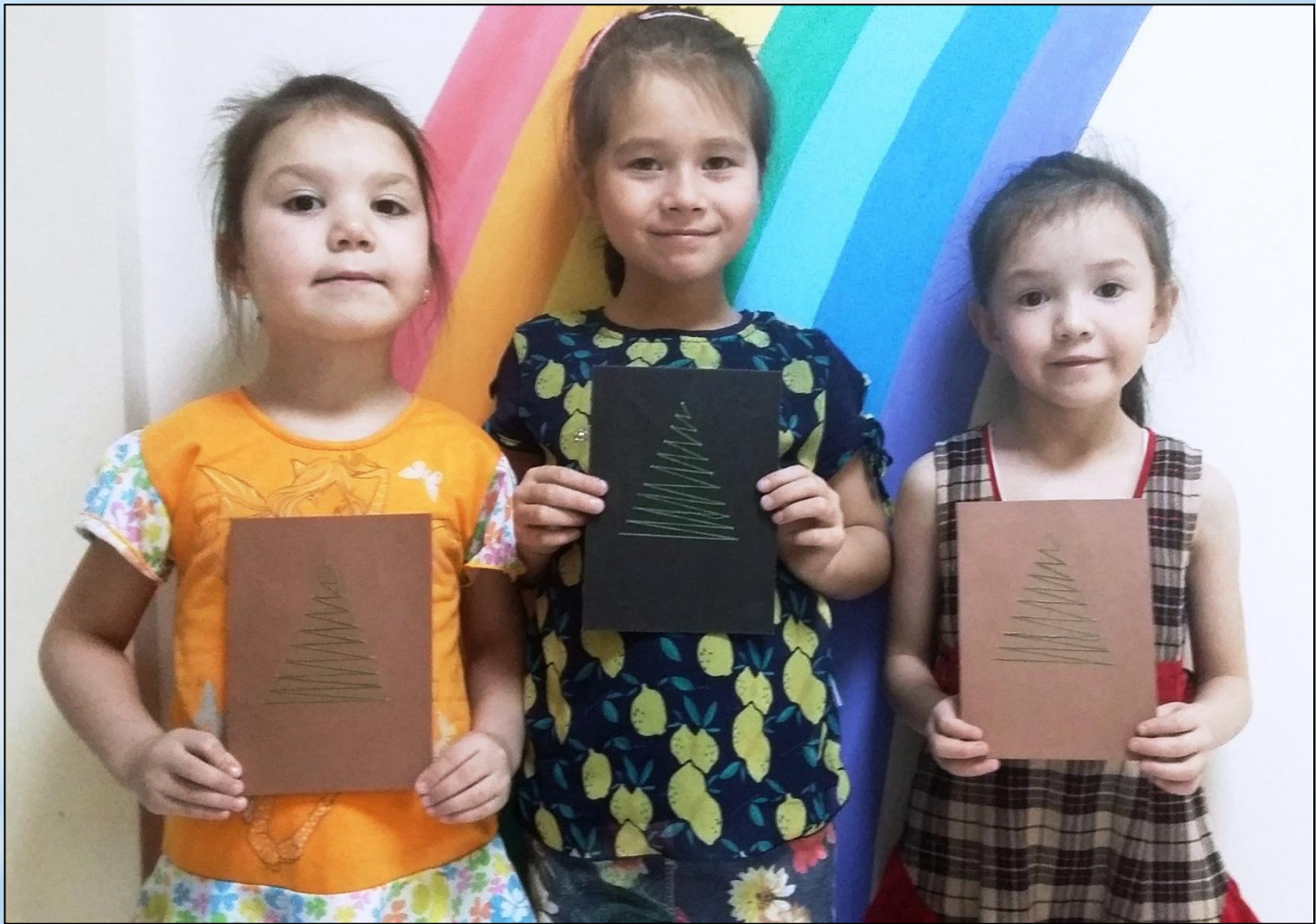
Наши первые стежки