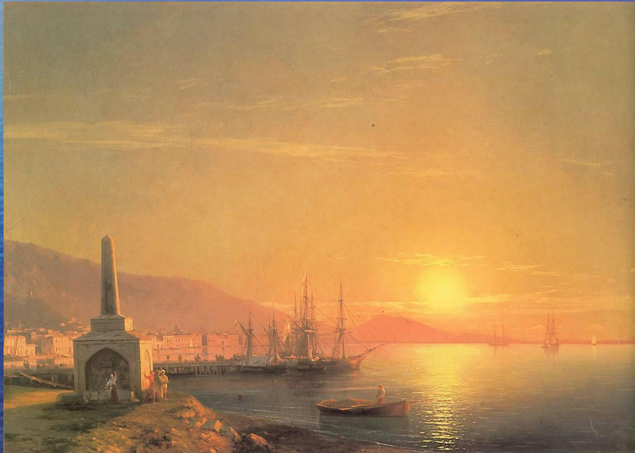
«Закат солнца в Феодосии»

Отзывы песни рыбаков несла. (М.Ю. Лермонтов)