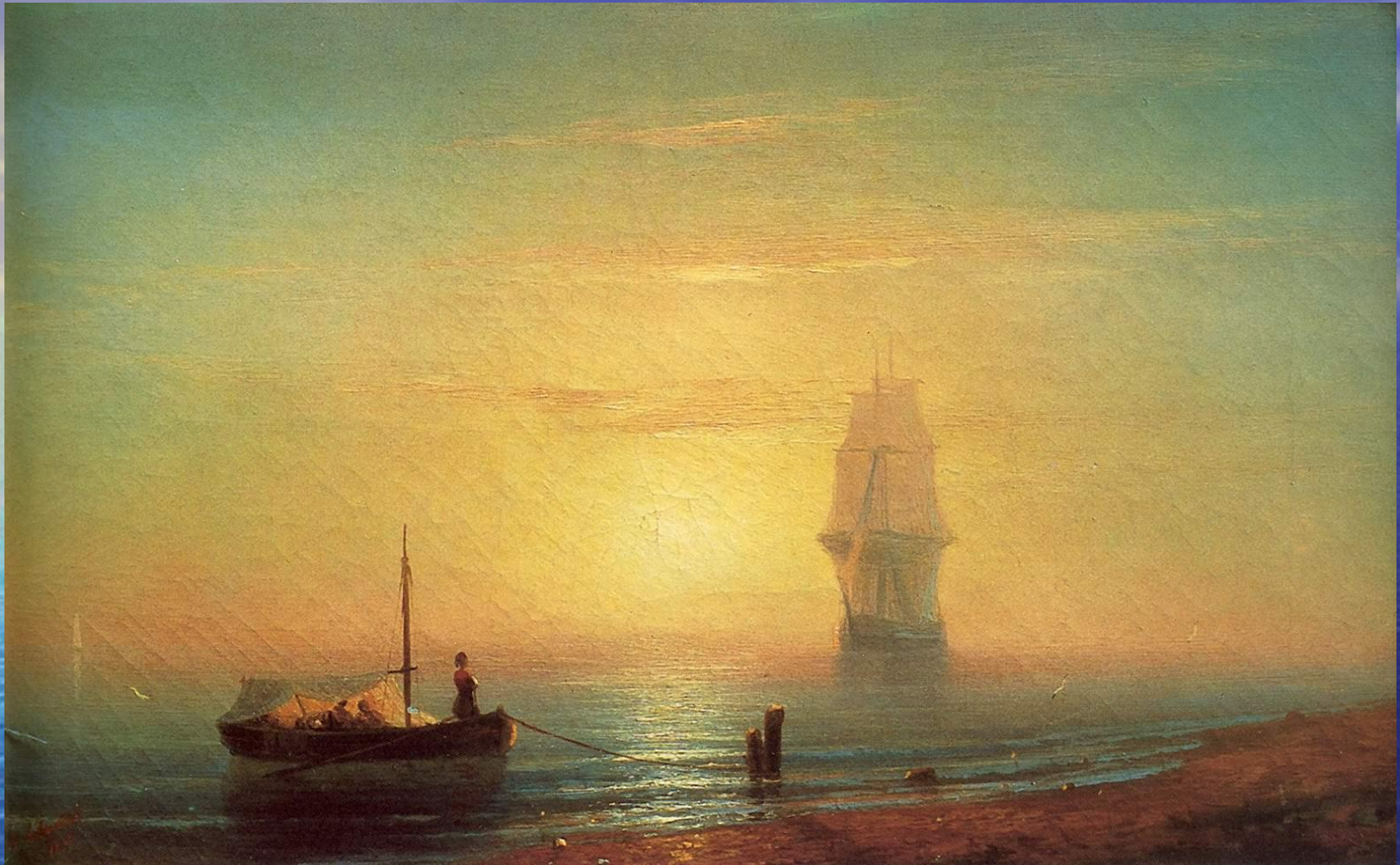
«Рыбаки у Неаполитанского залива»