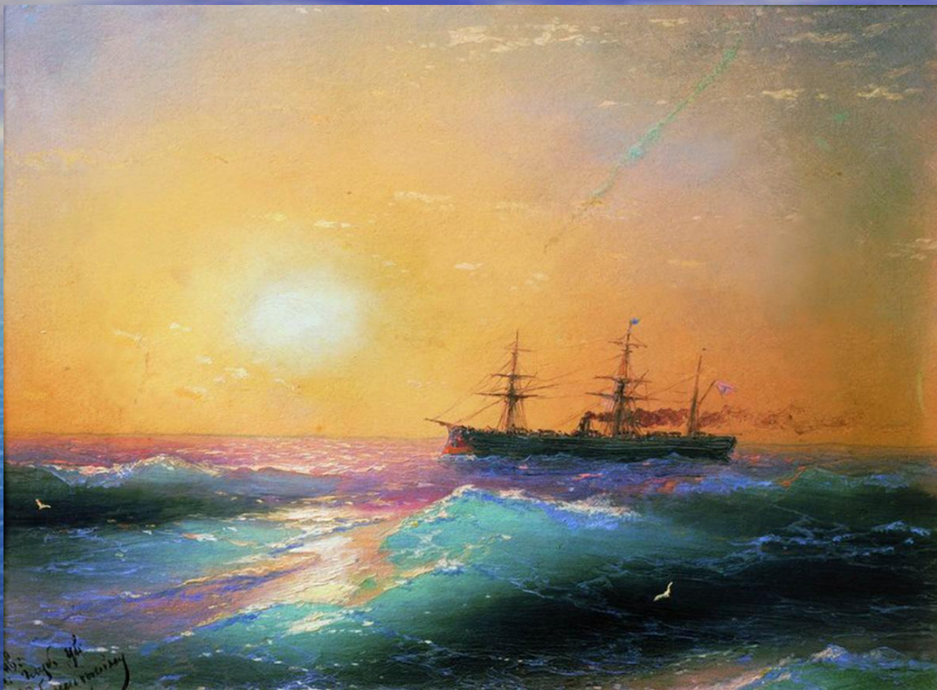
«Закат на море»