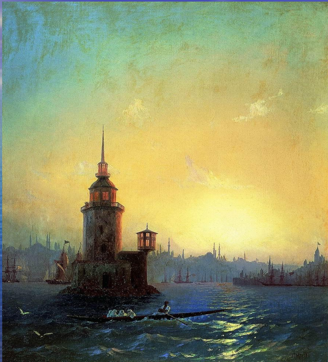
«Вид Леандровой башни со стороны залива»