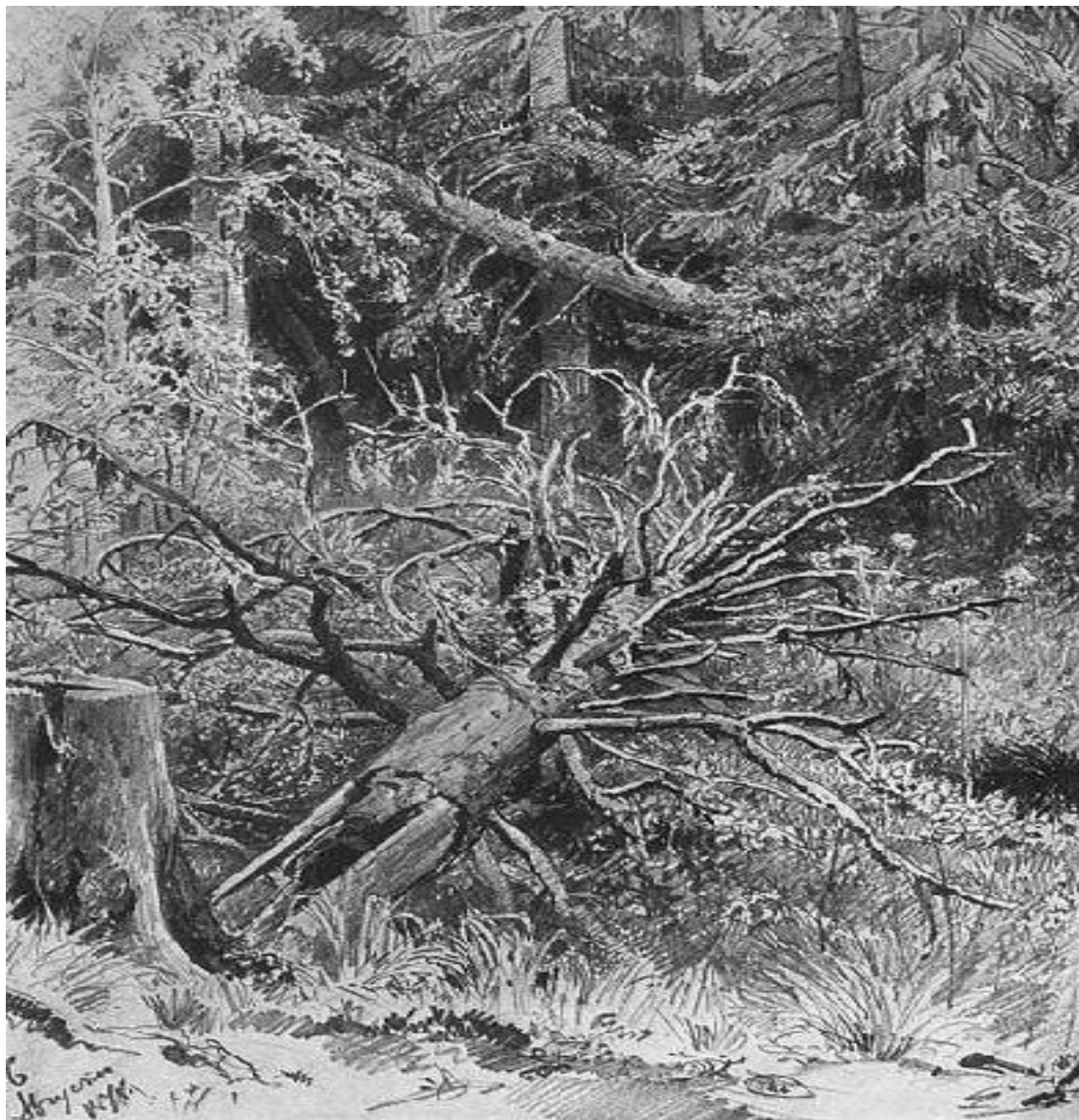
И. Шишкин. Упавшее дерево. Карандаш