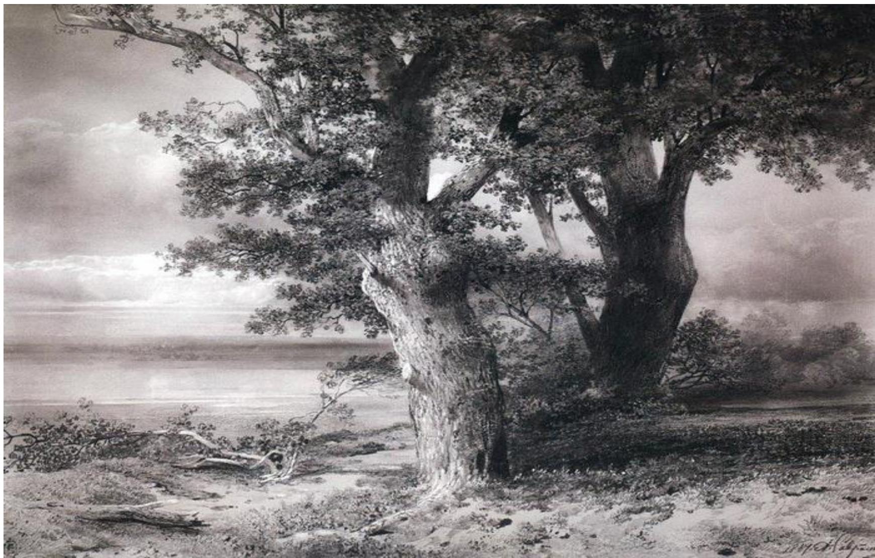
А. Саврасов. Дубы на берегу.