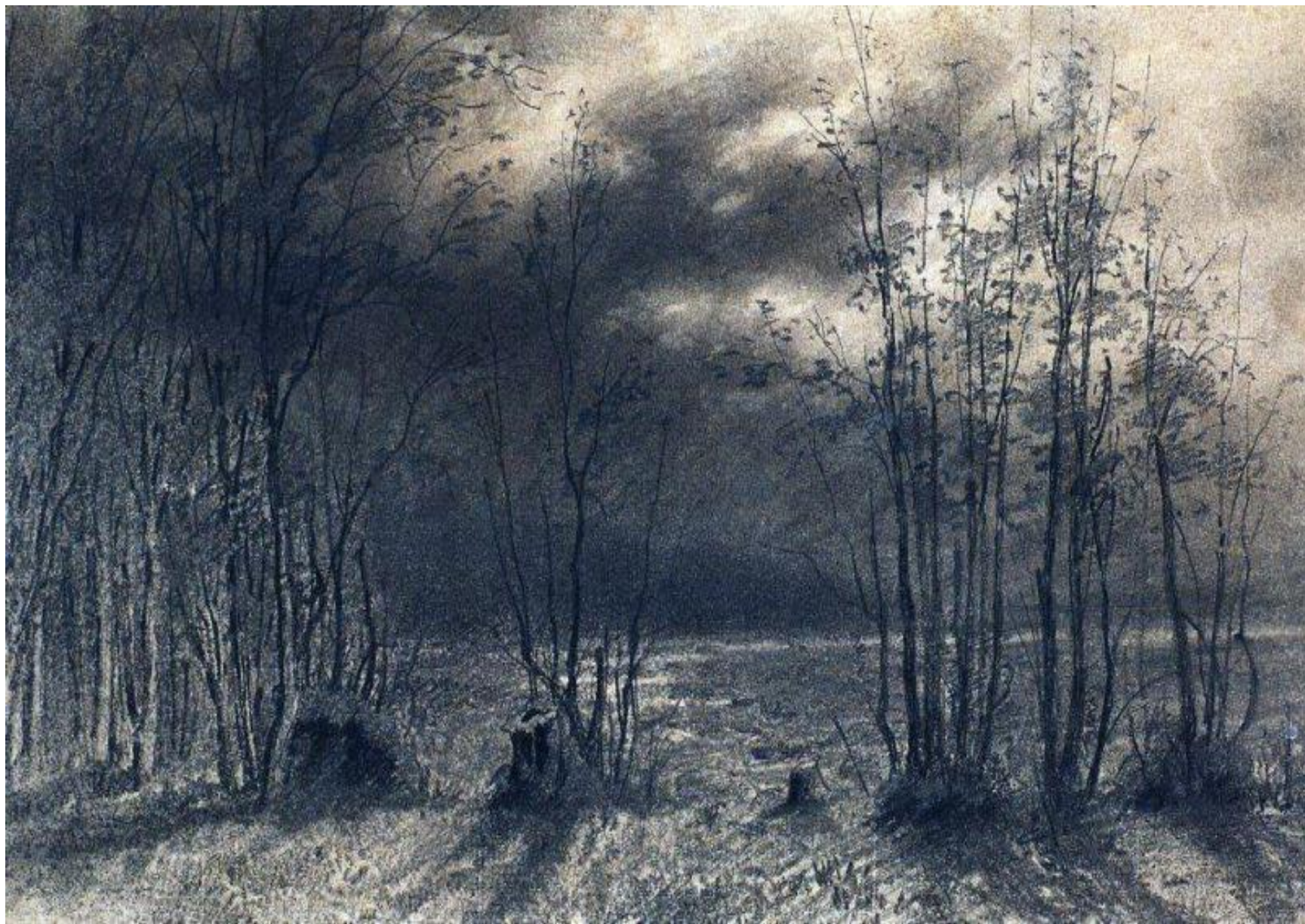
А. Саврасов. Осенняя