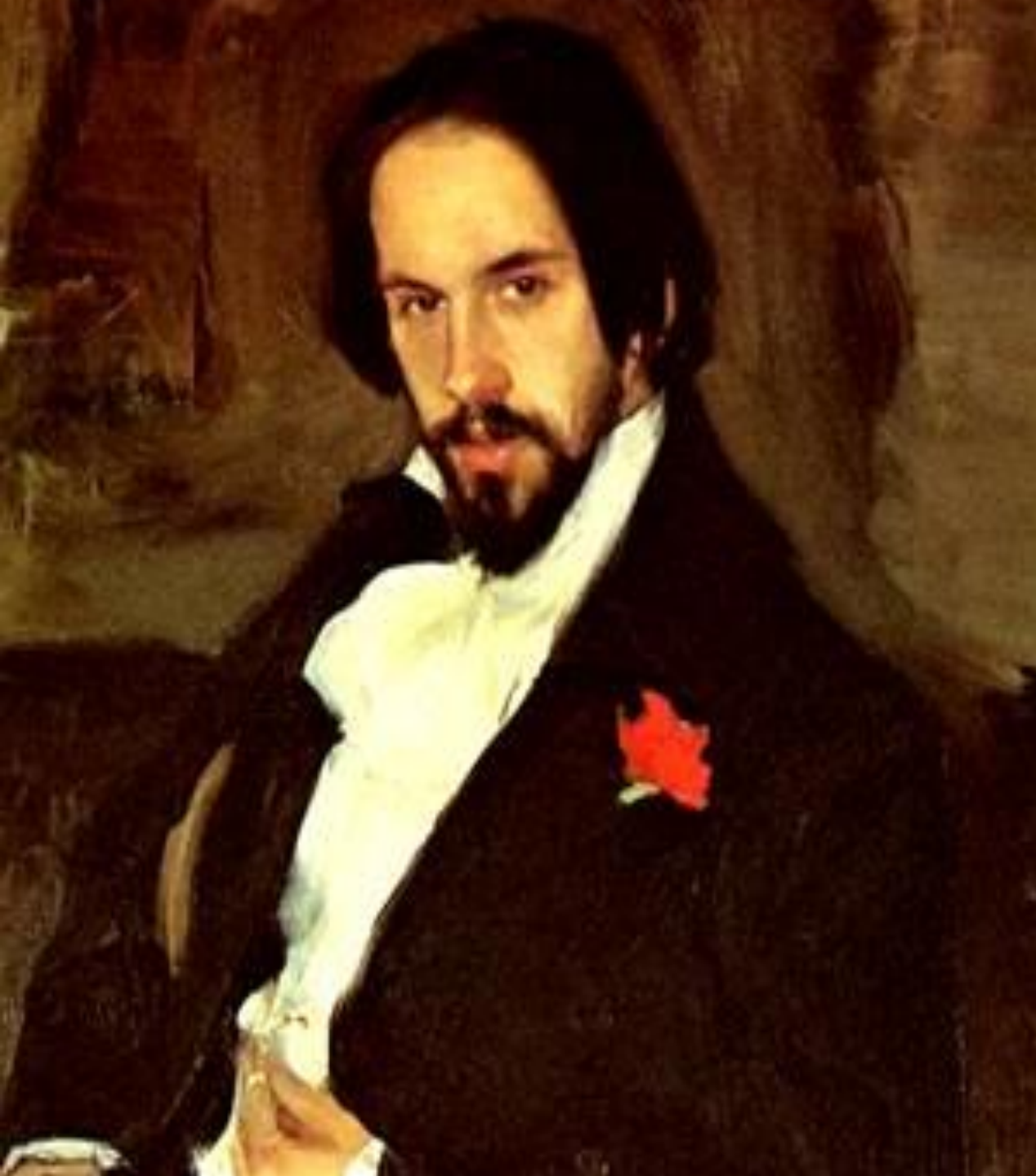
Иван Яковлевич Билибин