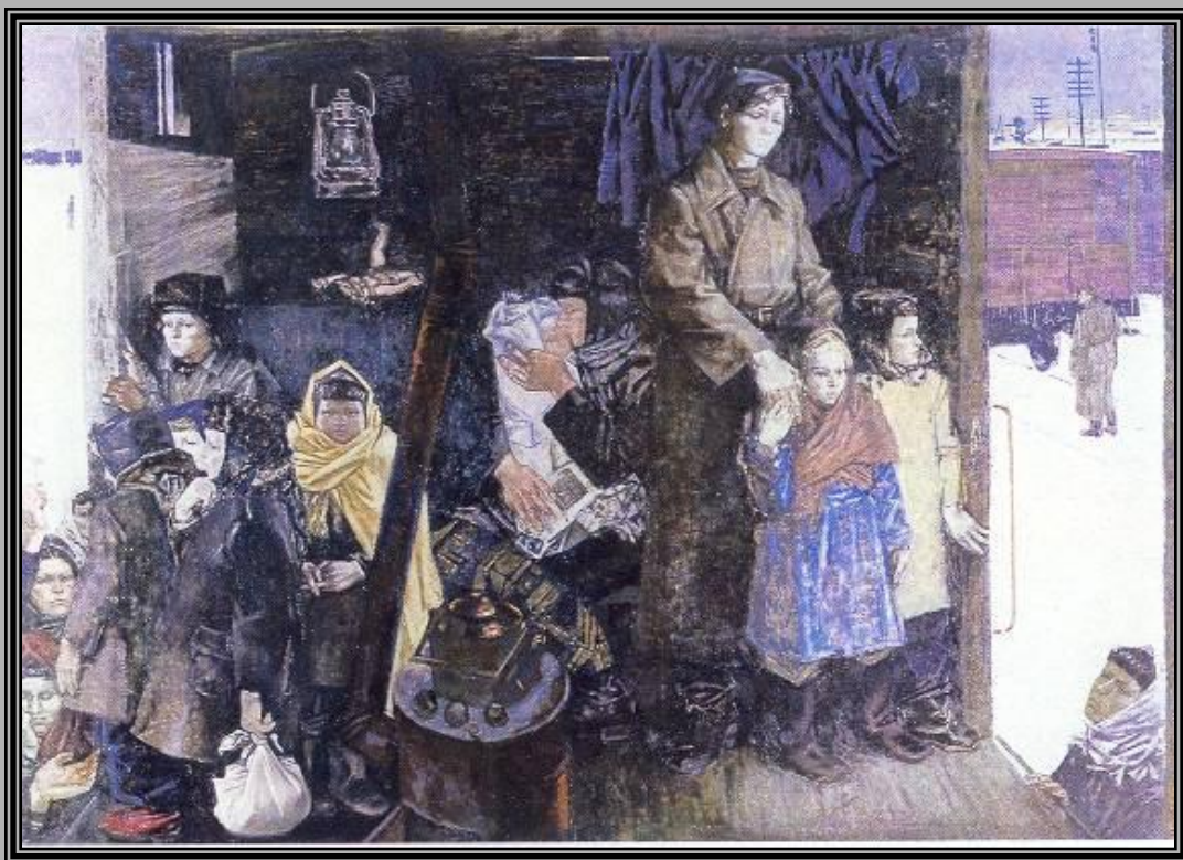
Эвакуация. М. Жерносек. 1988 г.