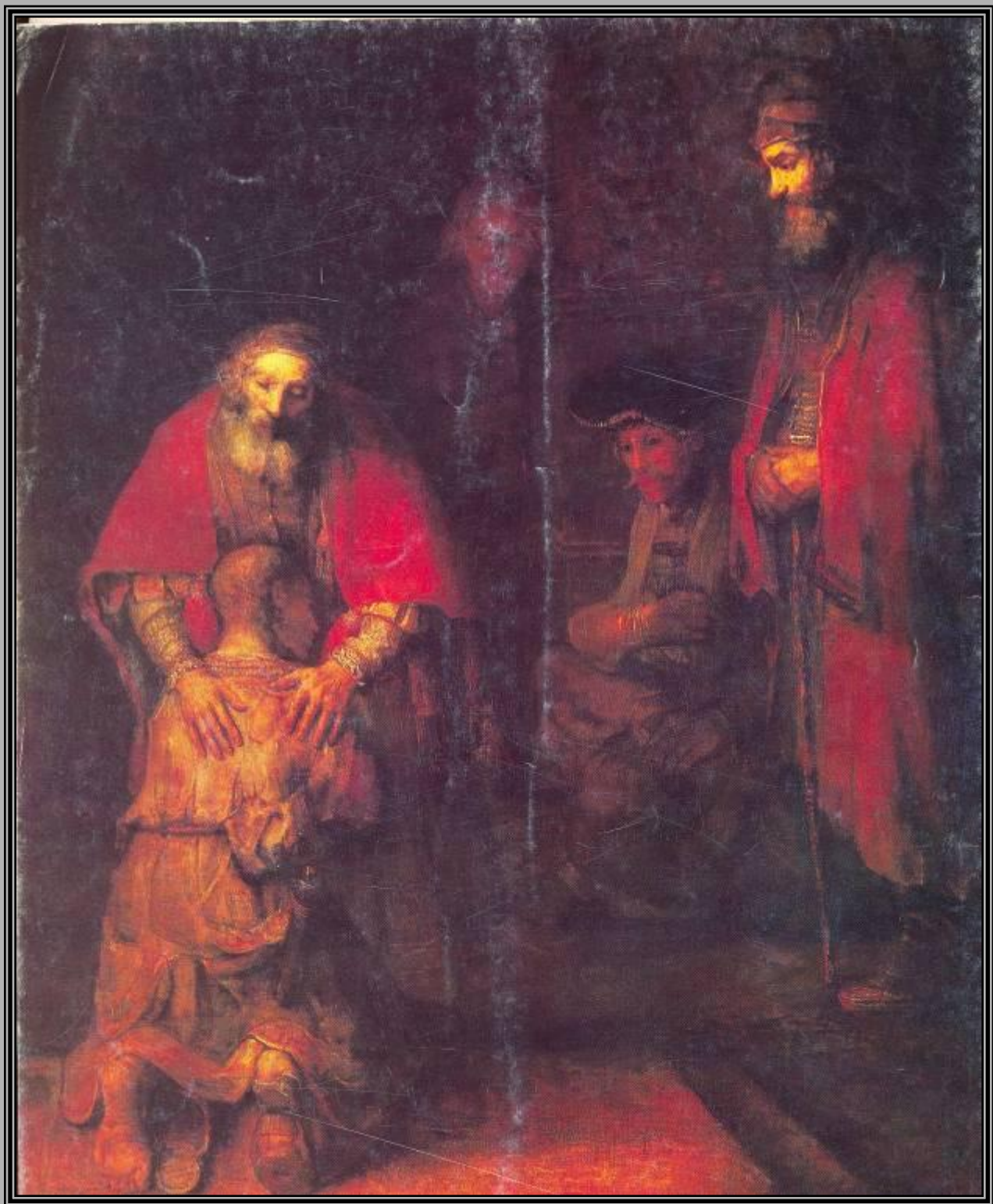
Возвращение блудного сына. Рембрандт.

С древнейших времен в искусстве присутствует тема страдания. А рядом с ней – тема великой любви и веры в добро.