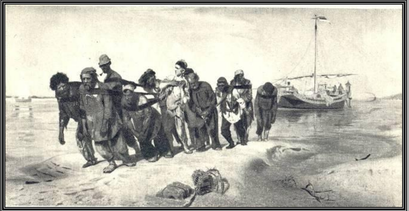
«Бурлаки на волге», 1873 г.

Тему социальной трагедии в своем творчестве раскрывает и Илья Ефимович Репин