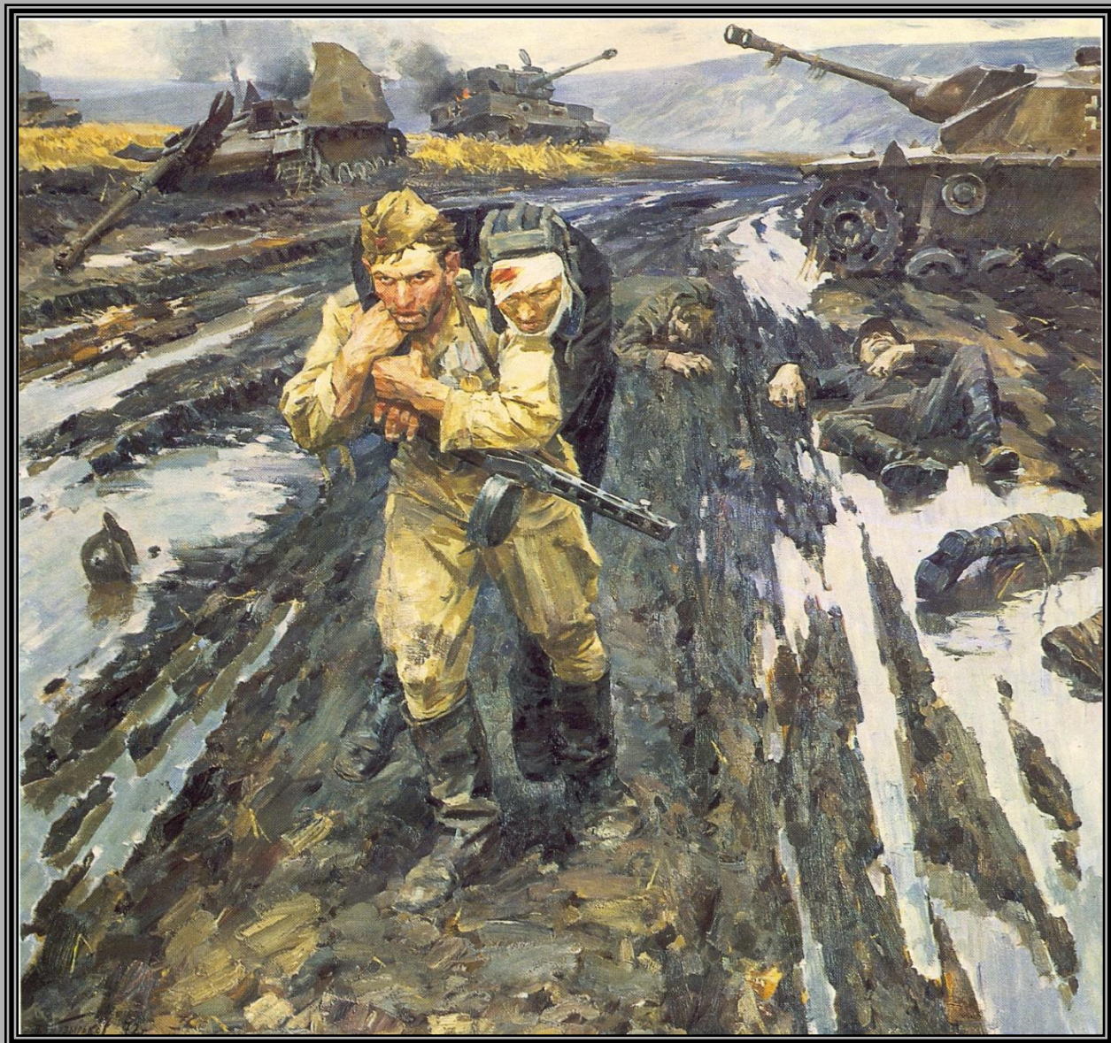
Солдаты (Побратимы). В. Пузырьков. 1972 г.

Одна из тем в жизни, которая заставляет людей вздрагивать при одном только слове – «война». Многие художники затрагивают эту тему в своем творчестве. Картины не дают забыть людям об этом страшном горе.