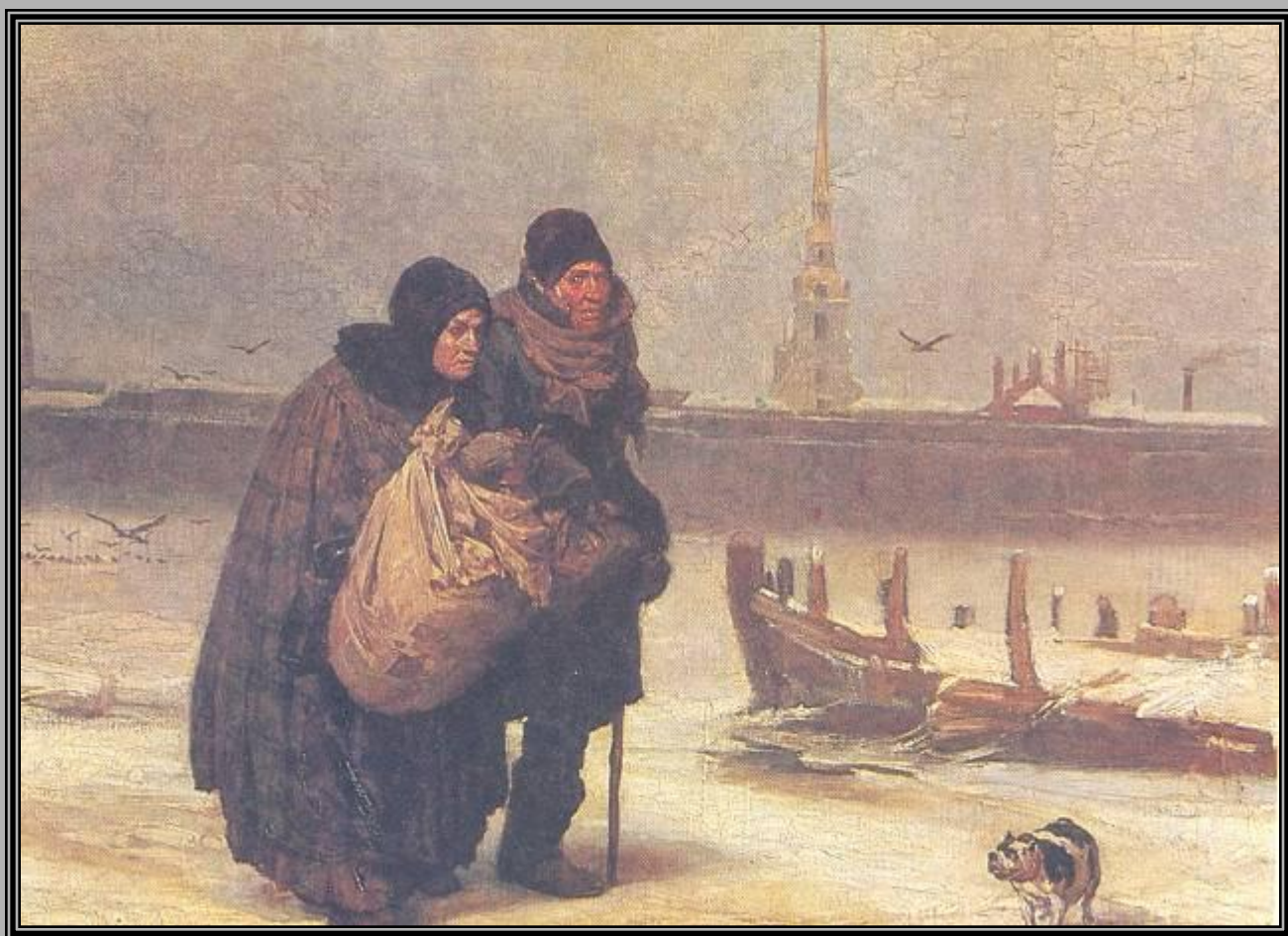
Виктор Васнецов. «С квартиры на квартиру»

Сумрачный петербургский зимний день. Серое небо. Нева замерзла... идут двое людей – старик и старушка. Идут медленно, согнувшись, лица у них грустные, покорные. С ними старая собачонка – верный друг и в горе и в радости.