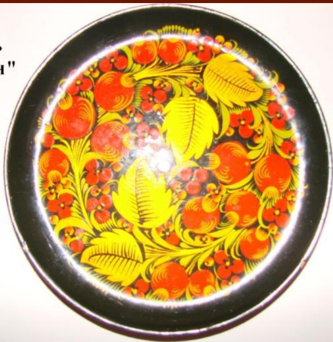
Роспись "под фон"