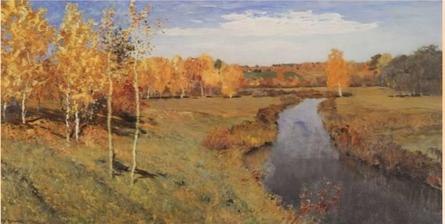
■ «Золотая осень»

(1860-1900), русский живописец крупнейший мастер русского пейзажа конца 19 века