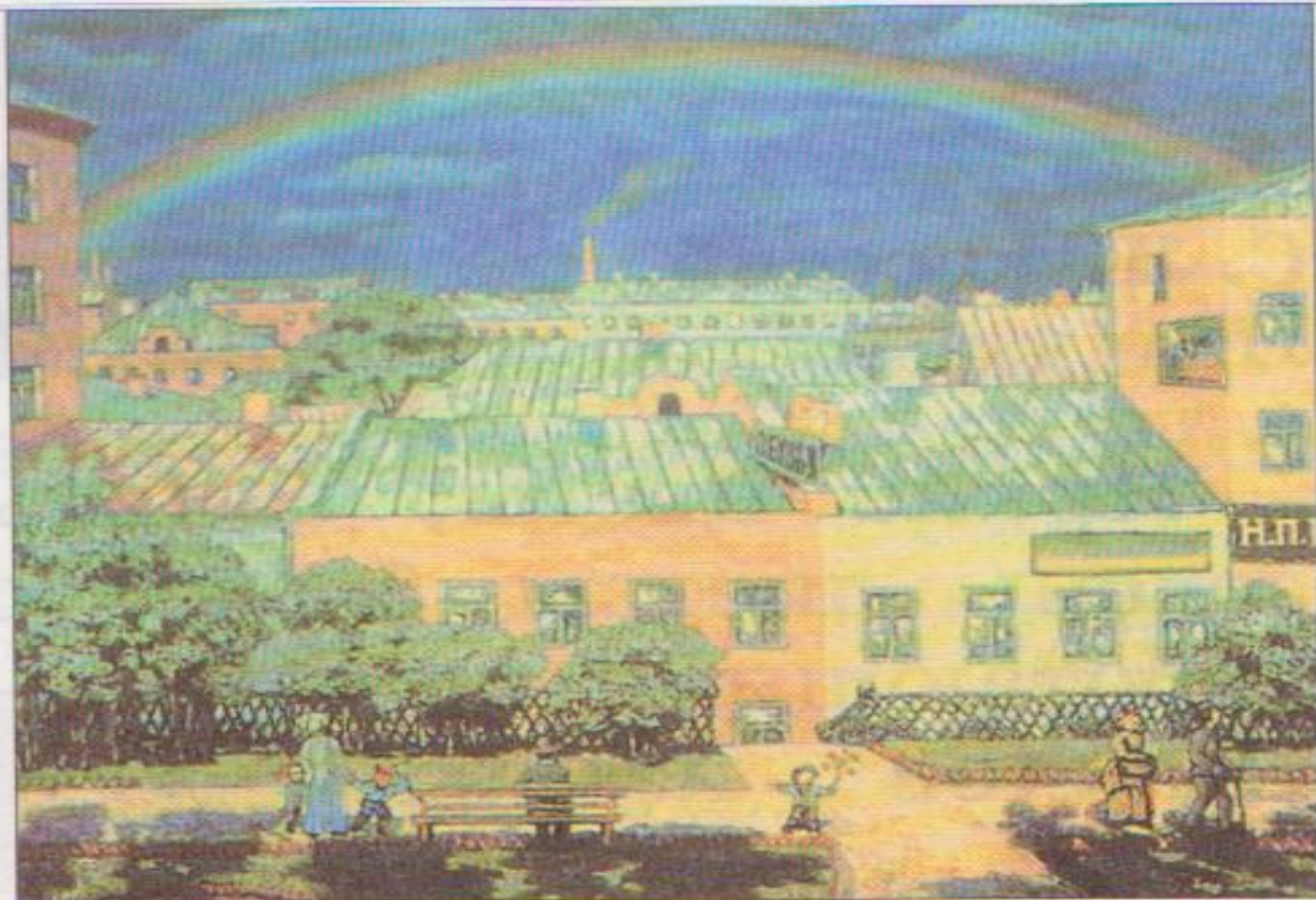
Н. Крымов. Московский пейзаж