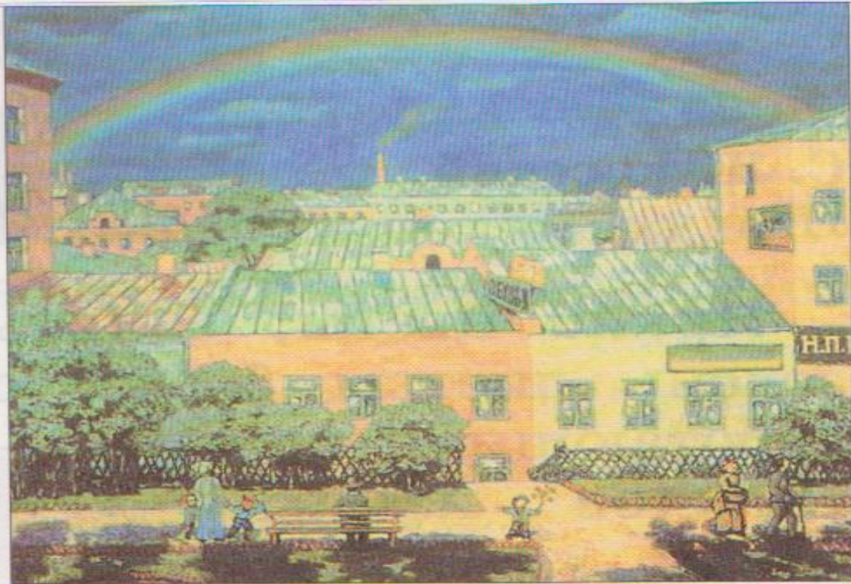
Н. Крымов. Московский пейзаж