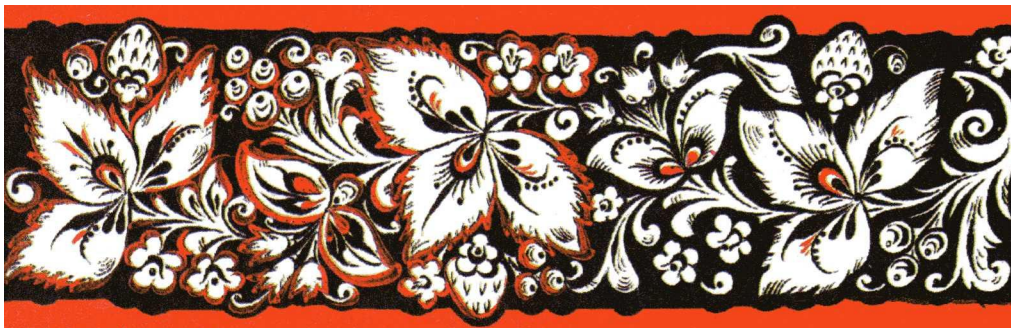
Разновидность фонового письма – « кудрина»