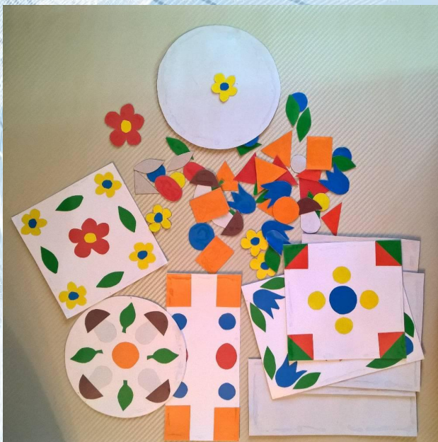
«Составь узор по образцу»