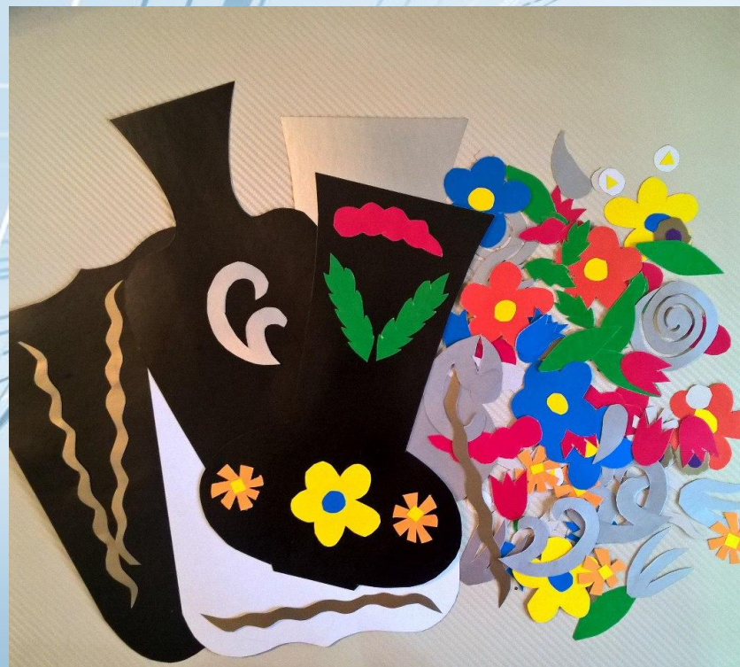
«Орнамент на посуде»

Орнаментальное творчество ставит своей задачей ознакомить учащихся с основными принципами декоративно-прикладного искусства.