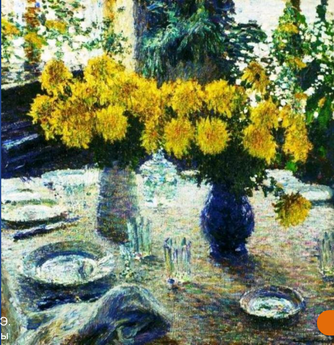
Грабарь И.Э. Хризантемы