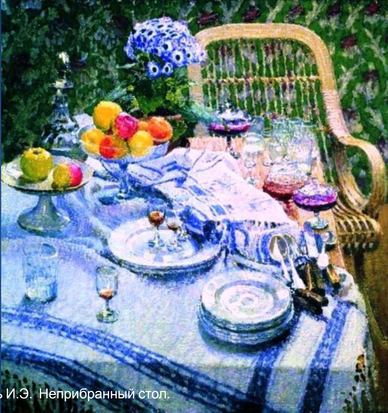
Грабарь И.Э. Неприбранный стол.