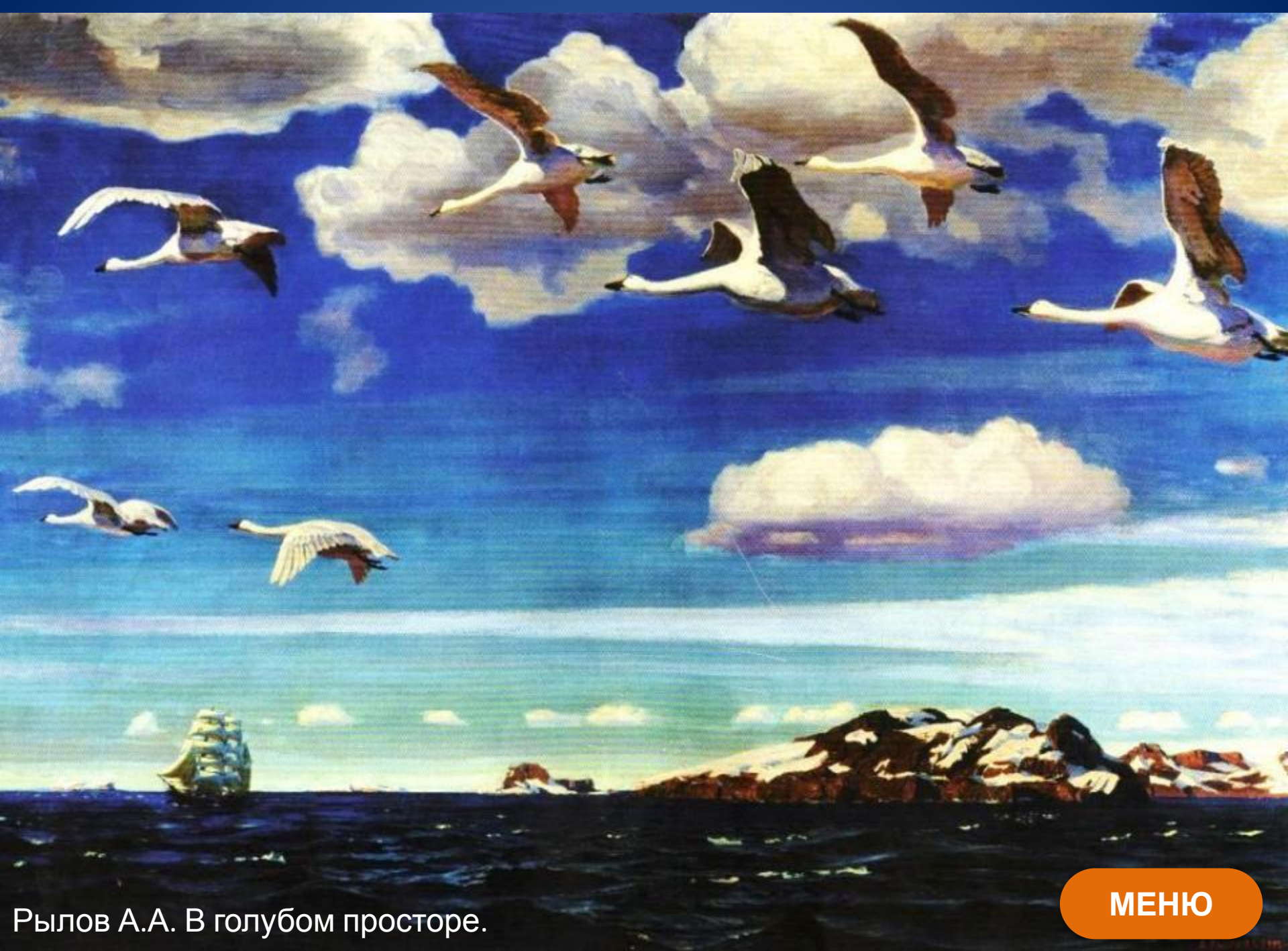
Рылов А.А. В голубом просторе.