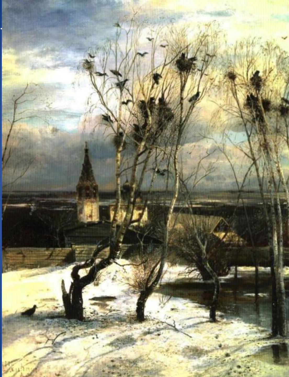
Саврасов А.К. Грачи прилетели.