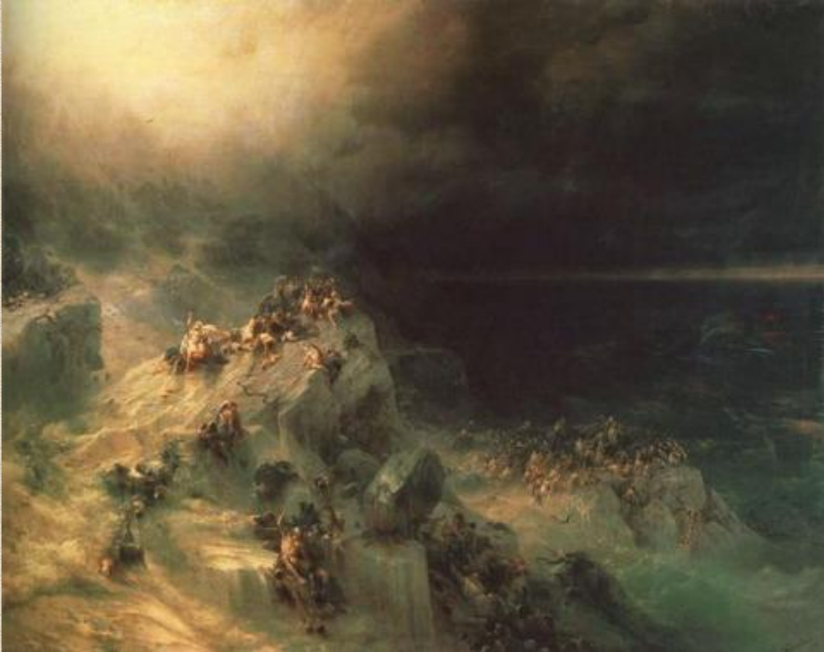
И.К. Айвазовский . Всемирный