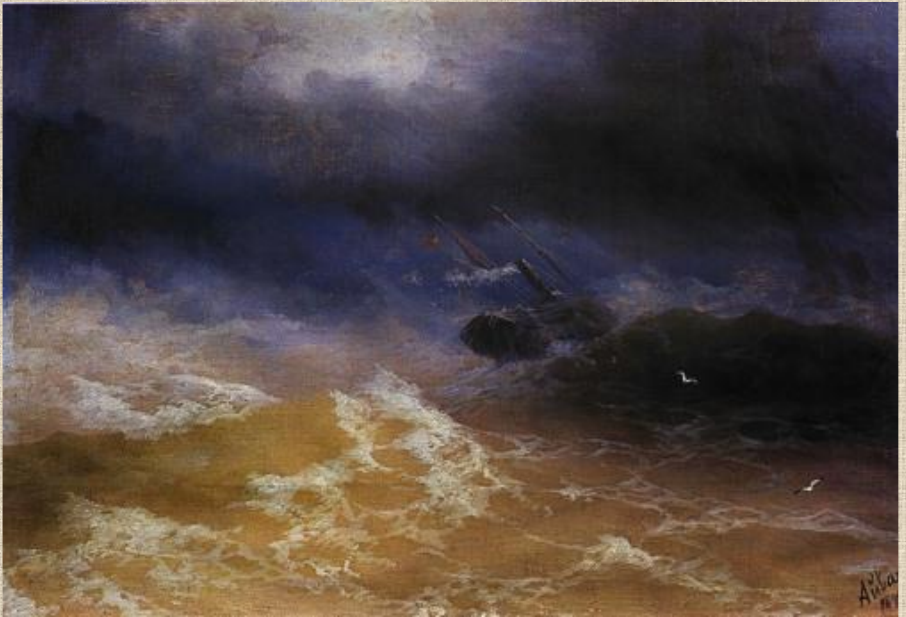
И.К. Айвазовский . Шторм на море.