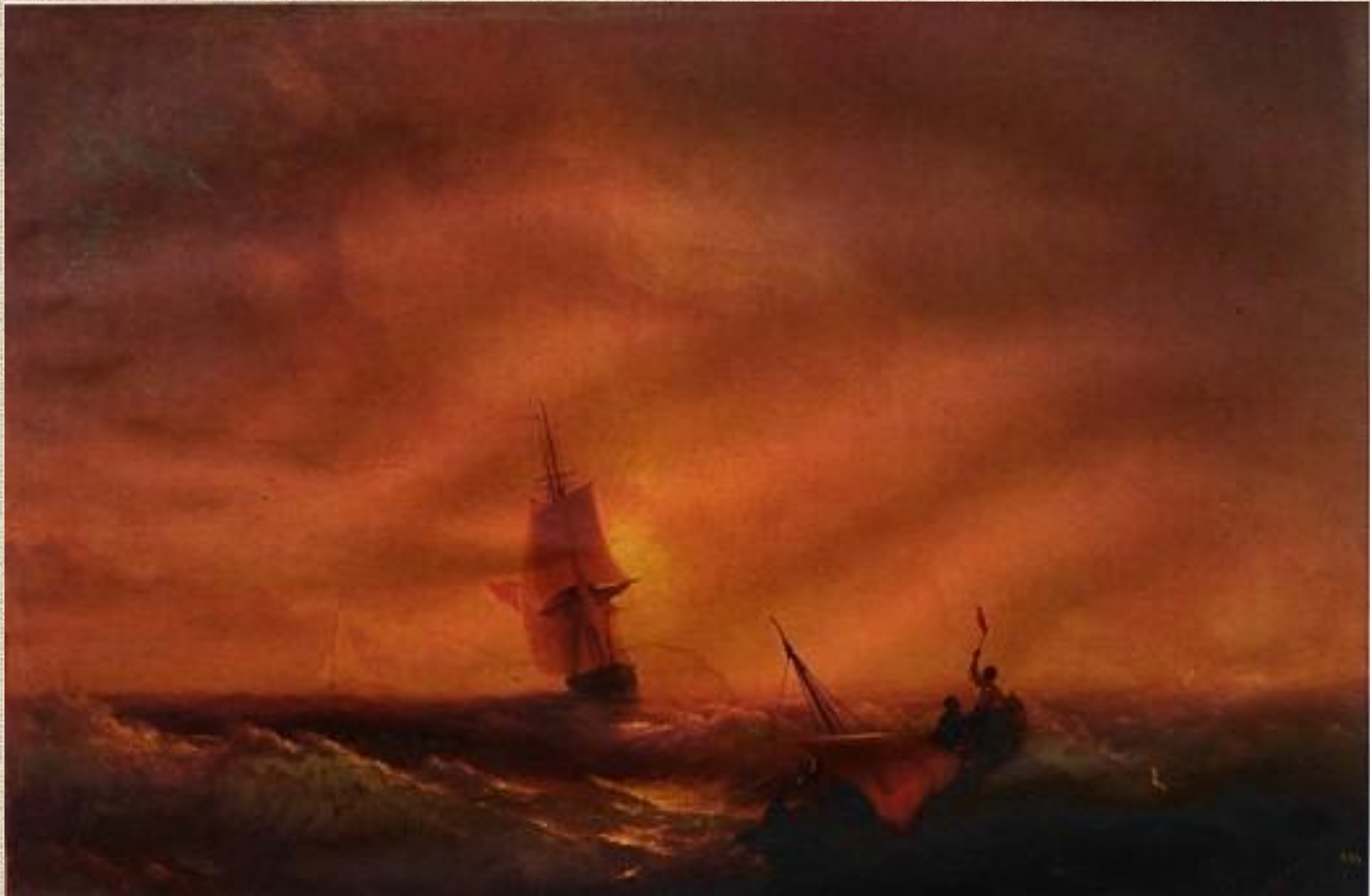
И.К. Айвазовский. Спасённые.