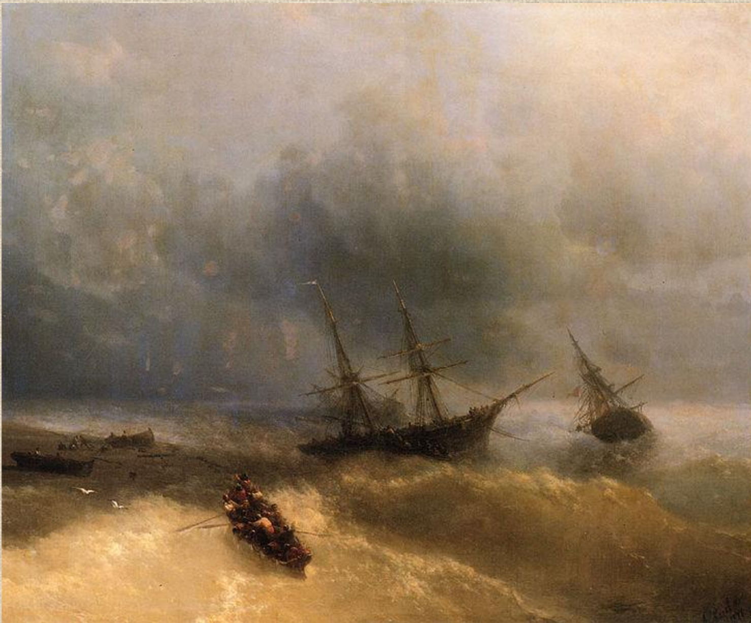
И.К. Айвазовский. Кораблекрушение.