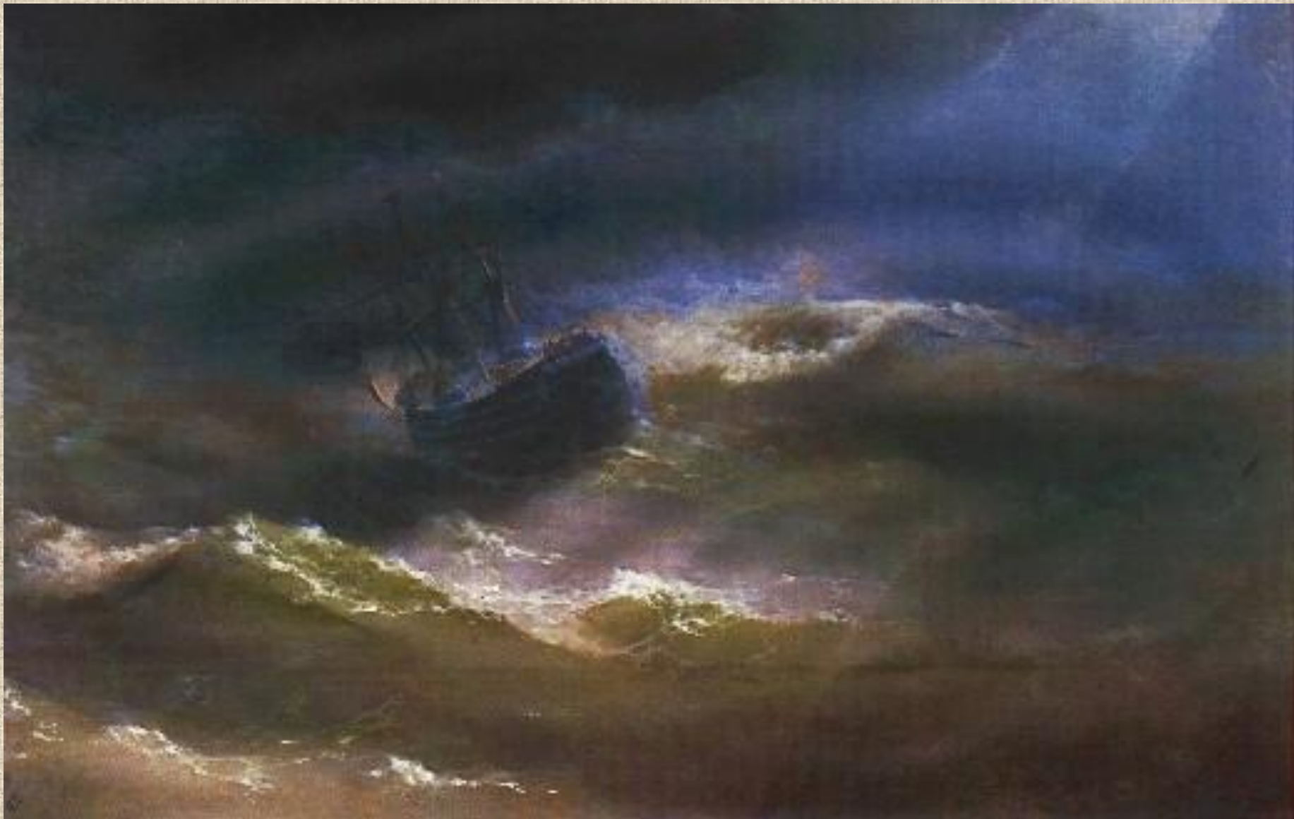
И.К. Айвазовский. «Мария» в шторм.