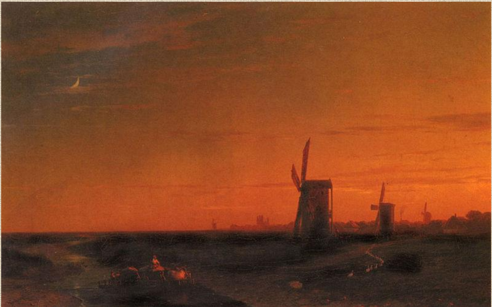
И.К. Айвазовский . Пейзаж с ветряными мельницами.