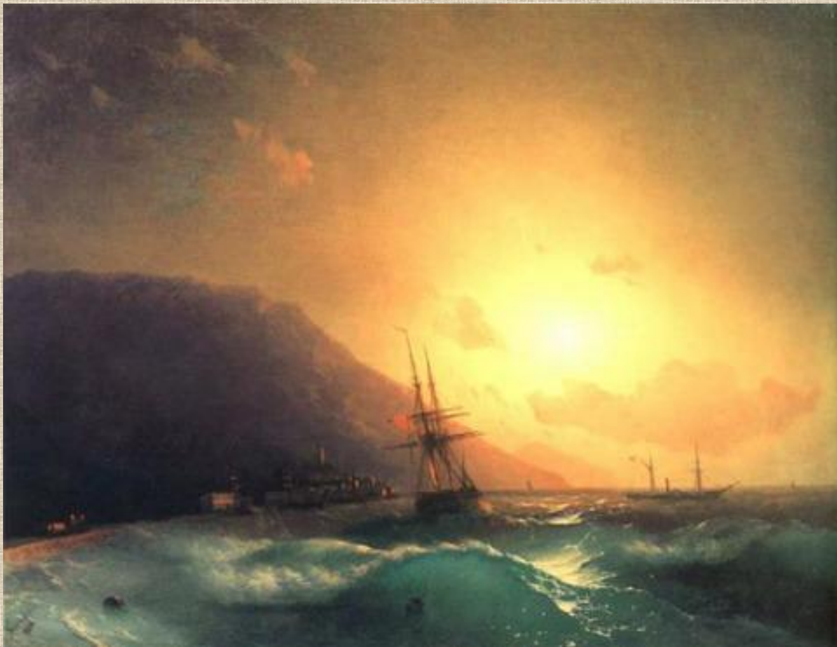
И.К. Айвазовский. У берегов Ялты.