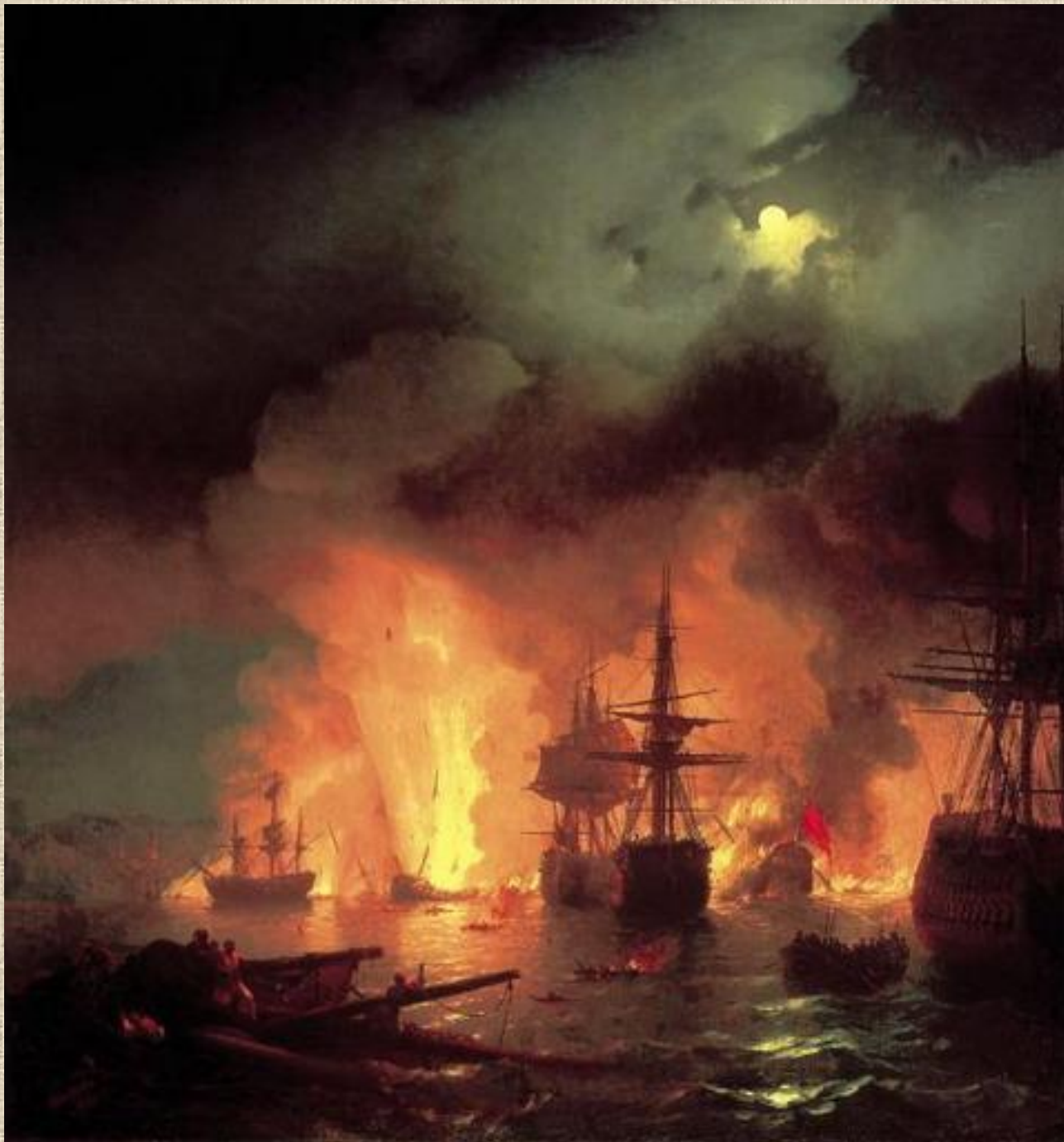
И.К. Айвазовский. Чесменский бой.