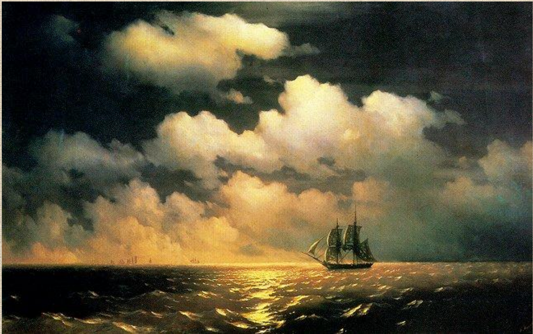
И.К. Айвазовский. «Меркурий»