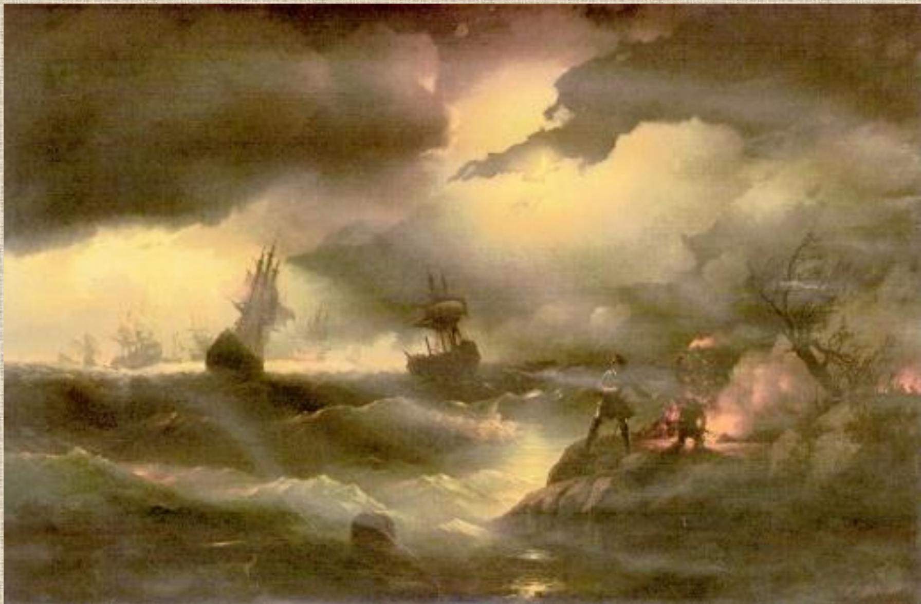
И.К. Айвазовский . Петер.