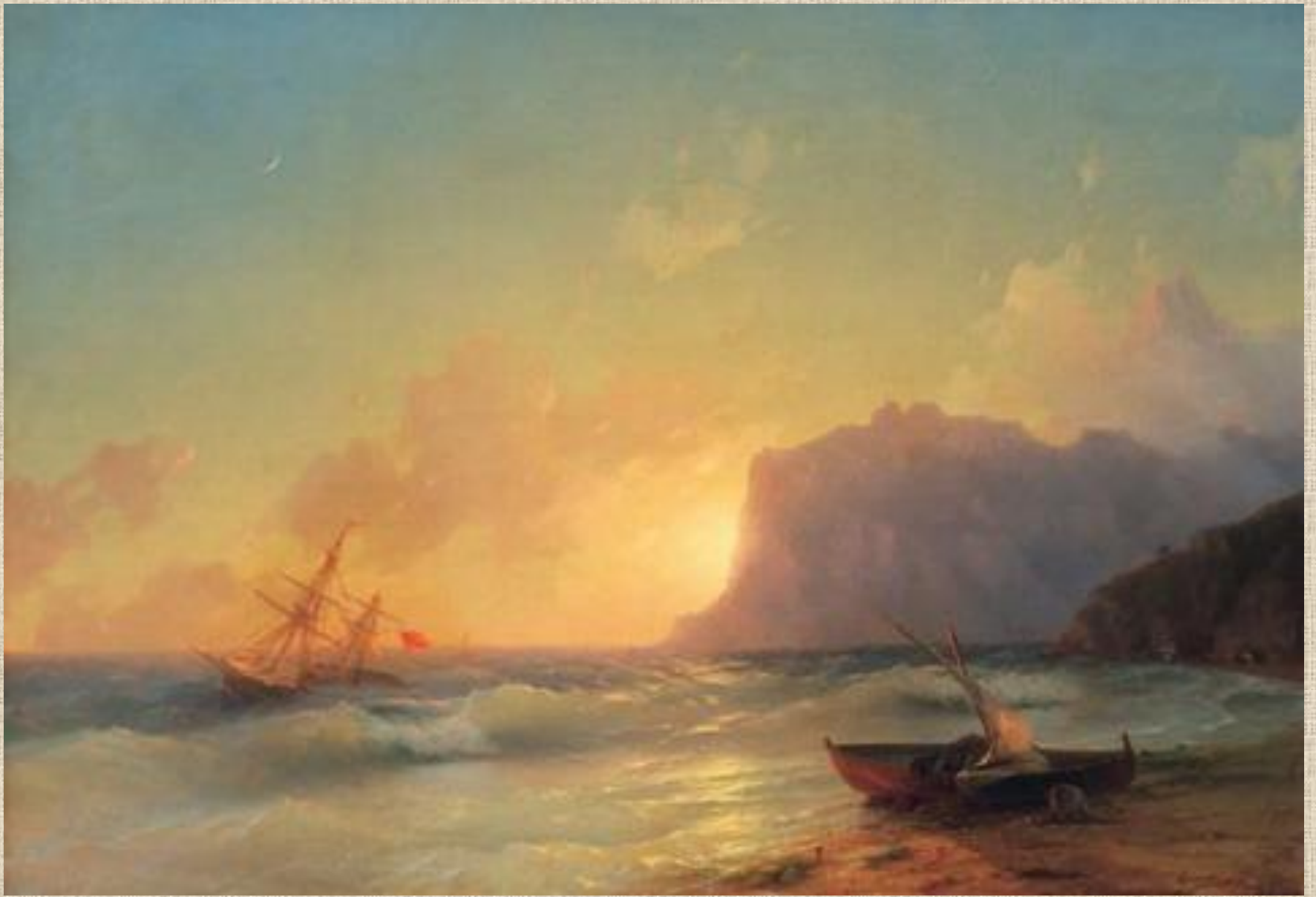
И.К. Айвазовский. Море. Коктебелі