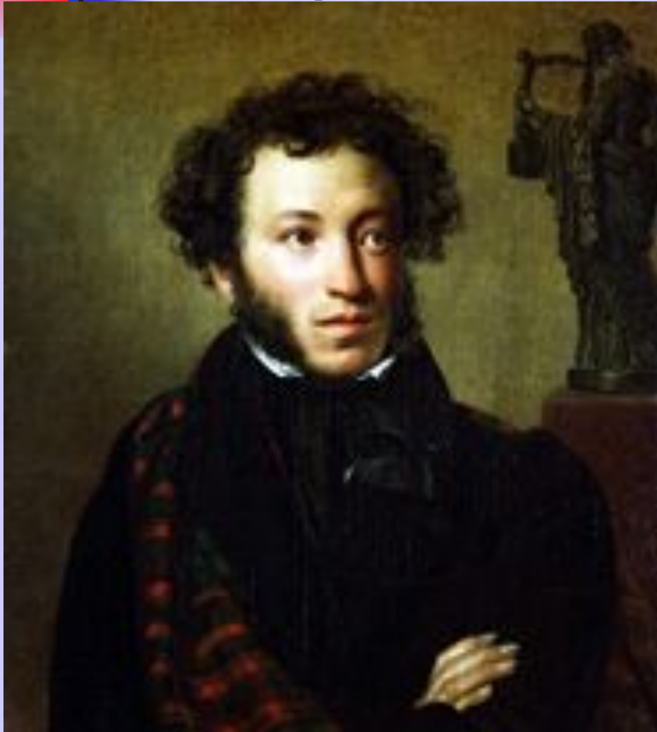
О.А. Кипренский. Портрет А.С. Пушкина.