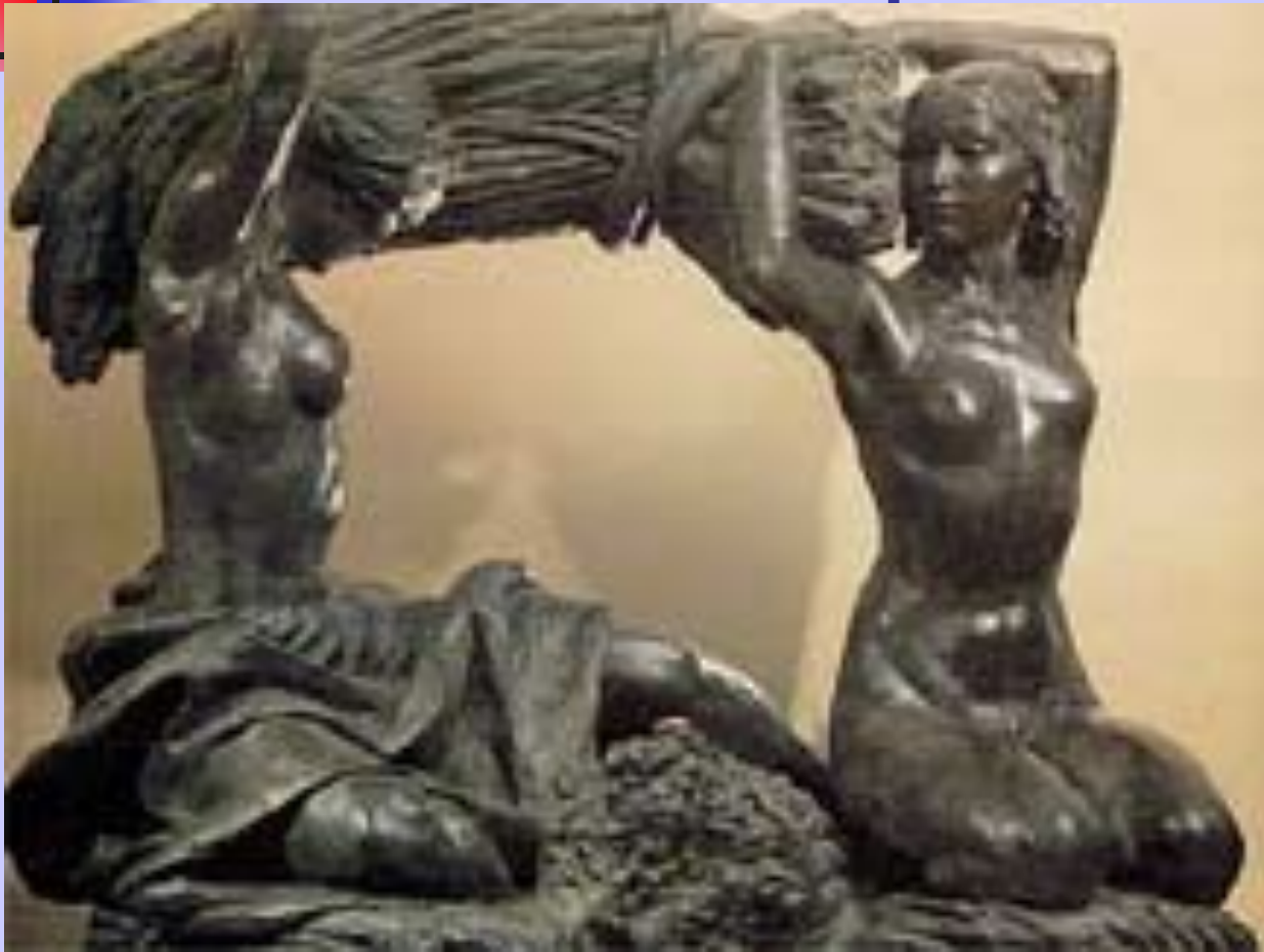
В. И. Мухина. «Хлеб». Декоративная композиция для нового Москворецкого моста в Москве.