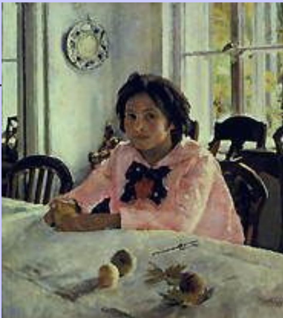
В. А. Серов. «Девочка с персиками».