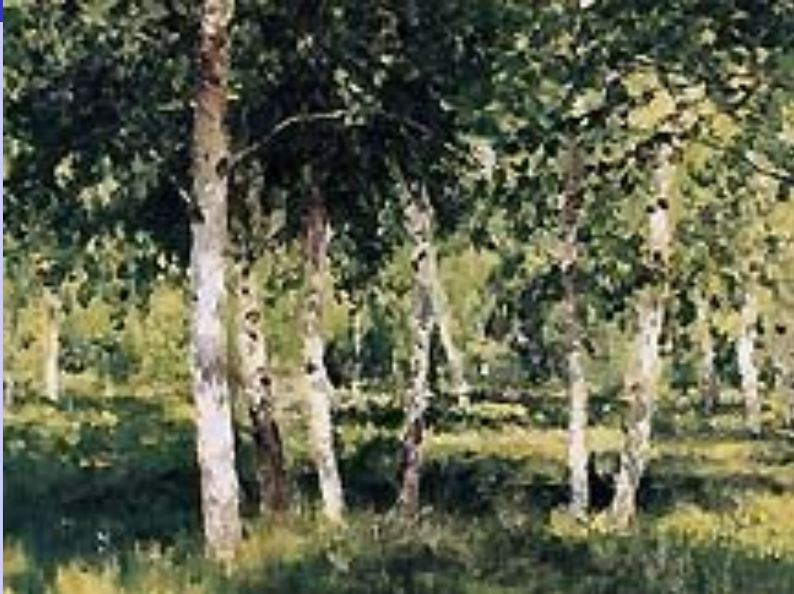
И.И. Левитан. Березовая роща.