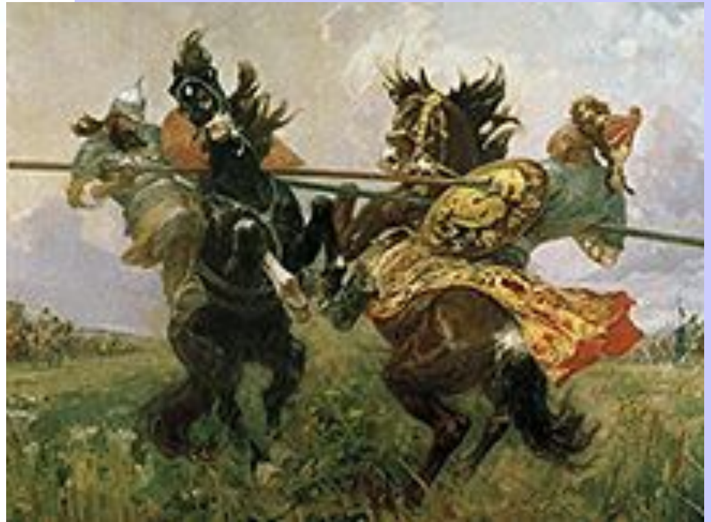
М.И. Авилов Поединок на Куликовом поле