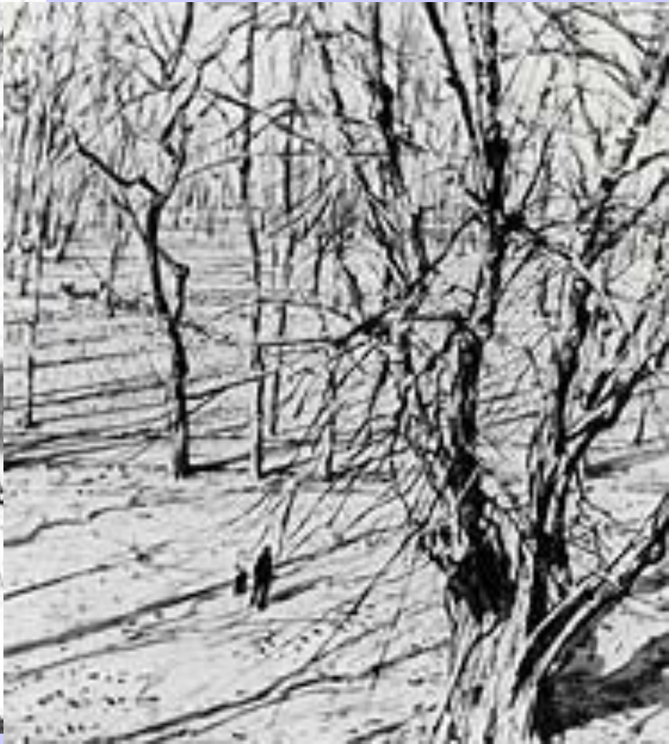
Г. С. Верейский.

Иллюстрация к роману А. Н. Толстого «В саду Русского музея. Ленинград». «Петр I».