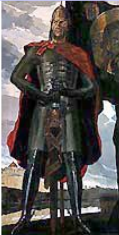
П. Д. Корин «Александр Невский»