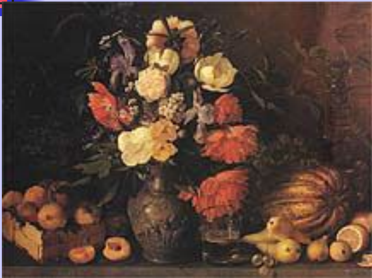
И. Т. Хруцкий. «Цветы и плоды».