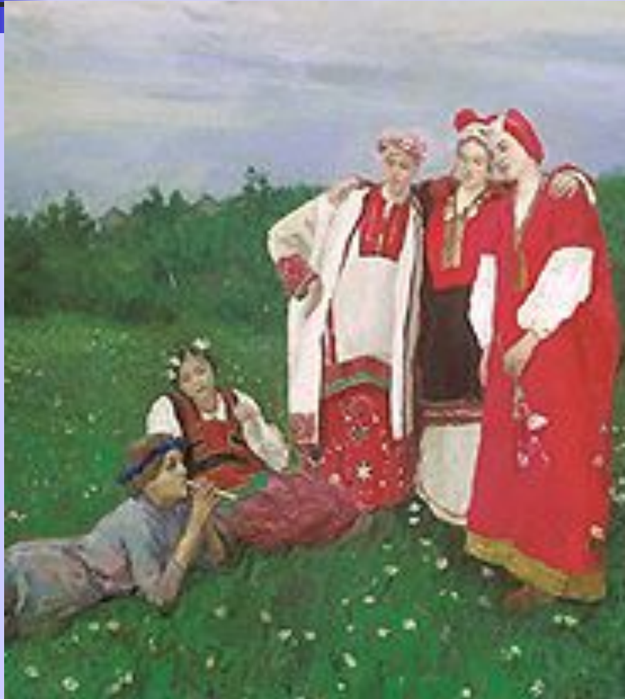
К.А. Коровин. Северная идиллия.