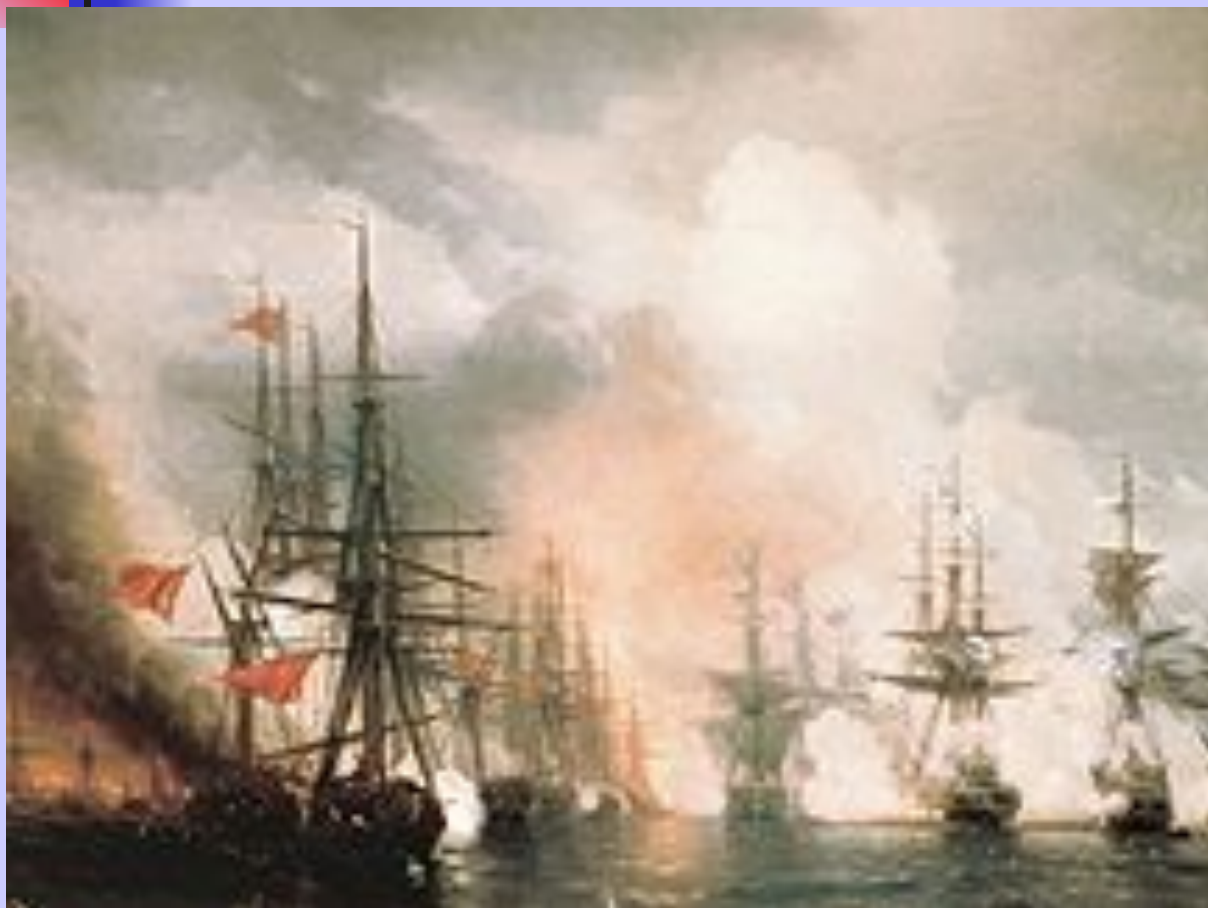
И.К. Айвазовский. Синопский бой.