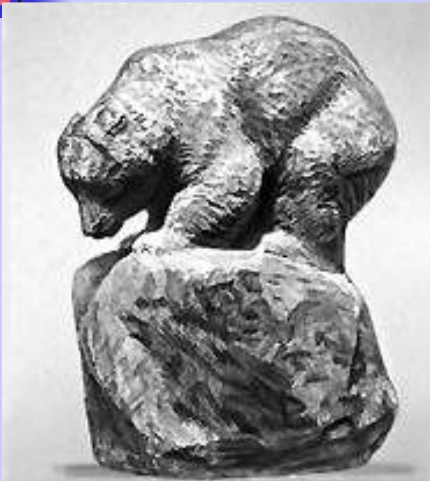
В. А. Ватагин. «Медведь».