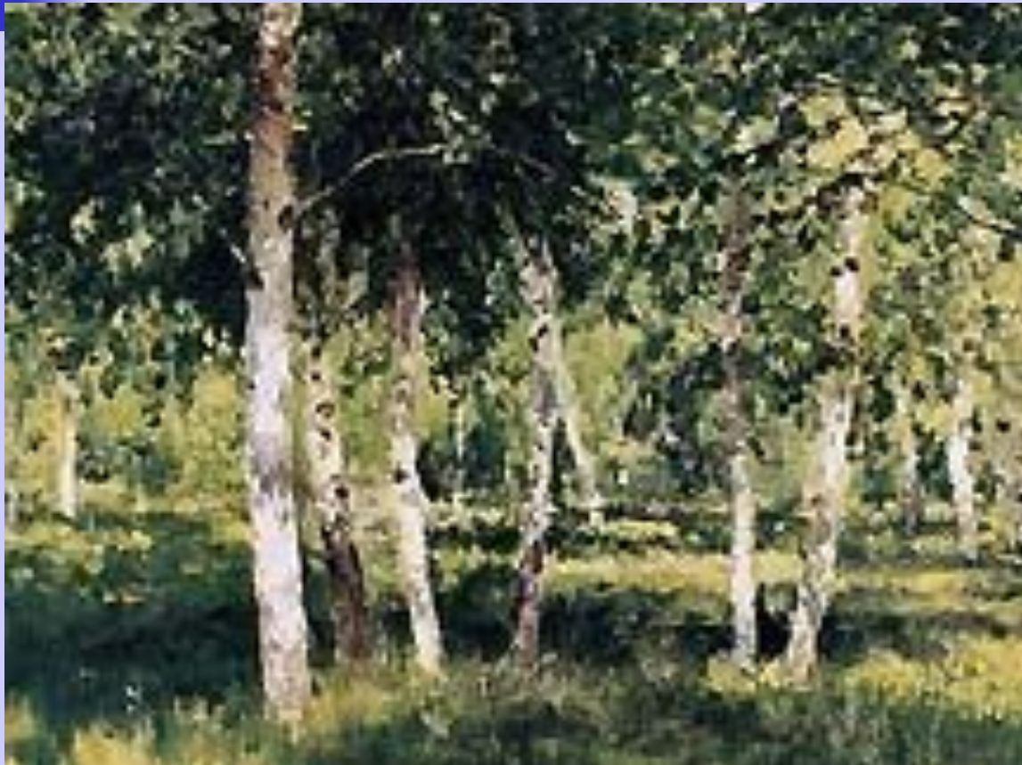
И.И. Левитан. Березовая роща.