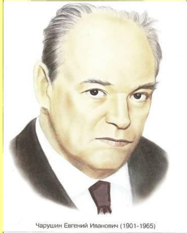
Евгений Иванович Чарушин