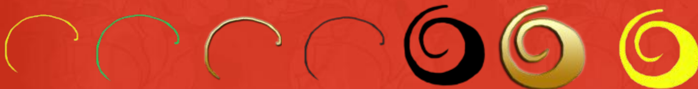
Завитки большие и малые