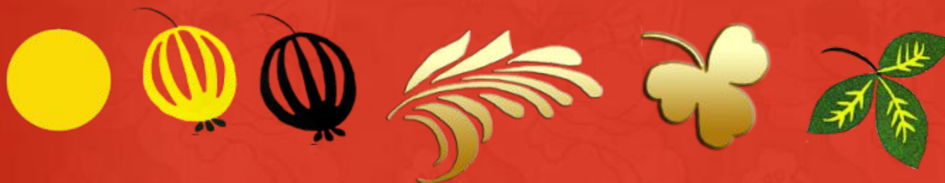
Ягоды и ветки