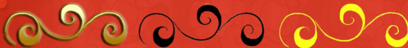
Ведущий стебель «криуль»