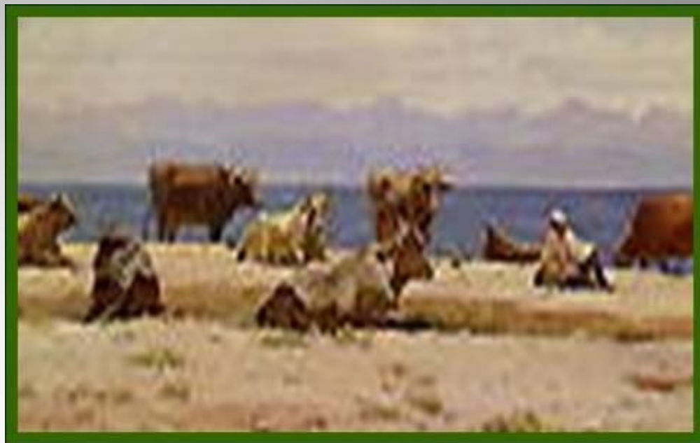
Гапар Айтиев «Полдень на Иссык-Куле»