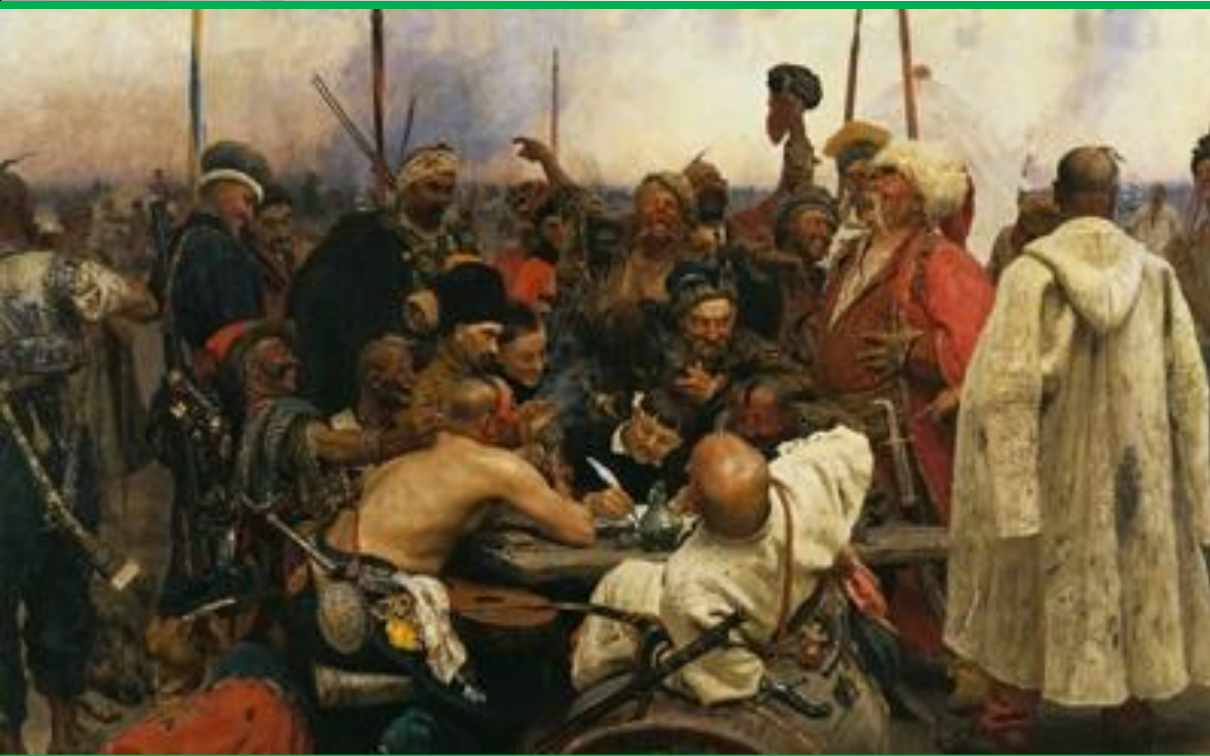
И.Репин «Запорожцы пишут письмо турецкому султану»

жанр изобразительного искусства, посвященный воссозданию событий прошлого и современности, имеющих историческое значение.