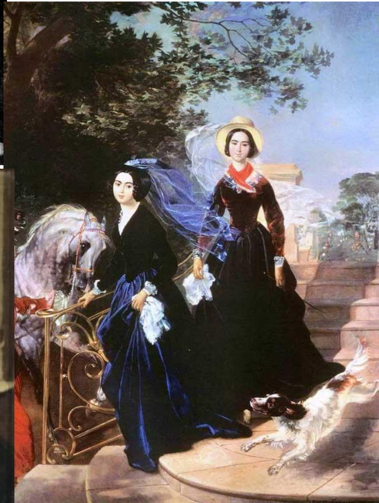
К.Бруеллов «Портрет сестер Шишмаревых» (1839)