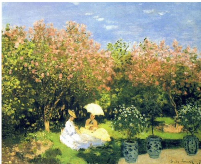
К. Моне. Сад (фрагмент)

жанр изобразительного искусства, посвящённый повседневной частной и общественной жизни, современной художнику