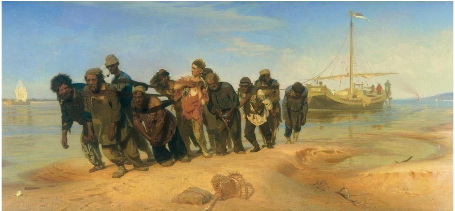
И. Репин. Бурлаки на Волге

жанр изобразительного искусства, посвященный воссозданию событий прошлого и современности, имеющих историческое значение.