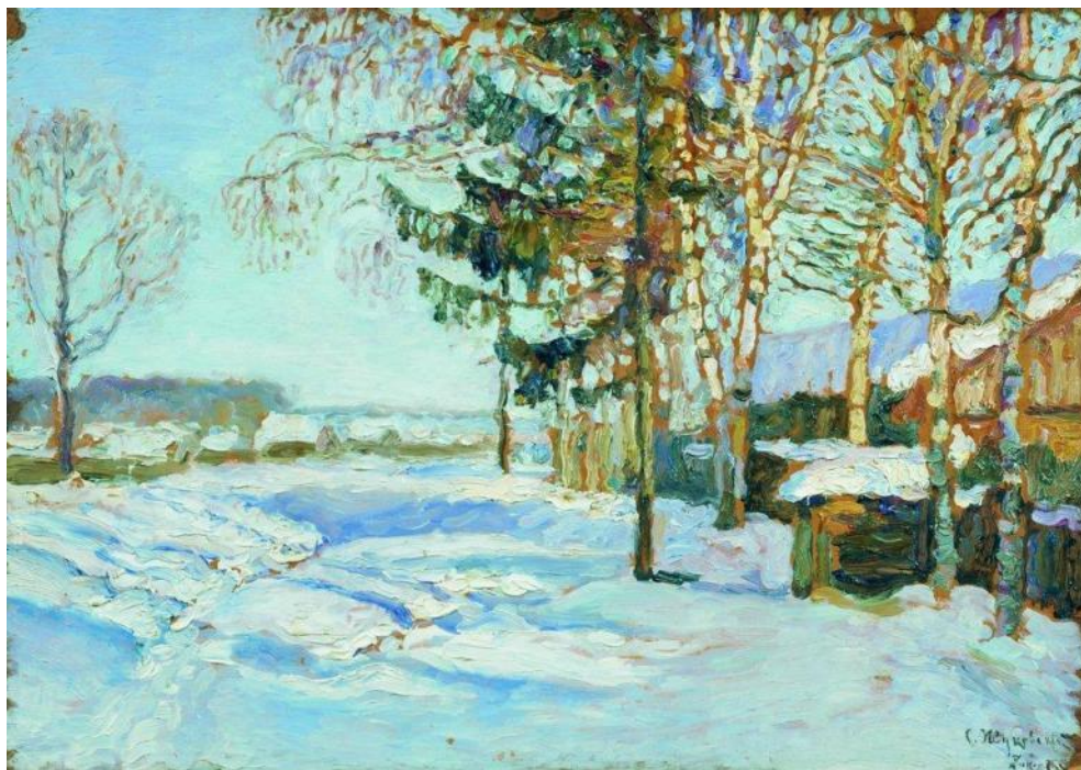
С. Ю. Жуковский. К весне (фрагмент)

жанр или отдельное произведение, в котором основным предметом изображения является природа.