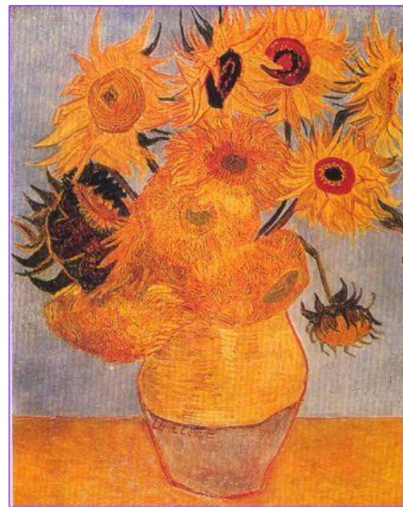
В. Ван Гог. Подсолнух