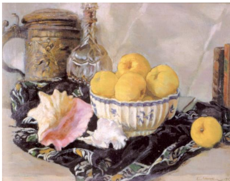
Е. Е. Лансере. Натюрморт

жанр изобразительного искусства, который посвящен изображению предметов, неживой природы