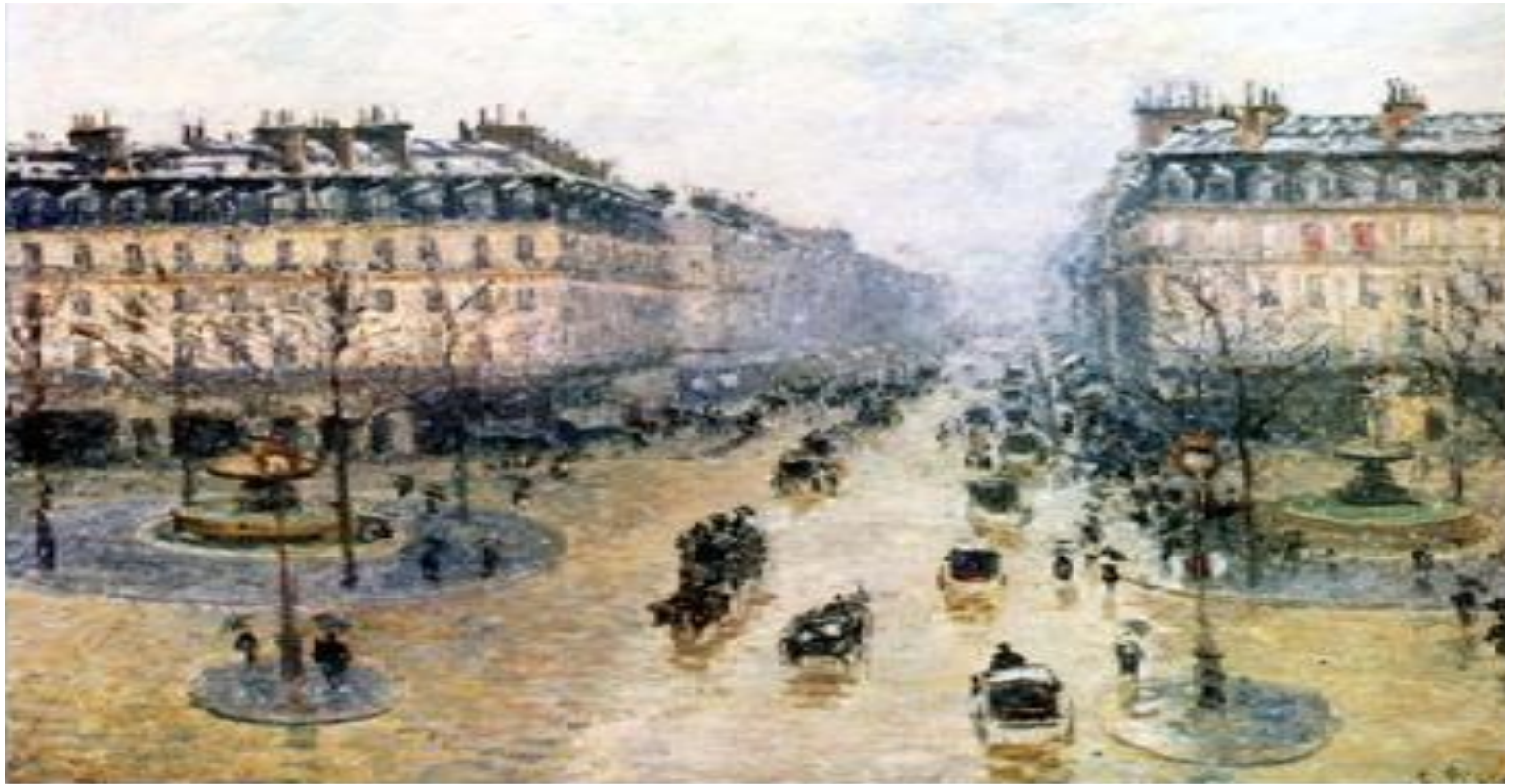
«Оперный проезд в Париже» Художник: Камиля Писсарро

В XIX веке городской пейзаж находит своё отражение в творчестве французского художника - импрессиониста Камиля Писсарро, который в своих картинах изображал текучесть жизни и переменчивость большого города