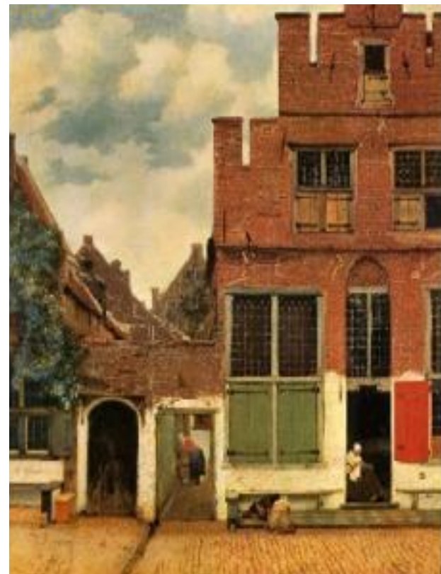
«Улочка Дельфта» Художник: Ян Вермеер