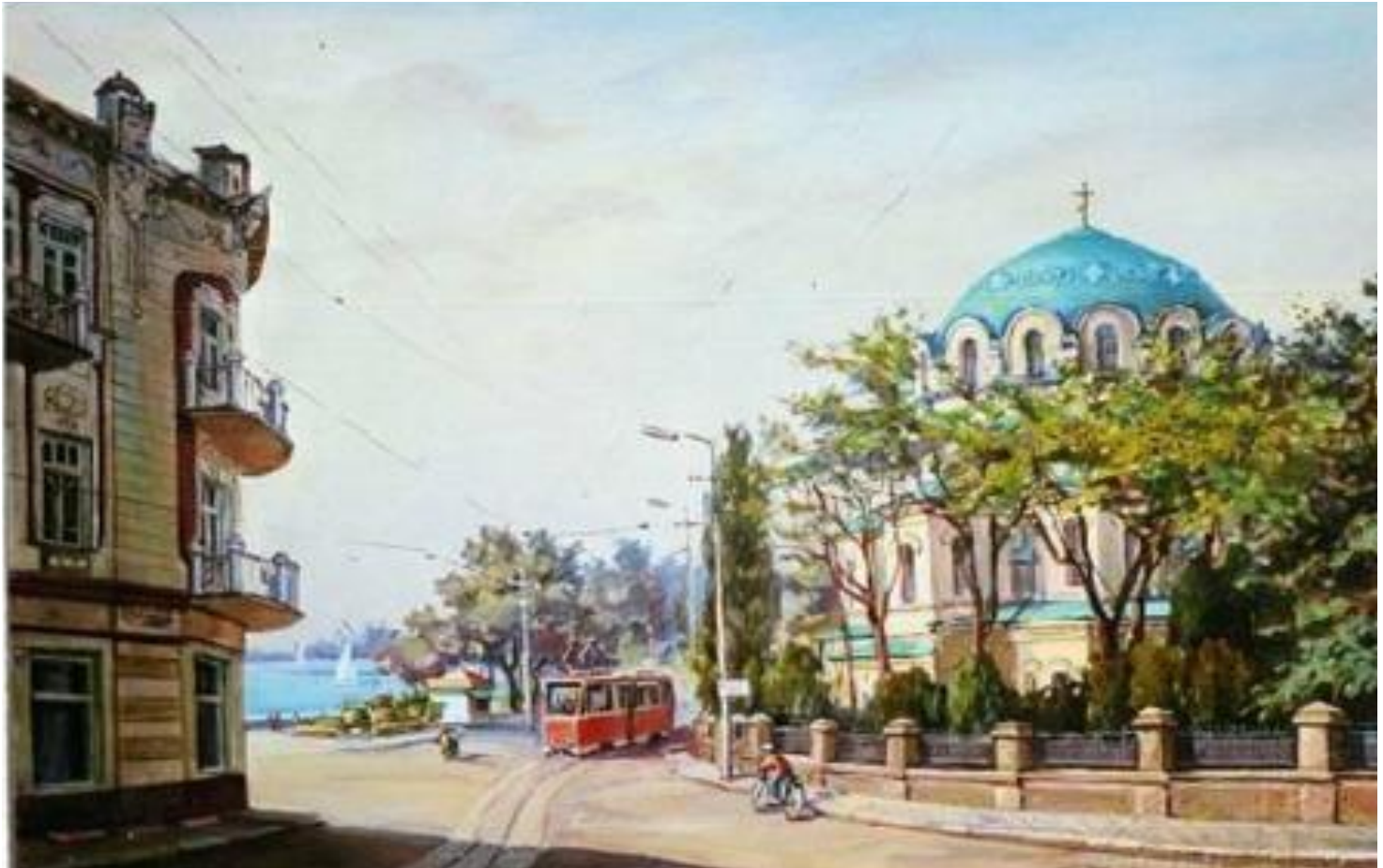
«Переулки старого города» Художник: Павел Голик

Художников всегда привлекает разнообразие этих форм и конструкций. Увлечателен и сам быт этих улиц, наполненных непрерывным движением