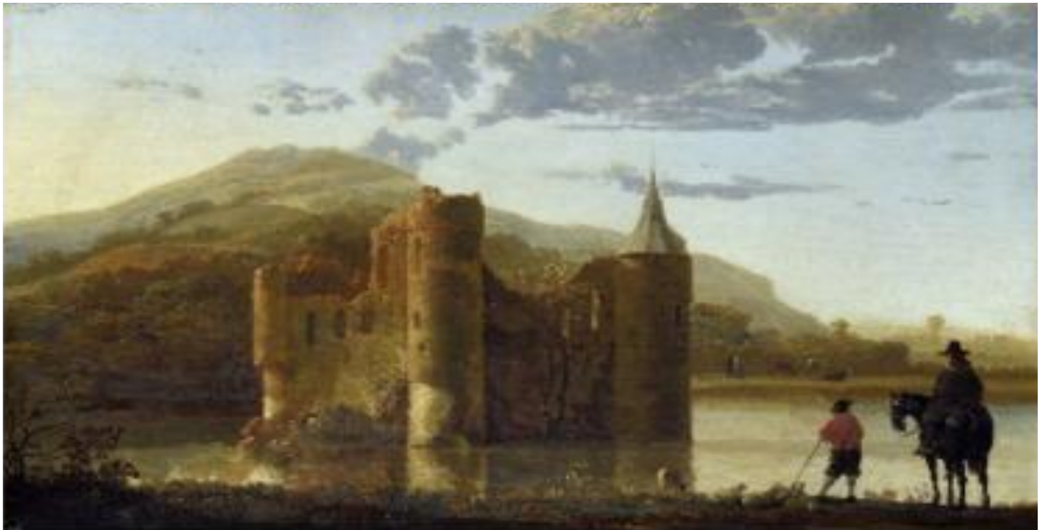
«Пейзаж с замком Берген»

Впервые достоверное изображение города появилось в период готики. В искусстве Возрождения, а затем и в более поздние времена художники, увлекаясь пространственными перспективными построениями, часто изображали несуществующую, придуманную архитектуру