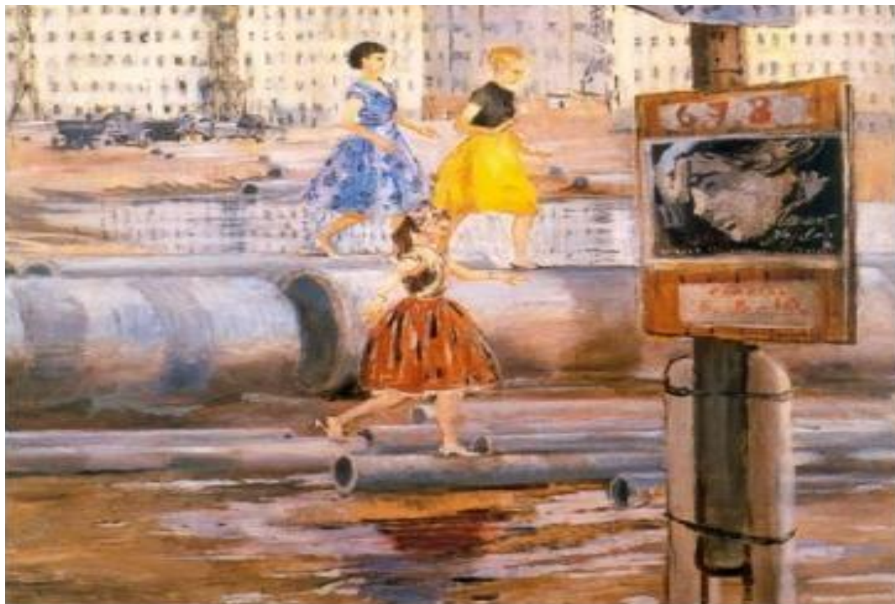
«Первые модницы нового квартала» Художник: Юрий Пименов

Главный предмет наблюдения и поэтизации – окружающие Москву новые кварталы. Он любит самую их неоконченность и необжитость, временным, еще не устроенным бытом