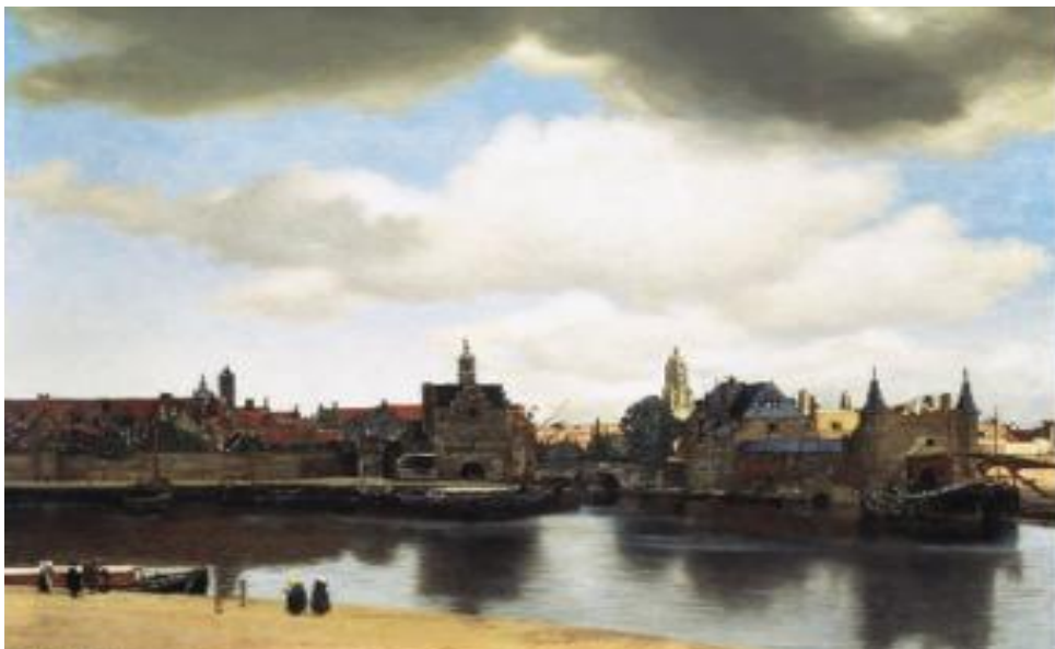
«Вид города Делфта» Художник: Ян Вермеер

Голландский живописец Ян Вермеер впервые стал писать картины с натуры, что стало новшеством голландской живописи XVII века. Его работы «Вид города Делфта» и «Улочка Дельфта» являются первыми образцами пленэрной живописи