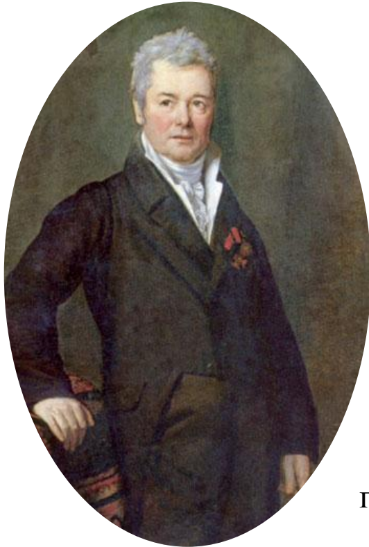
Федор Яковлевич Алексеев (1753 – 1824) русский живописец

Потом появились мастера, которые, наоборот, создавали очень точные панорамные городские пейзажи. Они получили название ведута