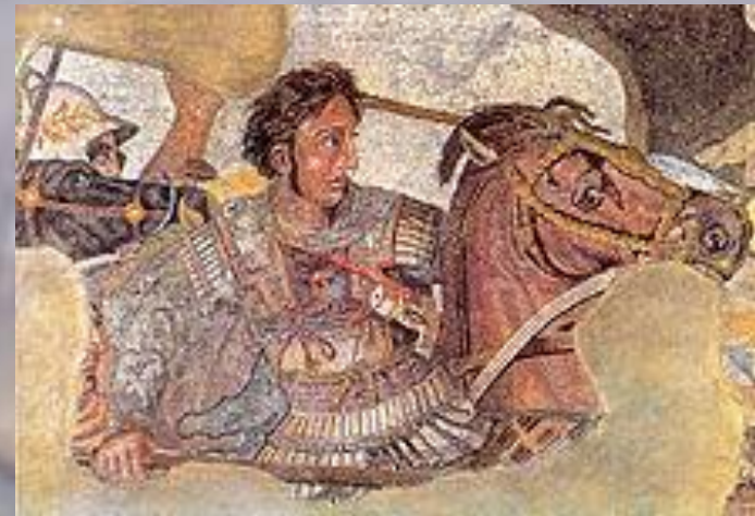
Мозаика. Александр на Буцефале