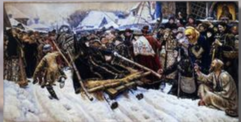
Василий Суриков «Боярыня Морозова»