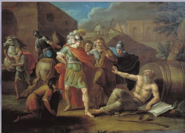
Корнелис де Вос «Александр и Диоген».

Историческая живопись — жанр живописи, берущий свое начало в эпоху Ренессанса и включающий в себя произведения не только на сюжеты реальных событий, но также мифологические, библейские и евангельские картины, изображает важные для отдельного народа или всего человечества события прошлого.