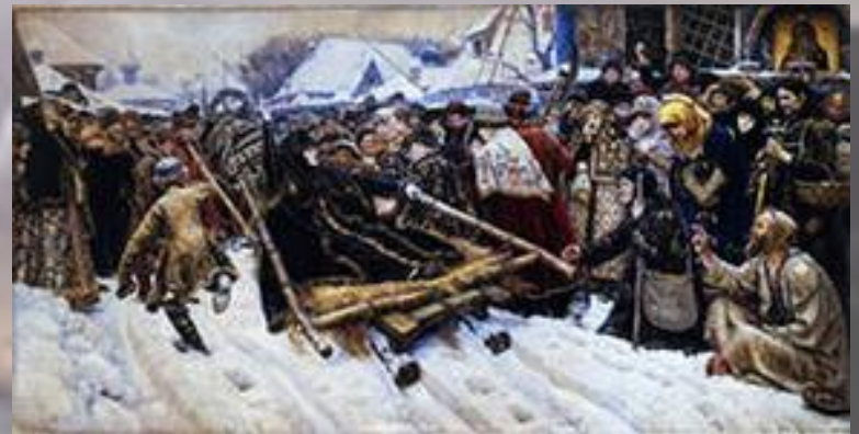
Василий Суриков «Боярыня Морозова»