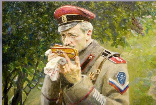
Павел Рыженко «Историческая живопись». 1970 г.