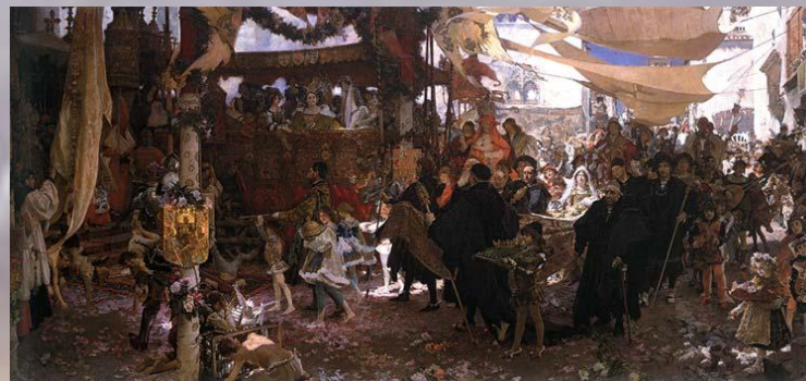
Франциско Прадилля «Крещение принца Хуана». 1910 г.