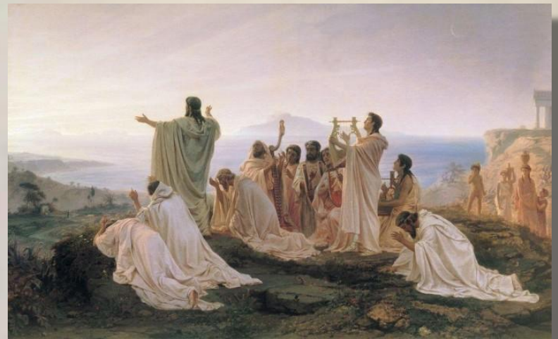
Фёдор Бронников «Пифагорейцы празднуют восход солнца». 1869 г.