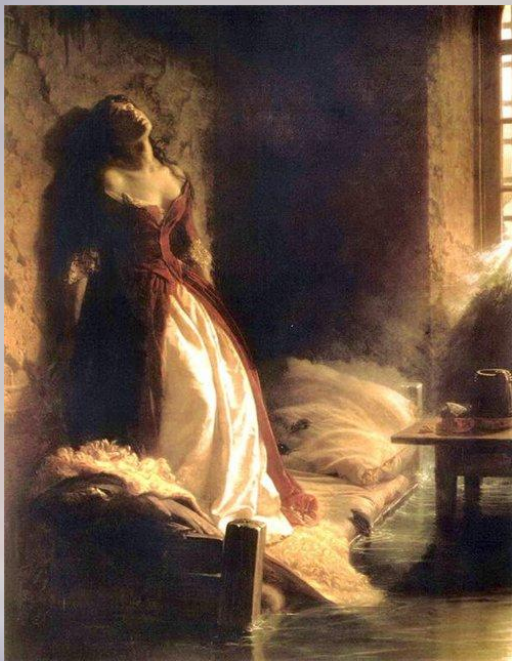
Константин Флавицкий «Княжна Тараканова». 1864 г.