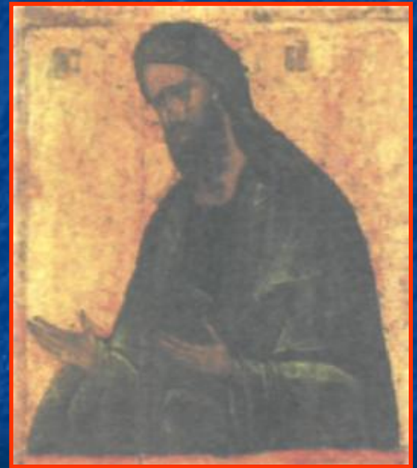
Иоанн Креститель. Икона А. Рублева.

Портреты ( парсуны ) пишутся яичными красками на доске