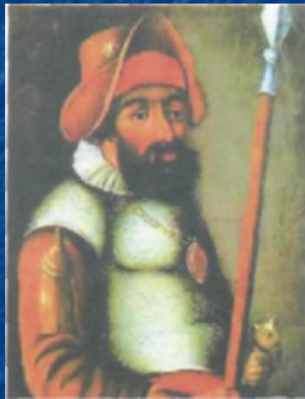
Ермак. Портрет неизвестного художника XVII век.

Портреты пишутся масляными красками на холсте