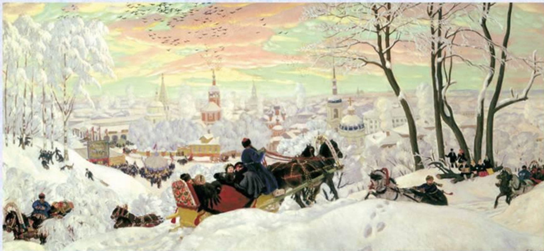
Б.М. Кустодиев «Масленица»

Зимний день короток. Солнце садится. На изумрудно-зелёном небе золотые и розовые облака.