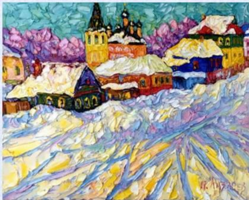
Павел Лазарев «Снег в марте»

Задание для первой команды: Какими цветами Павел Лазарев пишет снег на картине «Снег в марте».