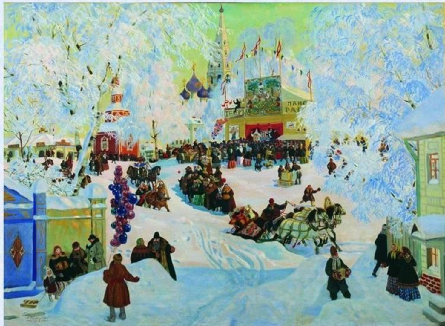
Б.М.Кустодиев "Масленица" 1920

На картине изображён праздничный день. Мы видим, как снег сверкает и искрится на солнце.