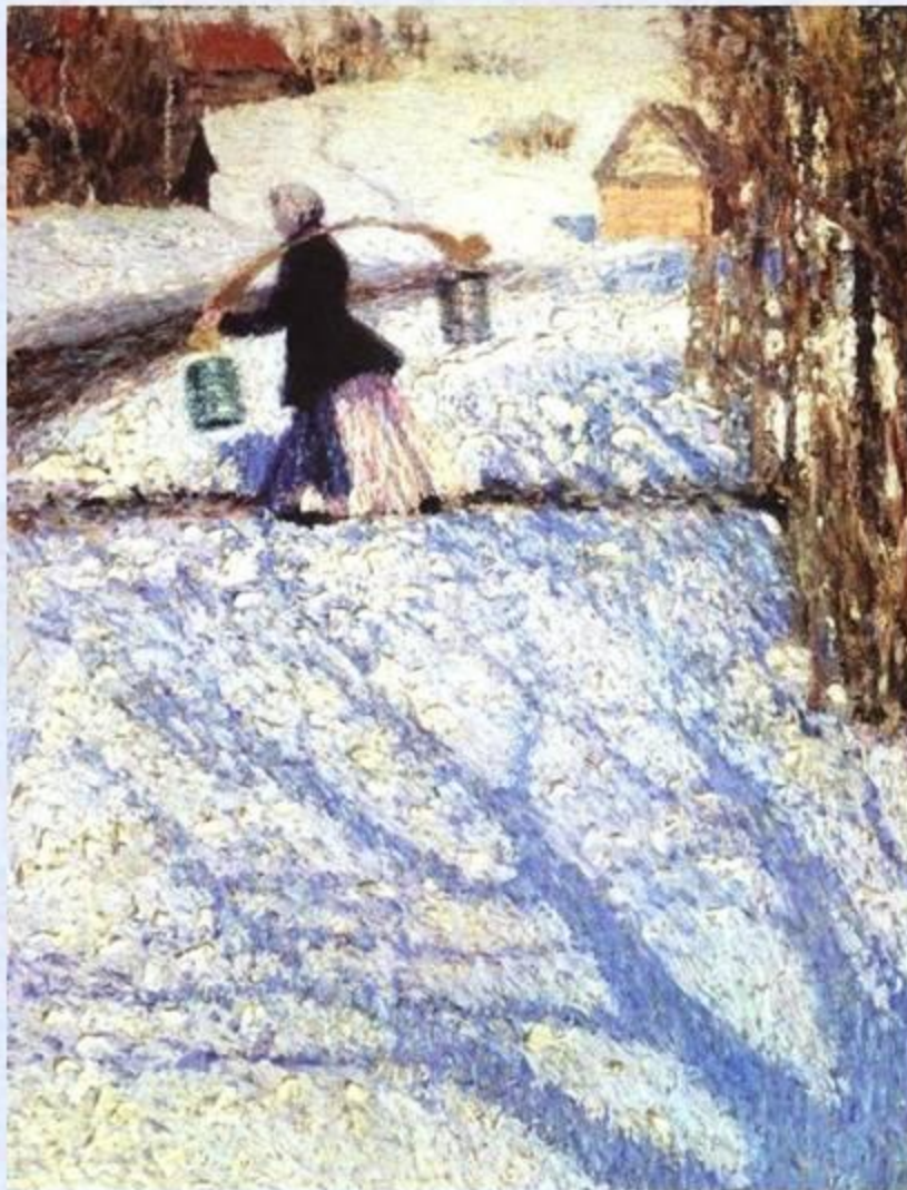
И. Э. Грабарь «Мартовский снег»

На этой картине изображён последний снег уходящей зимы . Чем ближе к весне, тем ярче солнце и резче тени. Синие , голубые тени деревьев разбежались, исполосатили мартовский снег.