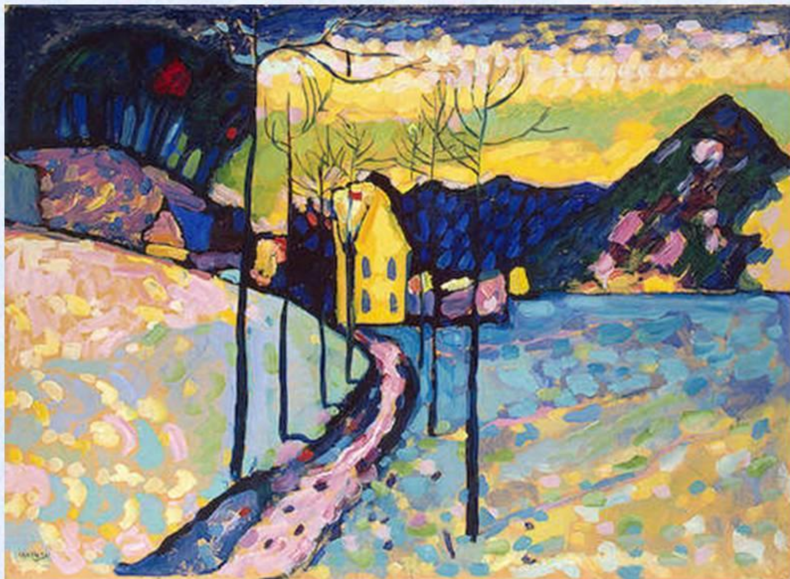
Василий Кандинский «Зима»