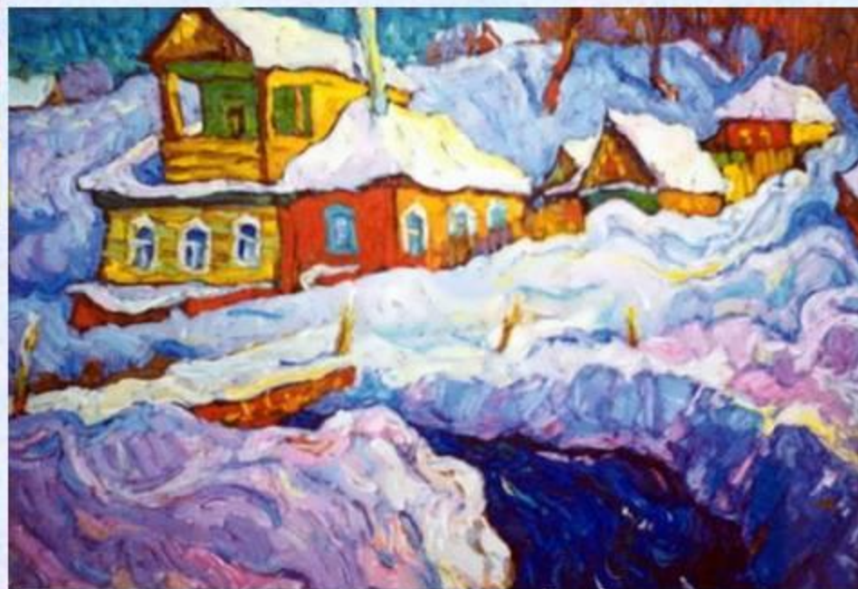
Павел Лазарев «Зимний пейзаж»

Задание для второй команды. Какие оттенки использует художник для изображения снега в картине «Зимний пейзаж».