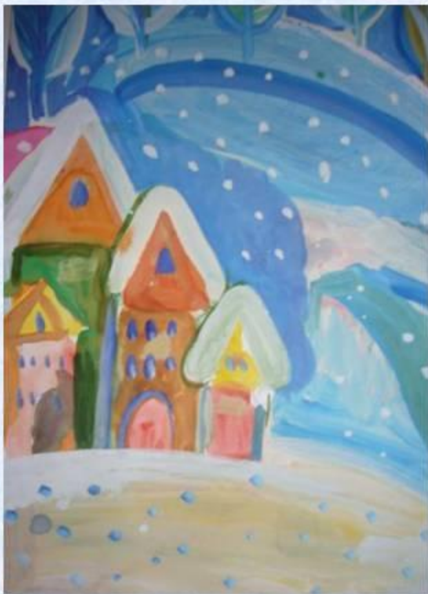
Анфалова Дарья 2 «В»