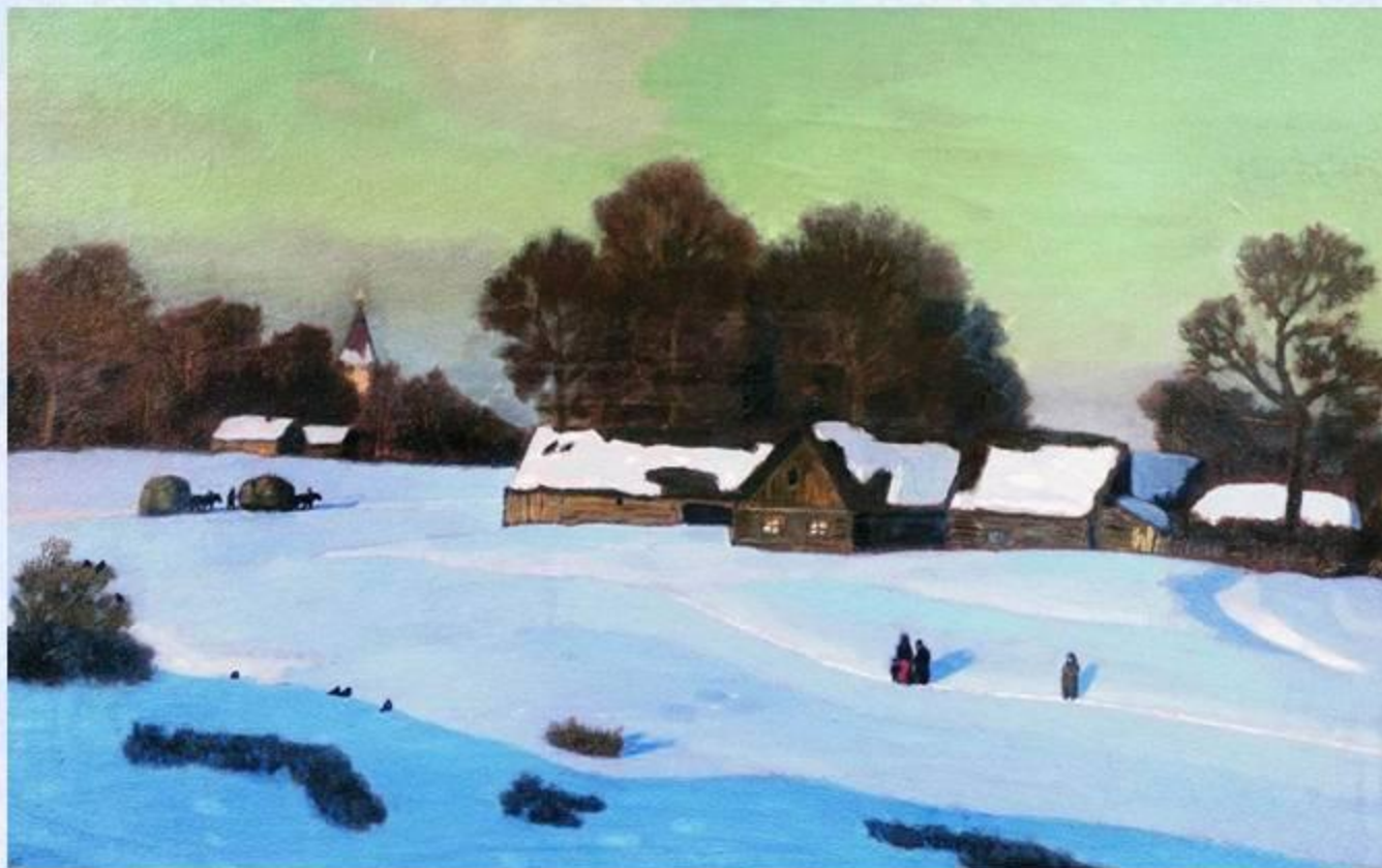
Н.П. Крымов «Зима»

Два противоположных цвета: тёплый- жёлтый и холодный — голубой соперничают друг с другом. И от этого контраста каждый цвет выиграл, стал ещё выразительней.