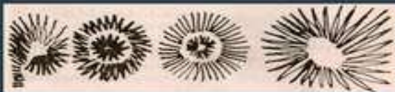
Штрих, идущий от центра круга.