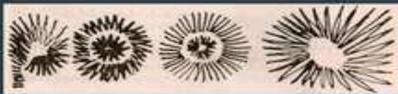
Штрих, идущий от центра круга.