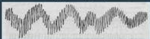
Волнообразный штрих - зигзаг