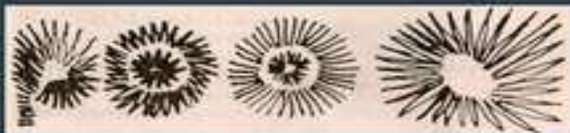
Штрих, идущий от центра круга.