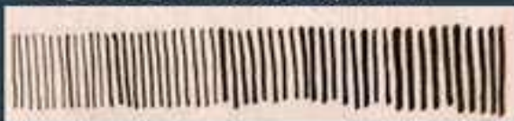
Постепенно усиливая нажим.