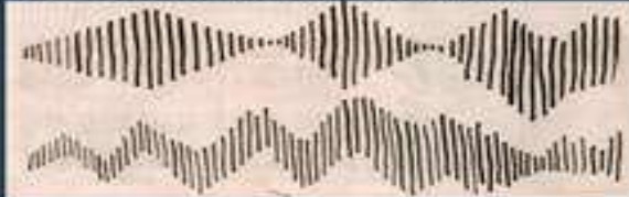
Короткий и длинный штрихи.