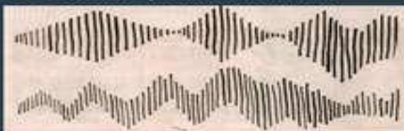
Короткий и длинный штрихи.