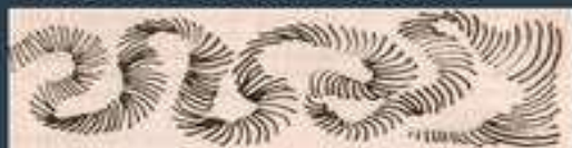
Штрих,двигающийся по кругу.