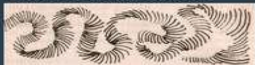
Штрих,двигающийся по кругу.