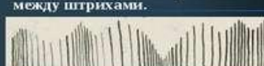
Постепенно укорачивающийся штрих и изменяющиеся паузы-просветы