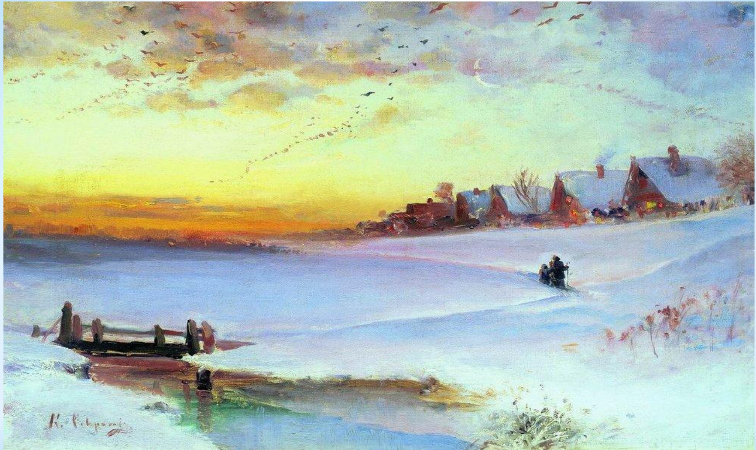
* Алексей Саврасов «Зимний пейзаж»