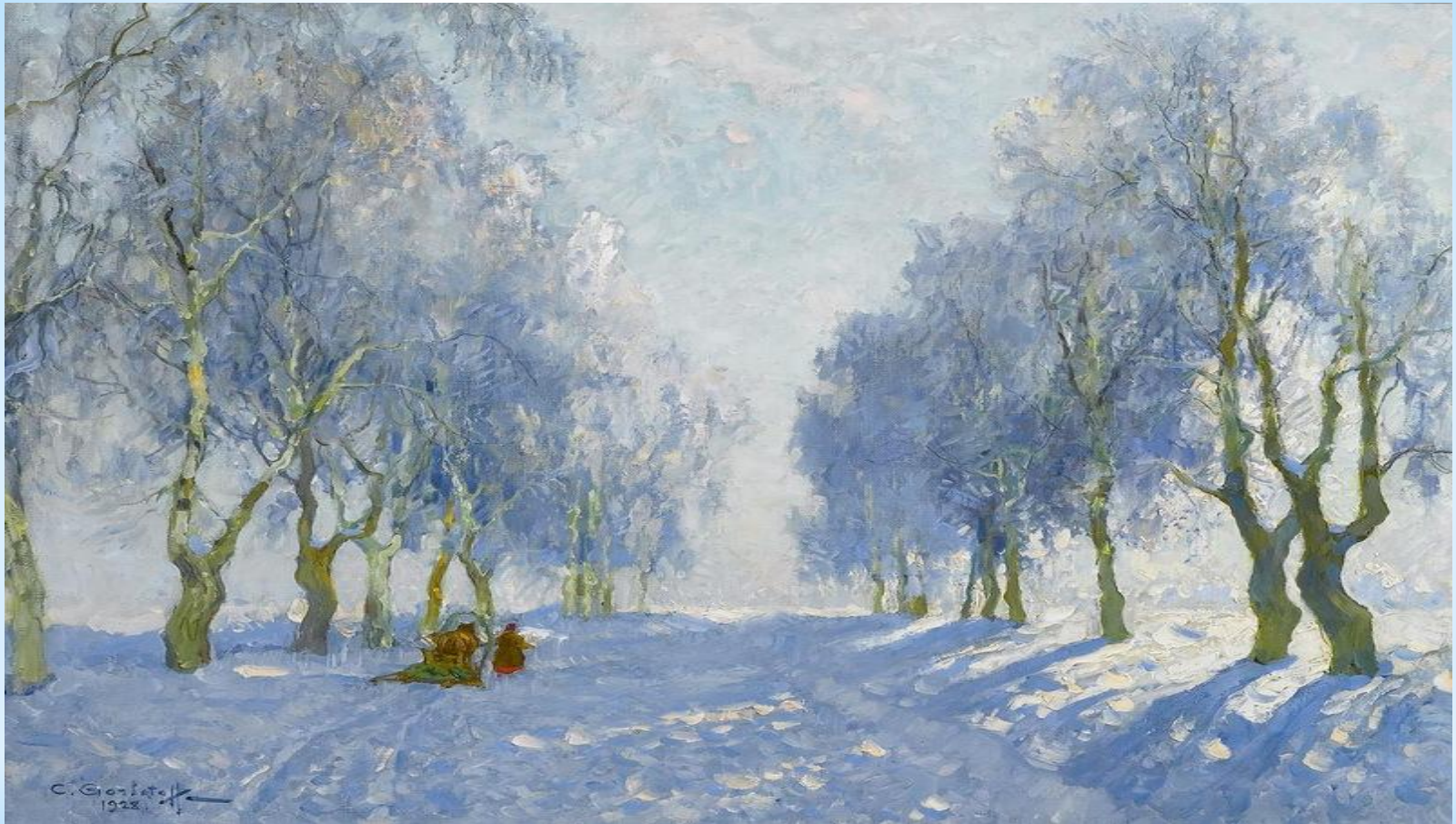
* Алексей Саврасов «Зима»