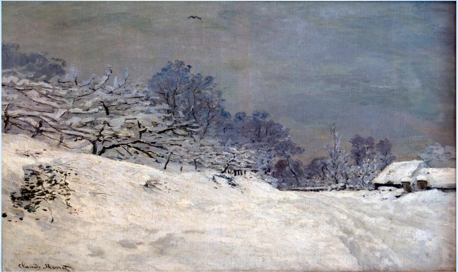
* Клод Моне «Зима»