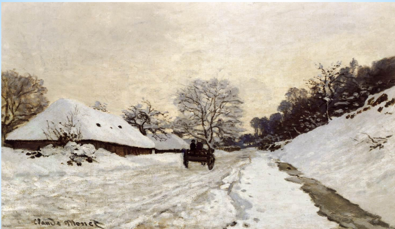
* Клод Моне «Зима»