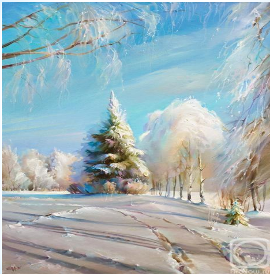
* Романов Роман «Зимний день»