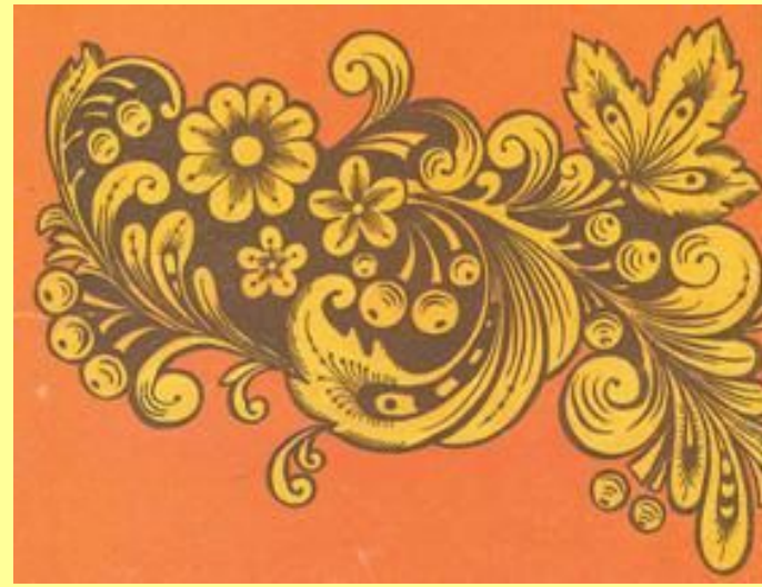
Рисунок "кудрина" является разновидностью росписи "под фон". Для него также характерны золотые силуэты, окруженные цветным фоном, в основном красным или черным. Этот орнамент отличается своеобразным узором, в котором рисунок листьев, цветов, плодов отличается и составлен из округлых кудреватых завитков.