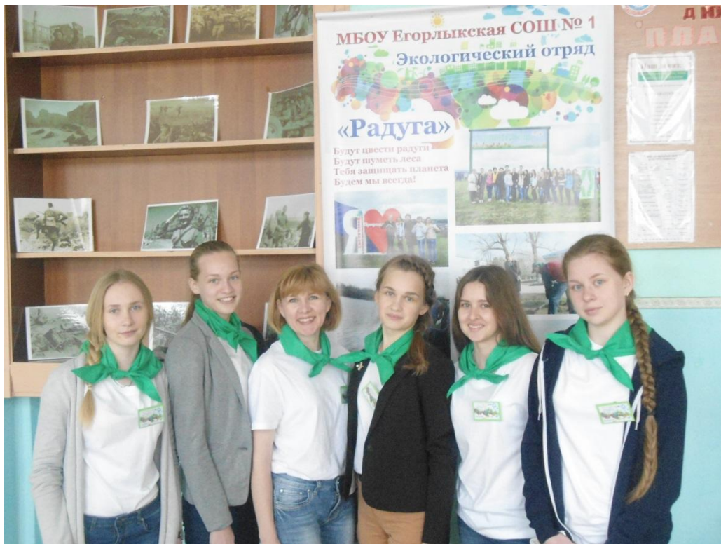
Экологический отряд «Радуга» 1 место