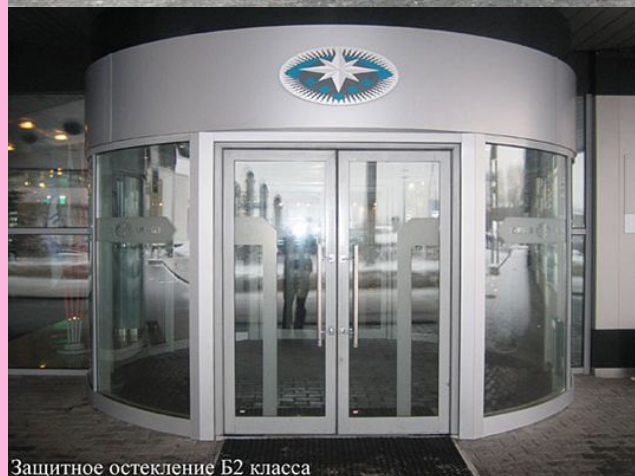
Защитное остекление В2 класса